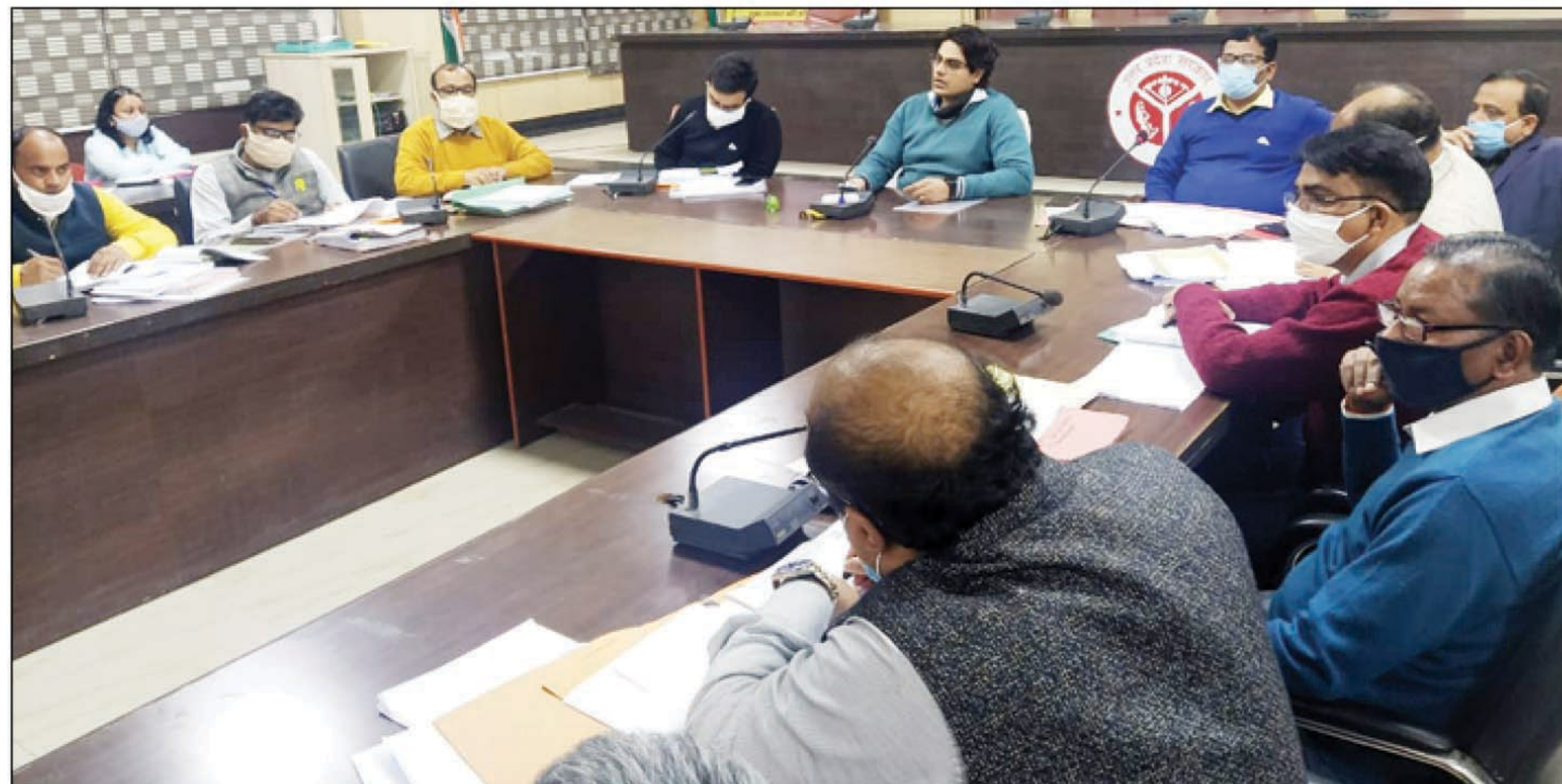
बैठक की अध्यक्षता करते जिलाधिकारी

जिलाधिकारी ने उर्जा विभाग की समीक्षा करते हुए सौभाग्य योजना की प्रगति जानी, जिसमें अधिशाषी अभियंता विद्युत ने बताया कि बचे कार्यों को समय से पूर्ण करा लिया जायेगा। सरकारी विभागों में विद्युत बकायों की अद्यतन स्थिति की