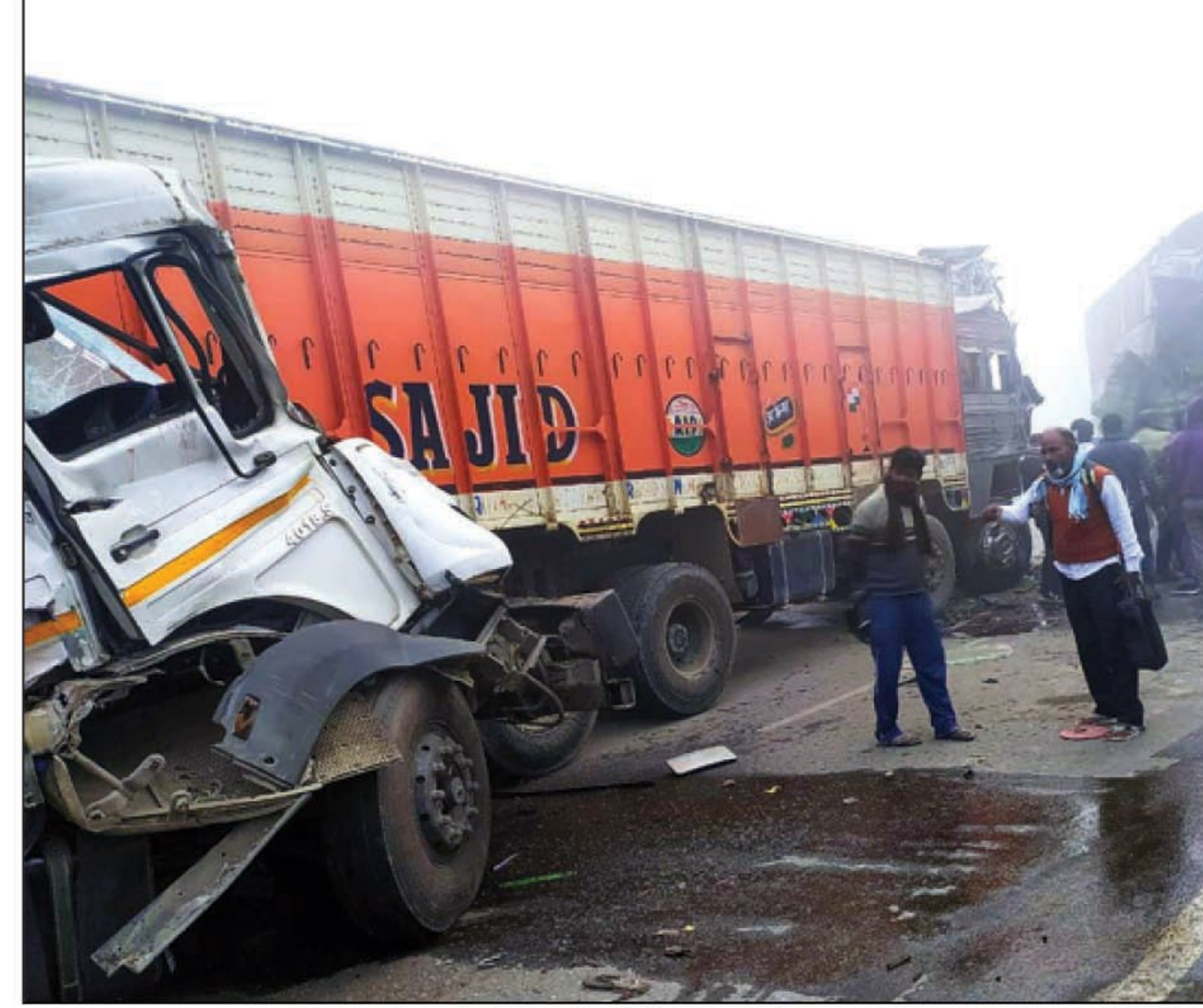
दुर्घटना में क्षतिग्रस्त ट्रक

प्रतापगढ़। शुक्रवार की सुबह घने कोहरे के कारण लखनऊ वाराणसी राजमार्ग पर तीन ट्रकों के आपस में टकरा जाने के चलते एक ट्रक चालक की मौके पर ही मौत हो गयी जबकि दूसरे ट्रक का चालक गंभीर रूप से घायल हो गया। तीनों ट्रकों की भिड़ंत में तीसरे ट्रक का चालक बाल बाल बच गया। जमानकारी के अनुसार शुक्रवार की सुबह घना कोहरा छाया हुआ था। सड़क पर चलने वाले वाहन दिखाई नहीं दे रहे थे। नगर कोतवाली के पृथ्वीवर्ग चैकी क्षेत्र के अन्तर्गत आने वाले छैवा पुल के पास दो ट्रक आमने सामने टकरा