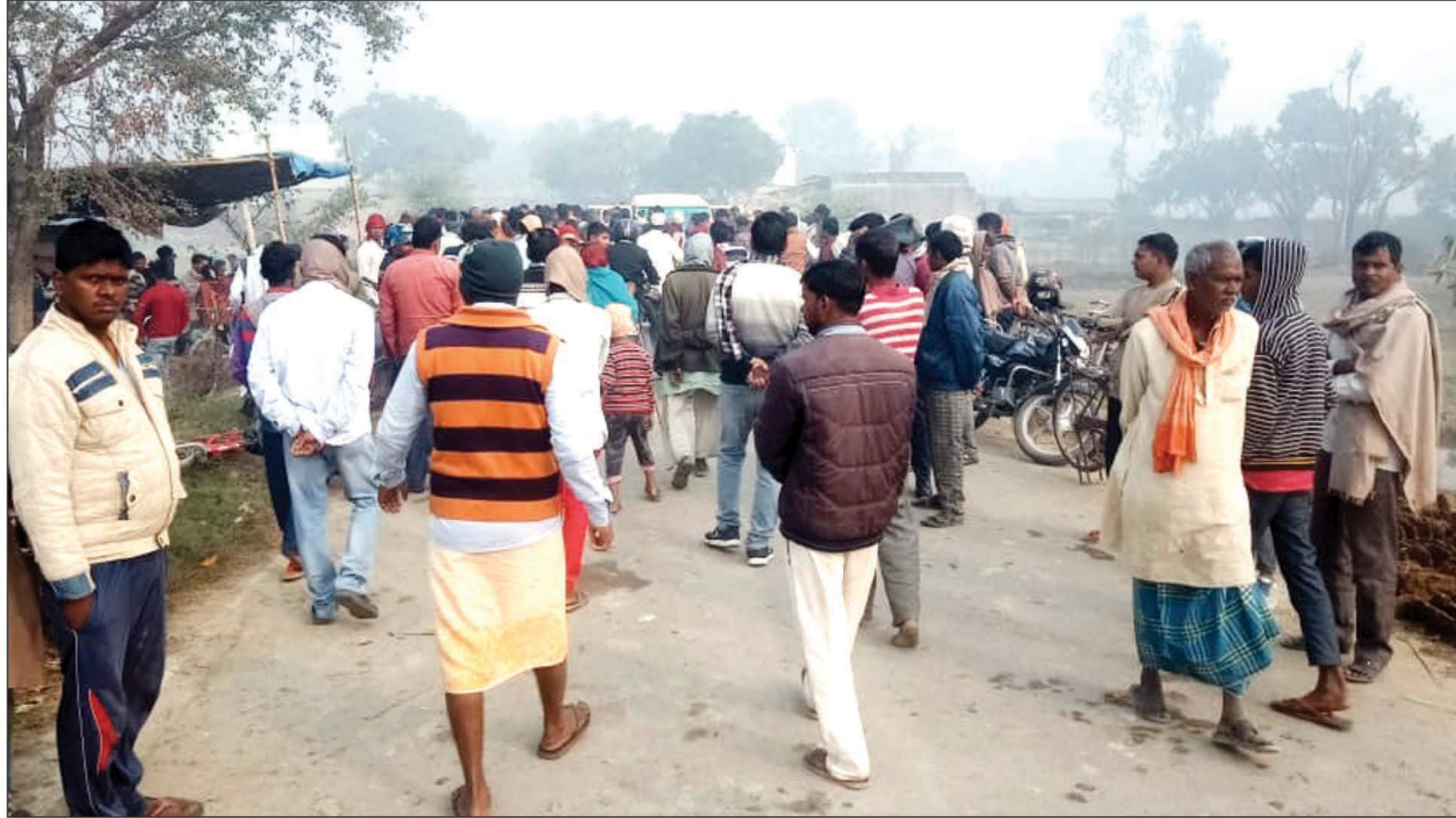
घटना के बाद मौके पर जुटी भीड़

फूलपुर क्षेत्र के हेमापुर गांव में सुबह हुई घटना