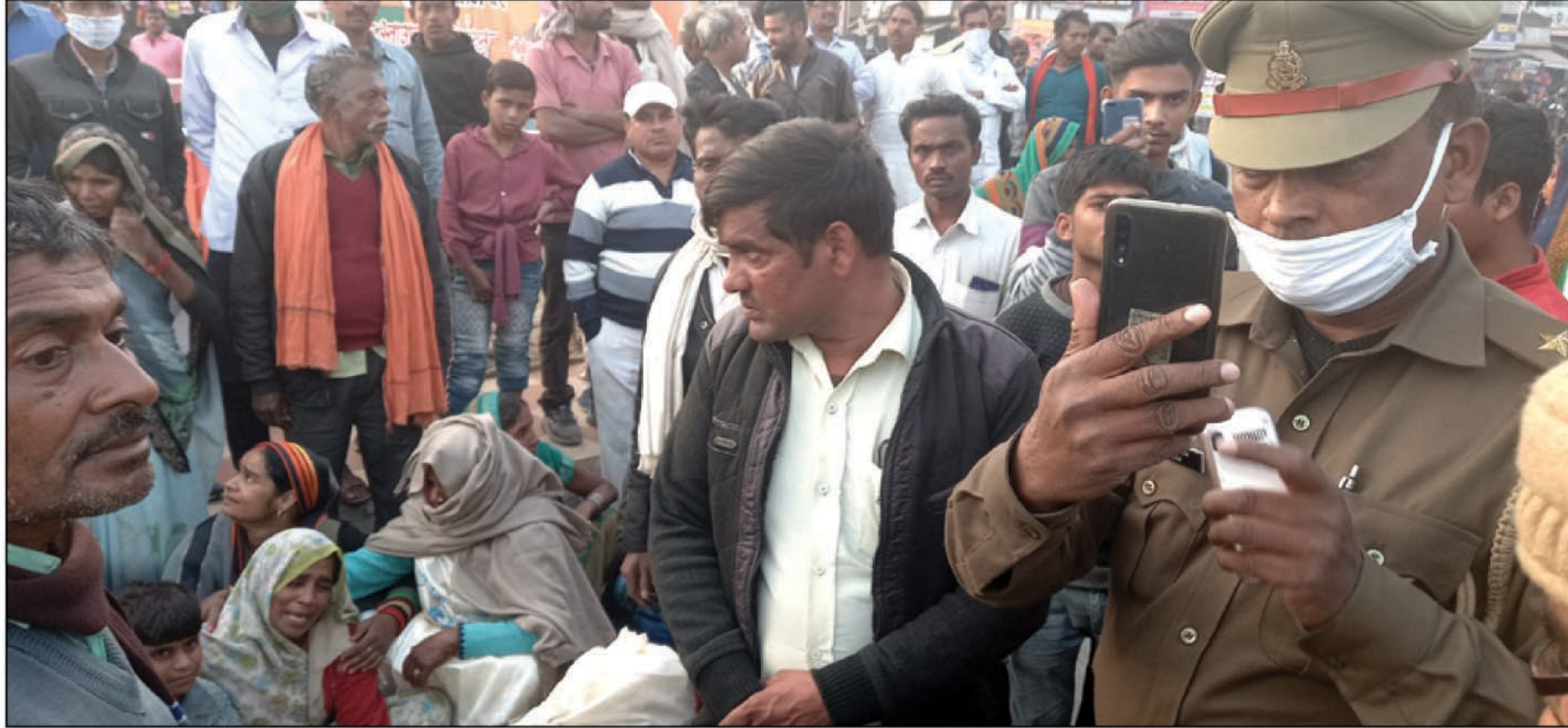
मांगों को लेकर चक्का जाम करते परिजन और समर्थक

कौशांबी। मंझनपुर मुख्यालय के एक निर्माणधीन मकान में मजदूरी कर रहे एक मजदूर की अचानक छत से गिरकर मौत हो गई मौत की जानकारी मिलने के बाद पुलिस ने लाश को पोस्टमार्टम के लिए भेज दिया और जब पोस्टमार्टम से लाश वापस परिजन लेकर आ रहे थे तो मंझनपुर मुख्यालय के मुख्य चौक पर परिजन और समर्थकों ने मृतक मजदूर के लाश को चौराहे पर रखकर सड़क जाम कर दिया है परिजनों का कहना था कि इस मामले की पुलिस जांच कर उन्हें न्याय दिलाएं पुलिस का कहना था कि पोस्टमार्टम कराए जाने के बाद सब तफ्तीश कराई जाएगी जो दोषी पाया जाएगा उसे दंडित किया जाएगा काफी देर तक मृतक मजदूर के समर्थक और परिजन धरना प्रदर्शन और तत्काल कार्यवाही कर न्याय की मांग पर अड़े रहे जिस पर मंझनपुर कोतवाली पुलिस ने सुरक्षा के दृष्टिगत चौराहे पर तमाम उप निरीक्षक कोतवाल और पुलिस के जवान बुला लिया पुलिस की बढ़ती भीड़ देख धरना प्रदर्शन कर रहे लोगों ने बातचीत करने के बाद धरना प्रदर्शन समाप्त कर दिया है। जानकारी के