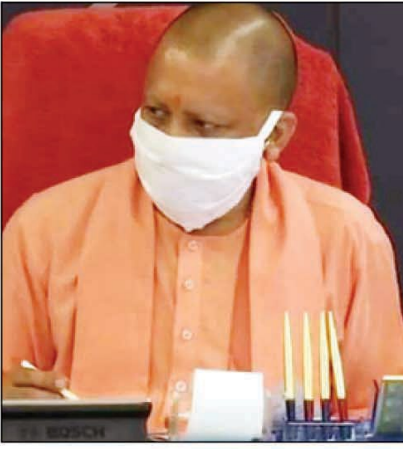
बलरामपुर, लखीमपुर खीरी और बाराबंकी जिलों के पोषण कार्यक्रम

लखनऊ, जेएनएन। पोषण के स्तर को बेहतर करने के लिए उत्तर प्रदेश के मुख्यमंत्री योगी आदित्यनाथ ने ऐसे कुपोषित परिवारों, जिनके पास गाय रखने का स्थान उपलब्ध होने के साथ वे गौ-पालन के इच्छुक हों, उन्हें निराश्रित गोवंश आश्रय स्थलों से गाय उपलब्ध कराने का जिलों के प्रशासन को निर्देश दिया है। गाय के धरण-पोषण के लिए प्रति गाय प्रतिमाह 900 रुपये भी देने के लिए कहा है। यह व्यवस्था 'माननीय मुख्यमंत्री निराश्रित/बेसहारा गोवंश