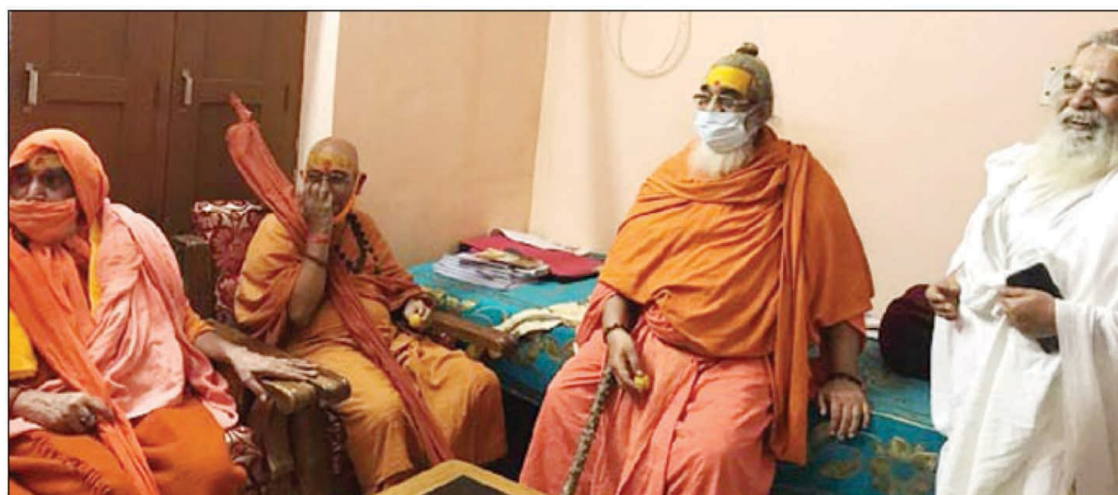
संतों के साथ अपने विचार रखते शंकराचार्य वासुदेवानंद सरस्वती

प्रयागराज। सनातन धर्म के प्रति घोर आस्था, भारत की निष्पक्ष निर्भीक न्यायिक प्रक्रिया और देश के अंदर सभी वर्ग व विचारधारा के लोगों की आपस में सद्भावना ने ही अयोध्या में भगवान राम के मंदिर निर्माण का मार्ग प्रशस्त किया। जो सनातन धर्म के प्रति आस्था का परिणाम है अयोध्या का राम मंदिर। उक्त विचार श्रीमद्ज्योतिष पीठाधीश्वर जगदुरु शंकराचार्य एवं श्रीराम जन्मभूमि तीर्थ क्षेत्र ट्रस्ट के संस्थापक सदस्य स्वामी वासुदेवानंद सरस्वती ने शुक्रवार को अयोध्या यात्रा से लौटकर अपने अलोपी वाग स्थित श्री ब्रह्म निवास में व्यक्त किया। उन्होंने कहा कि भगवान राम