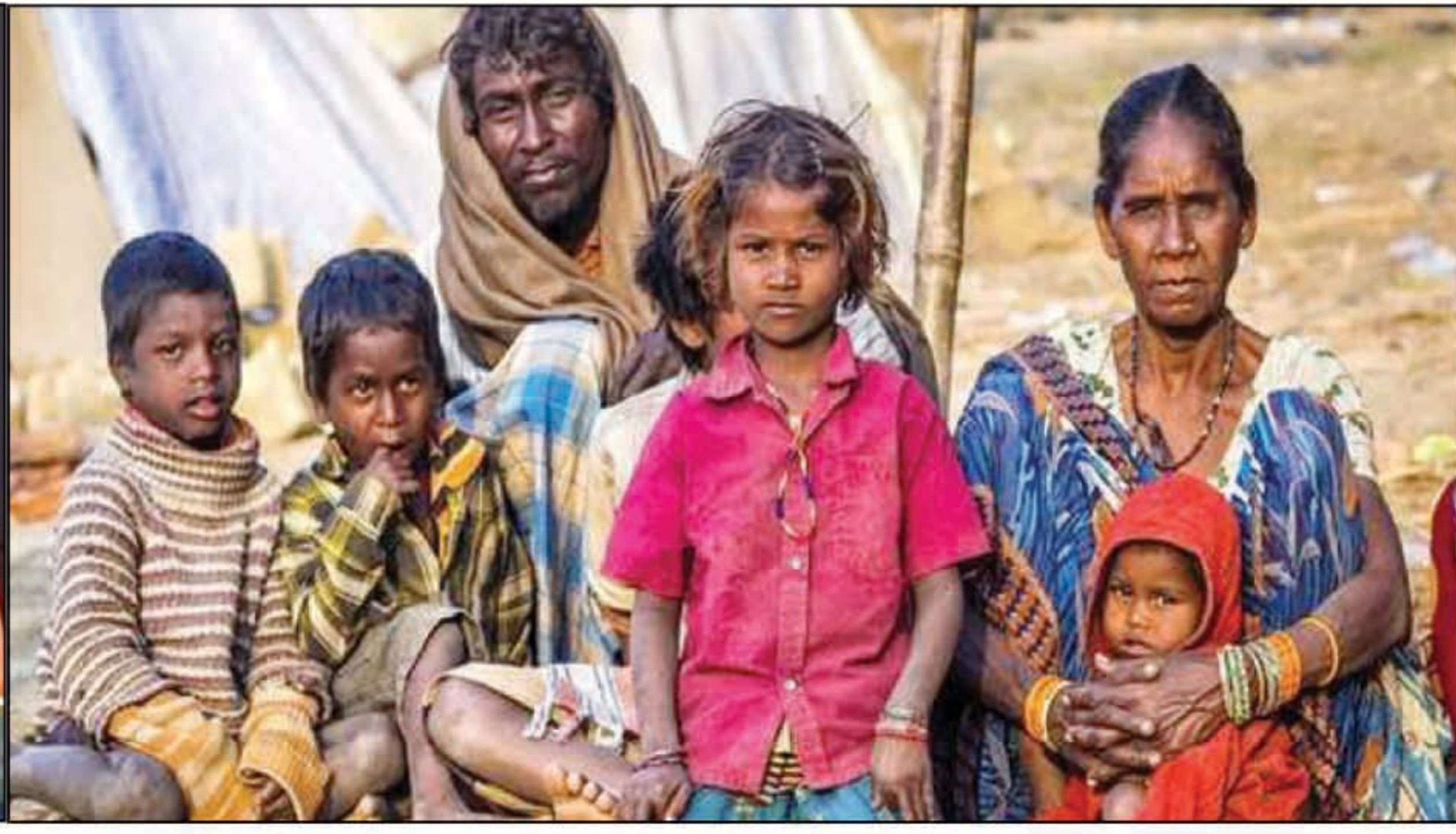
के लाभार्थियों और उनके अभिभावकों से बातचीत कर उनकी कुशलक्षेम पूछी। अभिभावकों से संवाद के दौरान मुख्यमंत्री ने उनके

बच्चों की उम्र, पैदाइश के समय और वर्तमान वजन, स्वास्थ्य, उन्हें दिये जा रहे पोषाहार, टीकाकरण आदि के बारे में जानकारी प्राप्त की। मुख्यमंत्री योगी आदित्यनाथ ने कुपोषित व अतिकुपोषित बच्चों को चिन्हित करके उन्हें समय से पोषण शुरू कराने का निर्देश दिया। बच्चों के साथ कुपोषित मां को भी चिन्हित कर योजनाओं का लाभ देने के लिए कहा। कुपोषित परिवारों के बेरोजगार लोगों को राज्य सरकार की ओर से संचालित योजनाओं के