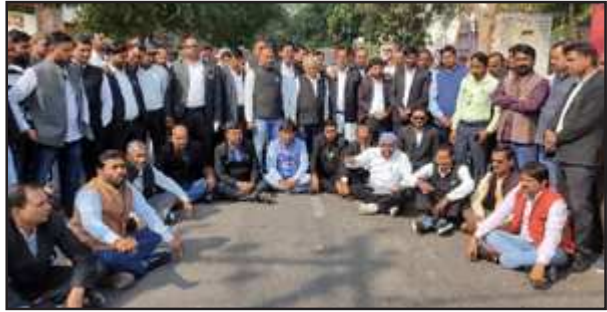
लालगंज में हाइवे पर विरोध प्रदर्शन करते वकील।

तहसील के दो अधिवक्ताओं पर गुरुवार की देर शाम हुए