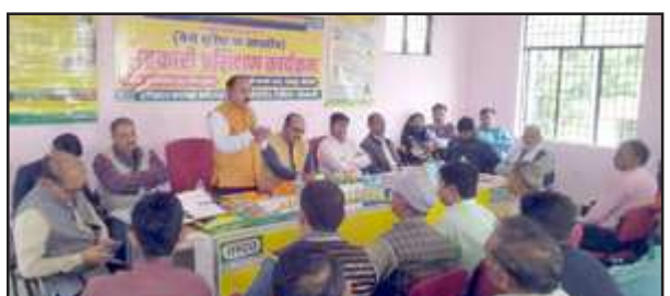
सहकारिता प्रशिक्षण में उपस्थित अधिकारी।

सहायक आयुक्त सहकारिता ने समितियों को समिति का कारोबार बढ़ाने पर बल दिया जिससे कारोबार बढ़े और अपने पैरो पर रहकर किसानों की सेवा करे। उर्वरक