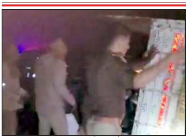
दुर्घटना के बाद मौके पर मौजूद पुलिस।

करारी थाना क्षेत्र में बीती रात हुआ जोरदार हादसा