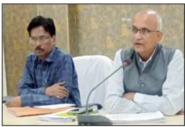
बैठक को संबोधित करते अपर जिलाधिकारी।

उन्होंने सम्बन्धित अधिकारियों को और अधिक प्रवर्तन कार्य करने के भी निर्देश दिये। उन्होंने आर0सी0 वसूली की प्रगति की समीक्षा के दौरान अपेक्षित प्रगति न पाये जाने पर नाराजगी प्रकट करते हुए तहसीलदारों को आर0सी0 की वसूली में प्रगति सुनिश्चित करने के