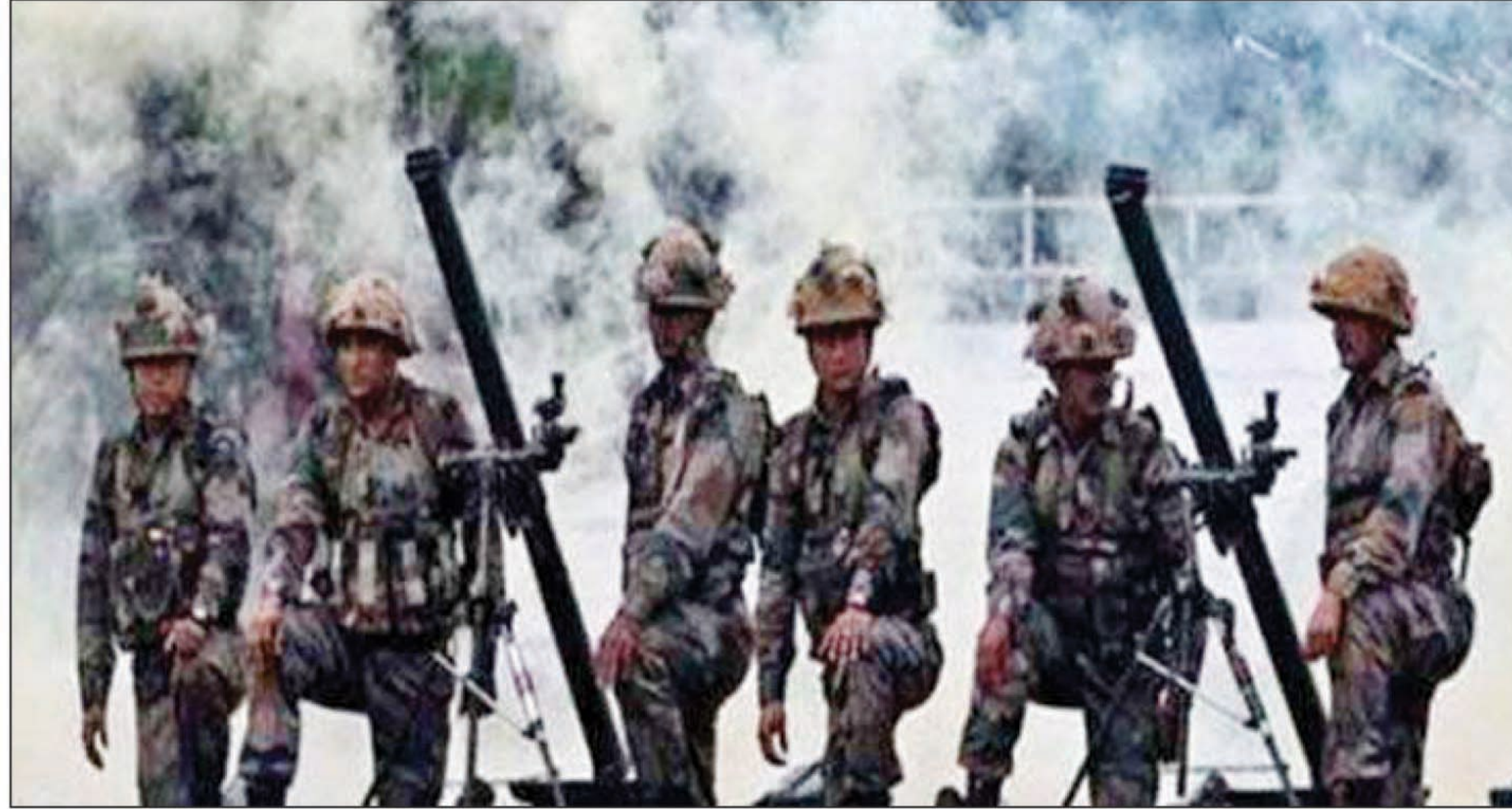
पाकिस्तानी सैनिकों ने पुंछ के बालाकोट सेक्टर में गोलाबारी की

के गोले दागे। भारतीय सेना को ओर से जवाबी कार्रवाई में पाक सेना की कई चौकियों को नुकसान पहुंचा है। गोलाबारी की चपेट में कई रिहायशी इलाके आए, लेकिन कोई नुकसान नहीं हुआ है। दोनों तरफ से देर शाम तक लगातार गोलाबारी जारी थी। इससे पूर्व शनिवार को भी