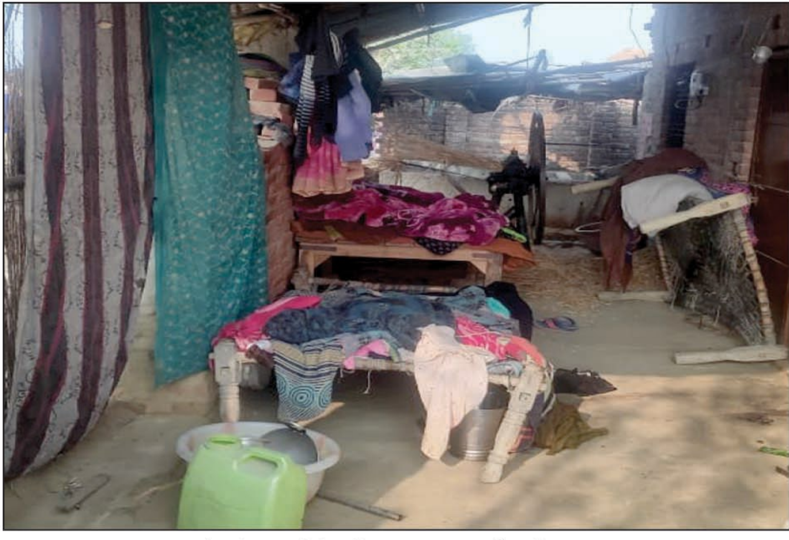
सो रहे मां-बेटे को उतारा गया मौत के घाट

कई को हिरासत में लेकर हो रही पूछताछ, जल्द घटना के खुलासा का दावा