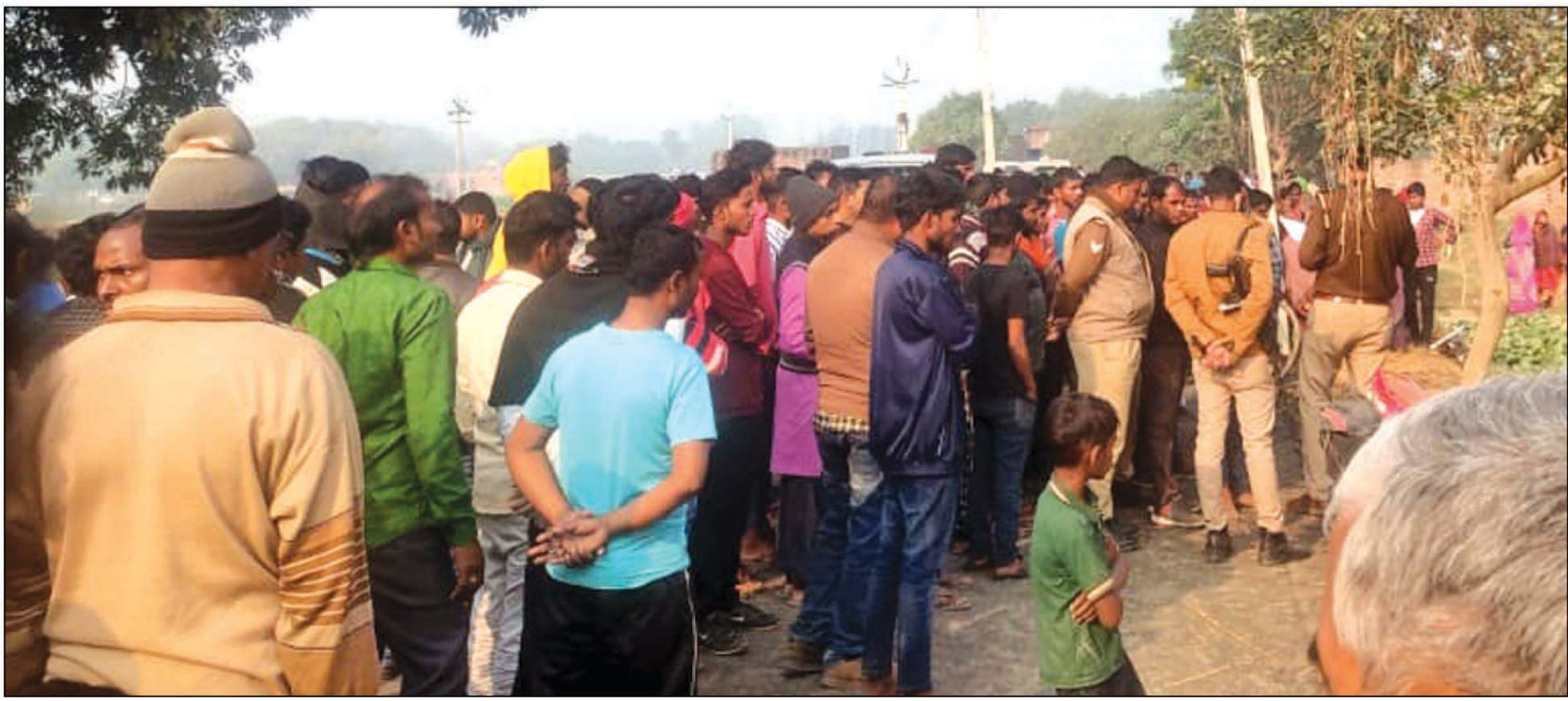
सूचना मिलने के बाद मौके पर पहुंची व जुटी ग्रामीणों की भीड़

के सोरांव थाना क्षेत्र में शनिवार देर रात मां-बेटे की धरदार हथियार से हत्या कर दी गई। रिविवार सुबह परिजन ने खून से लथपथ दोनों का शव बिस्तर पर पड़ा देखा। वारदात की जानकारी के बाद पुलिस मौके पर पहुंची। फॉरेंसिक टीम व डॉग स्क्वाड की टीम को भी बुलाया गया है। शुरूआती जांच में जमीन विवाद को हत्या का कारण बताया जा रहा है। पुलिस मामले की जांच