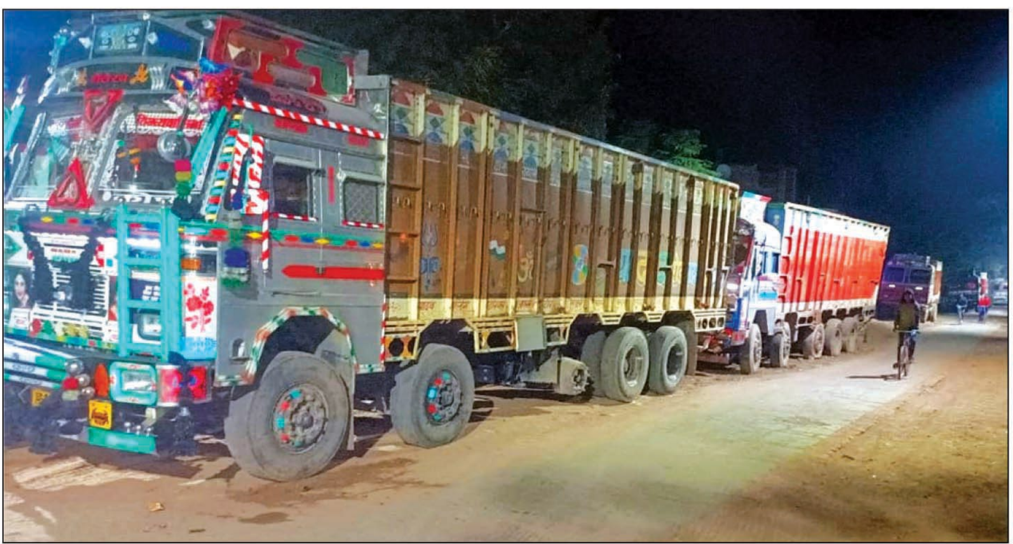
वाहन चेकिंग के दौरान खड़े वाहन

शंकरगढ़। ओवरलोडिंग और ट्रैफिक रूल्स का पालन न करने वाले वाहन चालकों के खिलाफ चलाए जा रहे अभियान के क्रम में रविवार को आधा दर्जन ट्रकों को सीज किया गया, जबकि तीन वाहन चालकों का आनलाइन चालान किया गया। इस अभियान के दौरान पुलिस विभाग ने दर्जनों लोगों को हिदायत देकर भी छोड़ा, साथ ही सभी से सड़क पर ट्रैफिक रूल्स का पालन करने की अपील भी की।