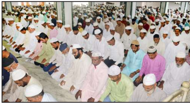
जामा मस्जिद में जुमे की नमाज अदा करते नमाजी।

यू तो हर मुसलमान अमूमन जुमे की नमाज अता करने में