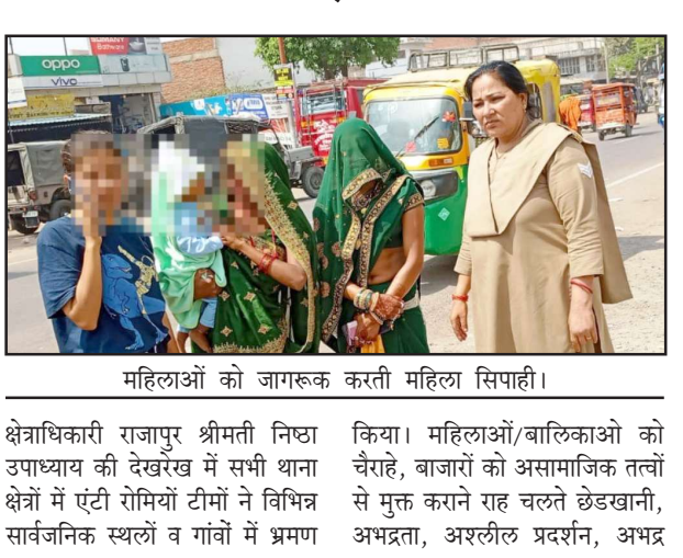
महिलाओं को जागरूक करती महिला सिपाही।