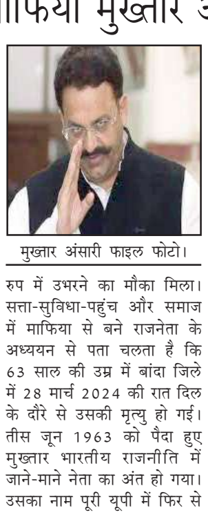
मुख्तार अंसारी फाइल फोटो।

अखंड भारत संदेश चित्रकूट। जहां से गुजरो धुआ बिछाओ, जहां भी पहुंचो धमाल कर दो- तुम्हें सियासत ने हक दिया है, हरी जमीनों को लाल कर दो- कोई एक दिन में माफिया मुख्तार अंसारी नहीं बनता। इसके लिए सदियों गुजर जाती हैं। सत्ता और ताकत जिसके साथ रहेगी, वह माफिया में शुमार होता रहेगा। शुक्रवार को माफिया डान मुख्तार अंसारी का शव जिस अंदाज से वाहनों के काफिले में चित्रकूट से गुजरा, उससे प्रतीत हुआ कि मरने के बाद भी उसका जलवा कायम रहा। साठ से अधिक आपराधिक मामले दर्ज होने के बाद वह आगे बढ़ने और खुद को बचाने में शामिल रहा। बार-बार मामलों की सुनवाई होती रही, हर बार उसे नेता के