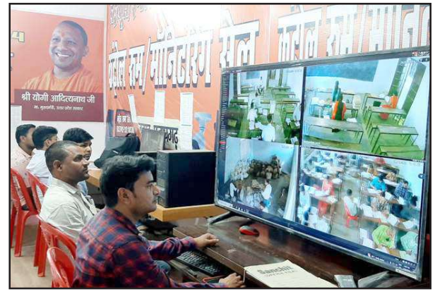
डीआईओएस कार्यालय से मूल्यांकन केन्द्रों की निगरानी करते कर्मचारी

इसमें राजकीय इंटर कालेज में 166081 उत्तर पुस्तिकाएं, केपी हिन्दू इंटर कालेज में 168494 उत्तर पुस्तिकाएं, राजकीय बालिका इंटर कालेज में 64167 उत्तर पुस्तिकाएं, तिलक इंटर कालेज में 104340 उत्तर पुस्तिकाएं, पीबी इंटर कालेज में 78391 उत्तर पुस्तिकाओं का मूल्यांकन किया गया। इस प्रकार जिले में कुल 581473 उत्तर पुस्तिकाओं का मूल्यांकन का कार्य सुचारु रूप से