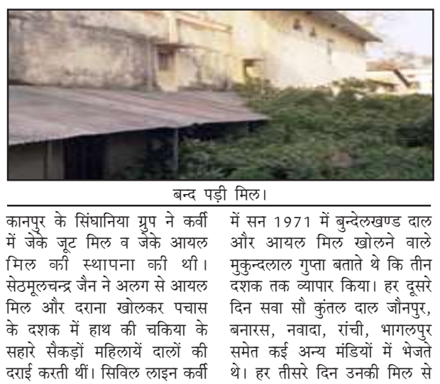
बन्द पड़ी मिल।

अखंड भारत संदेश चित्रकूट। दाल, लाही और कपास के हब रहे चित्रकूट में पांच बड़ी मिलें रही हैं। दशकों तक ये मिलें संचालित होती रहीं। पैदावार घटी तो एक के बाद एक जिले से ये पांचों बड़े उद्योग ठप हो गये। आजादी के बाद आई किसी भी सरकार ने बुन्देलखण्ड में औद्योगिक विकास की पहल नहीं की। बहुत कम लोग जानते हैं कि बुन्देलखण्ड के पिछड़े क्षेत्र चित्रकूट में कभी पांच मिलें थीं। यहां बड़े पैमाने पर किसान कपास की खेती करते थे। यहां की बड़े दाने वाली बलौधा अरहर के साथ अलसी व लाही उत्पादन में क्षेत्र अबल था।