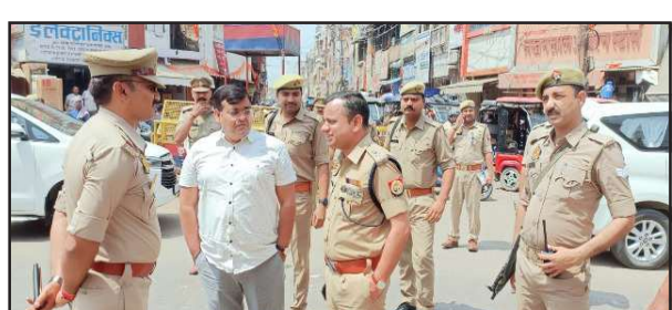
घंटाघर पर कानून-व्यवस्था का जायजा लेते डीएम-एसपी।