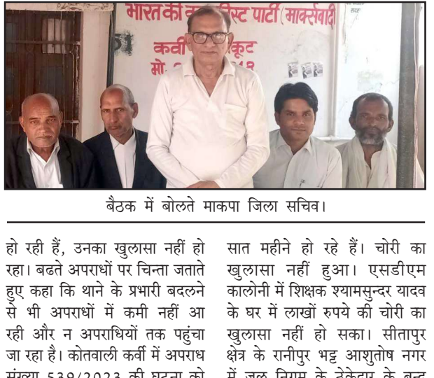
बैठक में बोलते माकपा जिला सचिव।