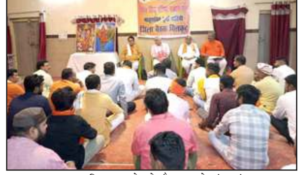
मतदान प्रतिशत बढ़ाने की बैठक करते संत-महंत।