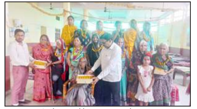
माताओं को उपहार देते एलायंस क्लब के पदाधिकारी।