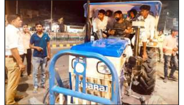
ट्रेक्टर में यात्रा से रोकते टीएसआई।

शनिवार देर रात प्रभारी यातायात ने वाहन चालकों को यातायात नियमों के प्रति जागरूक कर कहा कि सड़क पर यात्रा करते समय दोपहिया पर हेलमेट, चारपहिया पर सीट बेल्ट का प्रयोग करें। पुलिस सुरक्षा को तैनात है। ट्रेक्टर-ट्राली व माल