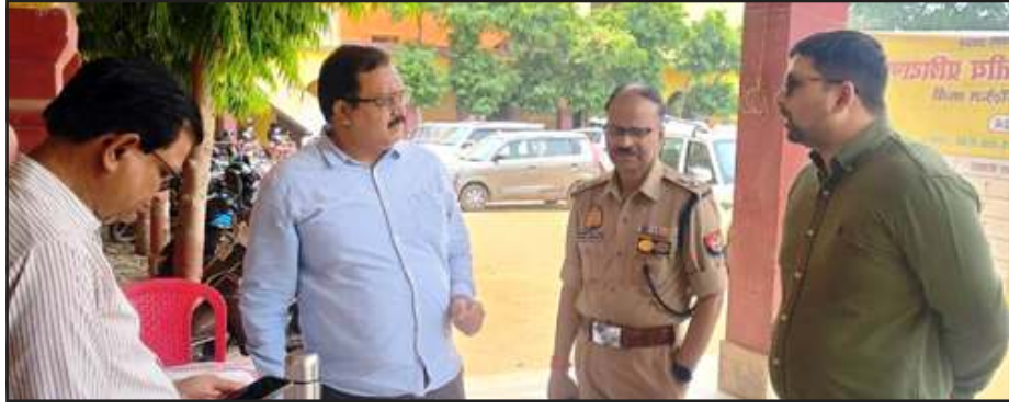
द्वितीय प्रशिक्षण का निरीक्षण करते डीएम-एसपी।

रविवार को डीएम-एसपी ने विभिन्न प्रशिक्षण कक्षाओं में जाकर निरीक्षण किया। प्रशिक्षण कक्ष में मतदान बाबत मास्टर ट्रेनर के दिए जा रहे प्रशिक्षण को बारीकी से समझा। जिला निर्वाचन अधिकारी ने निरीक्षण करते हुए मास्टर ट्रेनरों से कहा कि अच्छे से मतदान कर्मियों को प्रशिक्षण दे, ताकि मतदान के दिन कोई समस्या न आवे। मतदान