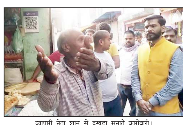
व्यापारी नेता शानू से दुखड़ा सुनाते कारोबारी।

में हुई बैठक में खोही के व्यापारियों ने प्रशासन के दुर्व्यवहार पर रोष जताया। वैशाखी अमावस्या पर्व पर हर अमावस्या की भांति व्यापारियों ने 20 कुंतल मिठाई तैयार कर दुकानों में सजायी थी। प्रशासन ने मिठाई वाली दुकानों की जलेबी वाली गली को बंदकर दिया था। ज्यादा मेला भी नहीं था। कामदगिरि परिक्रमा मार्ग खोही बाजार की मिठाई दुकानों की धूम दूर-दूर तक है। श्रद्धालु यहां से मिठाई ले जाते हैं। भोग-प्रसाद आदि को यहां की मिठाइयों देश के कोने-कोने में जाती है। वैशाखी अमावस्या में पुलिस प्रशासन ने व्यापारियों के साथ जिस ढंग से दुर्व्यवहार किया, उससे दुकानदारों को भारी क्षति उठानी