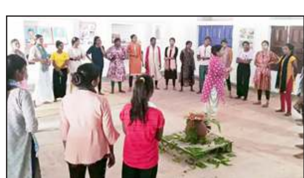
प्रशिक्षण में मौजूद बालिकायें।