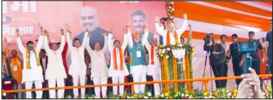
हीरागंज की सभा में जनता का अभिवादन स्वीकारते गृह मंत्री अमित शाह।