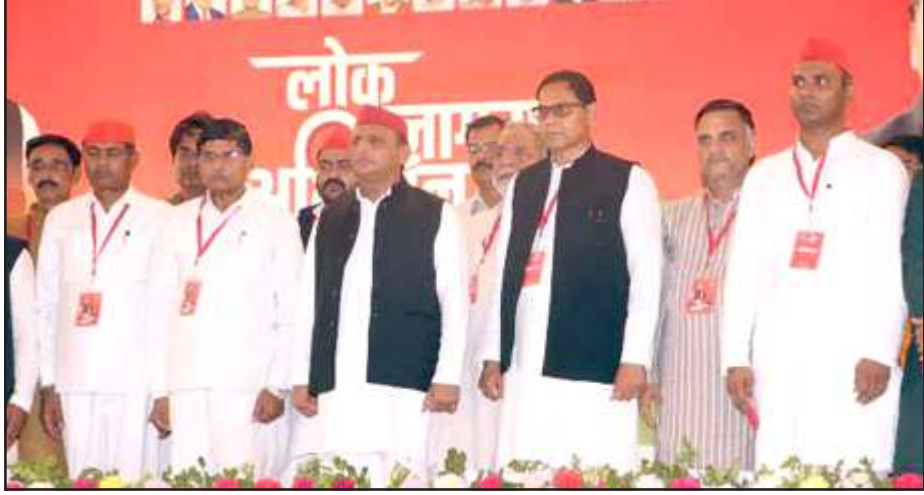
प्रशिक्षण कार्यक्रम में मौजूद पूर्व मुख्यमंत्री अखिलेश यादव।

अधिकारियों ने की होती तो न जाती छह लोगों की जान