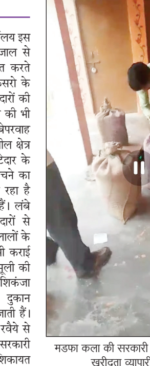
मड़फा कला की सरकारी दुकान पर खाद्यान्न खरीदता व्यापारी का दृश्य

कोरांव। आपूर्ति विभाग कोरांव का कार्यालय इस समय पूरी तरह से भ्रष्टाचार के मकड़जाल से जकड़ा हुआ है। कार्ड धारक शिकायत करते थक हार रहे हैं। लेकिन जिम्मेदार अफसरों के कान पर जूँ तक नहीं रेंग रही हैं। कोटेदारों की घटौली एवं सरकारी खाद्यान्न बेंच लेने की भी शिकायतें की जाती हैं लेकिन जिम्मेदार बेपरवाह बने रहते हैं। ताजा मामला कोरांव तहसील क्षेत्र के मड़फा कला गांव का है। जहां कोटेदार के द्वारा सरकारी राशन व्यापारी के हाथ बेचने का विडियो सोशल मीडिया पर वायरल हो रहा है जिम्मेदार अधिकारी उदासीन बने हुए हैं। लंबे समय से जमे आपूर्ति निरीक्षक कोटेदारों से अच्छी पैठ बना रखे हैं। प्रत्येक महिने दलालों के माध्यम से कोटेदारों से अवैध वसूली भी कराई जाती है। अगर कोई कोटेदार अवैध वसूली की शिकायत करता है तो उस पर विभागीय शिकंजा नस दिया जाता है। इतना ही नहीं दुकान निलंबित कर देने की भी धमकियाँ दी जाती हैं। ऐसे में मनमाने विभागीय अधिकारी के रवैये से कोटेदारों में भी शोर मचा रहा है। सरकारी खाद्यान्न बेचने की एसडीएम से हुई शिकायत