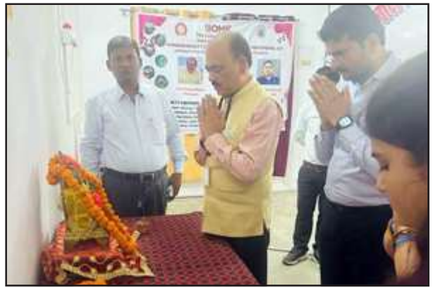
मां सरस्वती के प्रतिमा पर माल्यार्पण करते प्राचार्य।