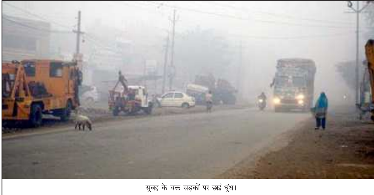
सुबह के वक्त सड़कों पर छाई धुंध।

इस भीषण ठंड को देखते हुए उत्तर प्रदेश शासन ने कक्षा-एक से आठ तक स्कूलों में 15 दिनों का 14 जनवरी तक के लिये शीतावकाश घोषित कर दिया है। शासन के निर्देश के बावजूद आज कुछ स्कूलों के बच्चे बैग लेकर स्कूल जाते देखे गये। इन दिनों ठंड का मिजाज अपनी चरम पर है। घरों में लोग रजाई में दुबके रहते हैं। रजाई से निकलते ही हाथ पैर ठंड हो जाता है तो हीट व ब्लोवर का सहारा लेते हैं। सड़कों पर भीड़ कम हो गई है। शाम होते ही लोग घरों में कैद हो जा रहे हैं। मौसम विभाग की मानें तो वर्षा के बाद पश्चिमी