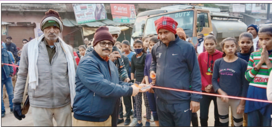
मैराथन का फीता काटकर उदघाटन करते मुख्य अतिथि