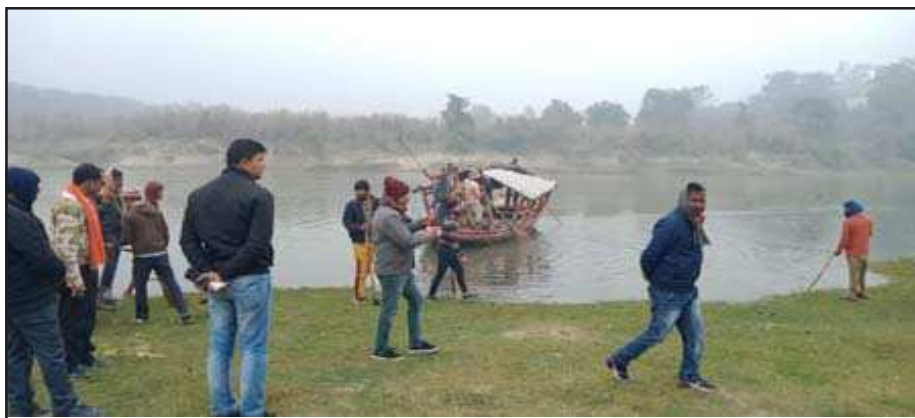
नाव से नदी के अंदर जाकर गंदगी को साफ करते सफाई कर्मचारी।