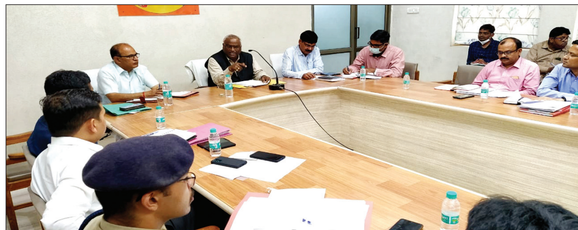
बैठक करते राज्य सूचना आयोग

प्रयागराज। राज्य सूचना आयोग श्री नरेन्द्र कुमार श्रीवास्तव की अध्यक्षता में मंगलवार को सर्किट हाउस में विभागों के जन सूचना अधिकारियों/प्रथम अपीलीय अधिकारियों के साथ बैठक आयोजित की गयी। बैठक में मा0 राज्य सूचना आयोग ने सभी जन सूचना अधिकारियों को जन सूचना अधिकार अधिनियम के तहत मांगी जाने वाली सूचनाओं को निर्धारित समयसीमा (30 दिन) के अंदर आवेदनकर्ता को अनिवार्य रूप से उपलब्ध कराये जाने के लिए कहा है। उन्होंने कहा कि निर्धारित समयसीमा के अन्तर्गत आवेदनकर्ता को मांगी गयी सूचना उपलब्ध करा दी जाने से आवेदनकर्ता को जहां एक ओर समय से सूचना उपलब्ध हो जाती है, वहीं दूसरी तरफ राज्य सूचना आयोग में होने वाली पेंडेंसी में भी कमी आती है। उन्होंने सभी जन सूचना अधिकारियों को प्रारूप-3 के तहत रजिस्टर बनाकर उसको नियमित रूप से अद्यतन बनाये रखने के लिए भी