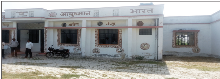
वीरान पड़ा बैश कांटी सरकारी अस्पताल का दृश्य