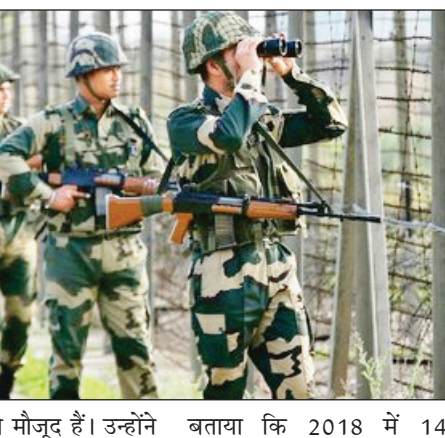
संदिग्ध आतंकी मौजूद हैं। उन्होंने बताया कि 2018 में 143,

नई दिल्ली: जम्मू कश्मीर में 2018 के बाद घुसपैठ की घटनाओं में उल्लेखनीय कमी दर्ज की गई है। 2018 में 143 घुसपैठ की घटनाएं दर्ज की गई थीं और यह वर्ष 2021 में घटकर 34 रह गई है। केंद्रीय गृह राज्य मंत्री नित्यानंद राय ने मंगलवार को लोकसभा में एक प्रश्न के लिखित उत्तर में बताया कि घुसपैठ की घटनाओं में कमी के बावजूद ऐसी सूचनाएं हैं कि पाकिस्तान और पाक अधिकृत कश्मीर में विभिन्न लांच पैड पर काफी संख्या में