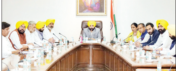
उसे मंजूर करके लागू कर सकें। मान ने कहा कि अब पंजाब में न कोई कच्चा घर रहेगा और न कोई कच्चा मुलाजिम। इससे पहले भी पंजाब मंत्रिमंडल की पहली बैठक में भगवंत मान सरकार ने एक

चंडीगढ़: पंजाब की भगवंत मान सरकार ने बड़ा एलान किया है। मान ने कहा कि हमारी सरकार ने गुप सी और डी के 35 हजार अस्थायी कर्मचारियों को स्थायी करने का फैसला किया है। उन्होंने मुख्य सचिव को ऐसी सविदात्मक और आउटसोर्सिंग भर्तियों को समाप्त करने का भी निर्देश दिया है। मान ने कहा कि मैंने मुख्य सचिव को निर्देश दिया है कि अगले विधानसभा के सत्र से पहले इस कानून का मसौदा बनाकर उन्हें भेजा जाए ताकि हम विधानसभा में