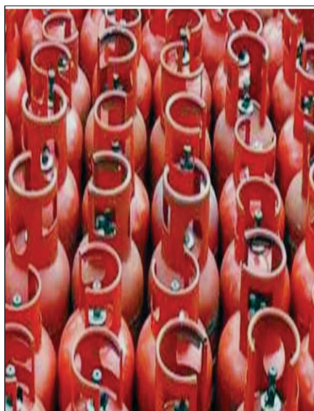
मंगलवार सुबह रसोई गैस के डीलरों के पास जब सिलेंडर की कीमतों में बढ़ोतरी का मैसेज आया तो वह भी दंग रह गए। इसके बाद आनन-फानन हाकरों और एजेंसी के कर्मचारियों को जानकारी दी गई।

प्रयागराज। पेट्रोलियम कंपनियों ने रसोई गैस सिलेंडर की कीमतों में इजाफा कर दिया है। मंगलवार सुबह से सिलेंडर की कीमत 50 रुपये बढ़ा दी गई है। प्रयागराज में 14.2 किलोग्राम के नान सिल्विडी रसोई गैस सिलेंडर का 962 से बढ़कर 1012 हो गया है। इसका असर लोगों की जेब पर पड़ने वाला है। तकरीबन चार महीने बाद रसोई गैस सिलेंडर की कीमतों में इजाफा किया गया है।