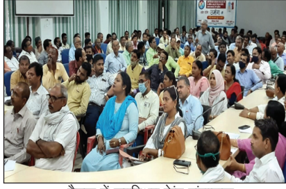
बैठक में उपस्थित केन्द्र संचालक