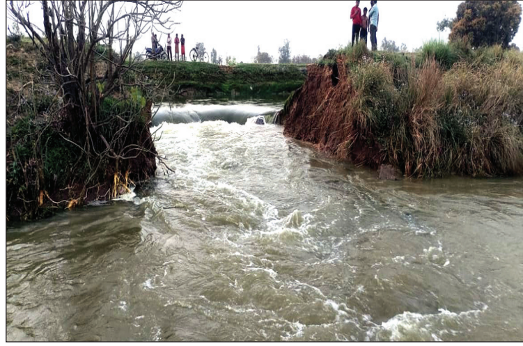
नहर कट जाने जल मग्न फसल

के बजाए एक दूसरे पर दोषारोपण करने वाले जनप्रतिनिधियों ने भी किसानों से पर लगे हैं विधानसभा चुनाव व्यतीत हो किनारा कर लिया है जिससे किसानों के जाने के बाद किसानों के हिमायती बनने सामने मुसीबत बढ़ती जा रही है।