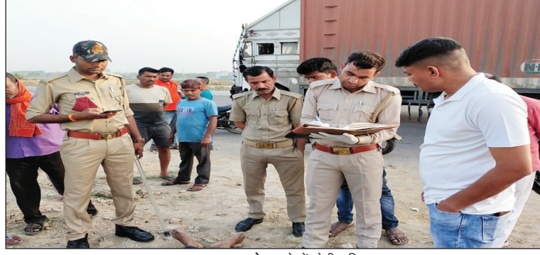
अज्ञात लाश को कब्जे में लेती पुलिस

अडुवा कौशाम्बी। सैनी कोतवाली क्षेत्र के नगर पंचायत अडुवा के समीप ससुर खदेरी नदी पुल के पास राष्ट्रीय राजमार्ग के किनारे एक अज्ञात युवक का रक्त रंजित शव मिला है। ससुर खदेरी नदी पुल के पास शव पड़ा होने की सूचना से क्षेत्र में सनसनी मच गयी युवक की उम्र तकराबन 25 वर्ष रही होगी युवक के हाथ और सोने सहित शरीर मे तमाम चोट के निशान भी दिख रहे थे शरीर मे चदर भी लिपटा था मृतक का शव जहां पड़ा था वहां ज्यादा खून भी नहीं बिखरा था हत्यारे कही दूसरी जगह हत्या कर सुनसान स्थान देखकर शव फेंक कर फरार हुए थे ऐसा प्रतीत हो रहा है पुलिस का कहना है कि रास्ता बनने होने के कारण यह सस्प्ट नहीं हो रहा कि हत्यारे शव टिकाने लगाने प्रयागराज की तरफ से आये थे कि कानपुर की तरफ से आए थे सूचना पर अडुवा चौकी पुलिस मौके पर पहुंचकर बारीकी से जांचकर शिनाख्त करवाने का तमाम प्रयास किया किंतु खबर लिखे जाने तक मृतक की शिनाख्त नहीं हो सकी है पुलिस ने शव को कब्जे में लेकर पोस्टमार्टम को भेज दिया है वहीं चचाओं पर जाएं तो शव किसी ट्रक के खलासी -इड्रवर का भी हो सकता है।