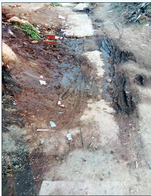
कैशान गाँव में ब्यास गन्चरी

ग्रामीणों का कहना है कि दरहा गाँव में यादव समाज का सफाई कर्मी नियुक्त है और दलित बस्ती में बनी नाली को वह नहीं साफ करना चाहता पहले बीमारी का बहाना फिर चुनाव ड्यूटी लगी बता कर सफाई व्यवस्था से किनारा कर चुका है बीते एक वर्ष से सफाई कर्मी दलित बस्ती से गायब रहता है जिससे दलित बस्ती में गंदगी का अंबार लगा हुआ है