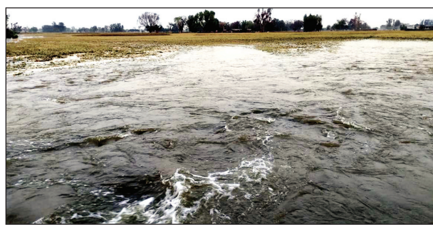
नहर कटने से किसानों के नुकसान की समर्थ पार्टी ने की मांग