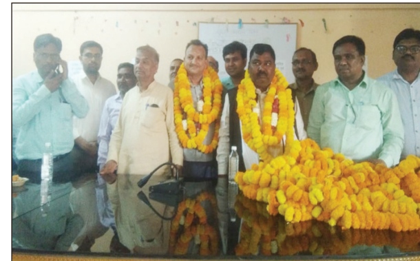
लेखपाल की विदाई के अवसर पर मौजूद साथी