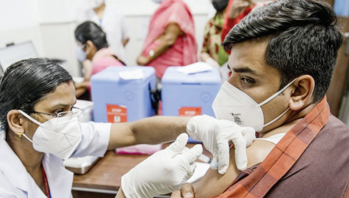
लिए लोगों को संक्रमण का खतरा ज्यादा रहता है। महाराष्ट्र सरकार ने कहा है कि राज्य सरकार ने दुकानों, मॉल इत्यादि सार्वजनिक स्थानों में प्रवेश से पहले वैक्सीन लेना अनिवार्य