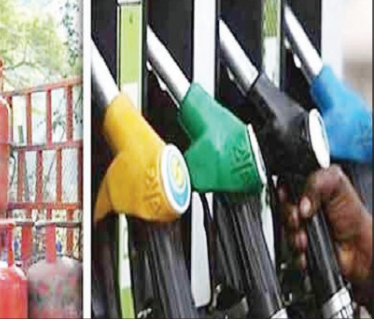
और चेन्नई में पेट्रोल 102.16 और डीजल 92.19 रुपए प्रति लीटर हो गया है। दिल्ली में 5 किलो वाला एलपीजी सिलेंडर 349 रुपए, 10

नई दिल्ली: पांच राज्यों के चुनावों के कारण 137 दिनों से स्थिर रहे पेट्रोल-डीजल के दाम मंगलवार को 80 पैसे प्रति लीटर बढ़ गए हैं। इतना ही नहीं, घरेलू गैस सिलेंडर की कीमत में भी 50 रुपए का इजाफा हुआ है। दिल्ली में अब 14.2 किलो का बिना सिलेंडर वाला सिलेंडर 949.50 रुपए में मिलेगा। वहीं, पेट्रोल की कीमत 96.21 रुपए प्रति लीटर और डीजल 87.47 प्रति लीटर हो गई है। मुंबई में पेट्रोल 110.82, डीजल 95.00, कोलकाता में पेट्रोल 105.51, डीजल 90.62