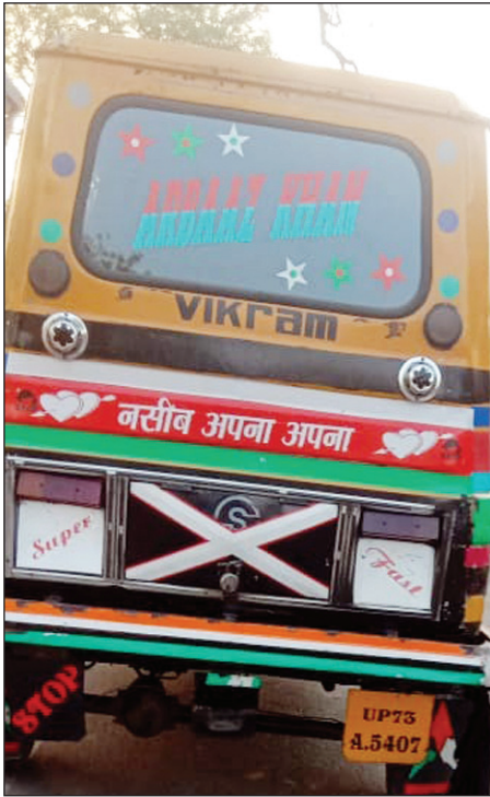
सड़क पर फरार्ट भरता अवैध डगगामार विक्रम

कौशाम्बी। जिले की सड़कों पर बेखौफ तरीके से अवैध टेंपो विक्रम दौड़ रही है अवैध विक्रम टेंपो सड़क दुर्घटना का प्रमुख कारण बन चुके हैं स्थानीय थाना पुलिस यातायात पुलिस और एआरटीओ कार्यालय द्वारा कार्रवाई के नाम पर खानापूर्ति हो रही है बीच सड़क पर वाहन खड़ा करके सवारी भरना और बीच सड़क पर सवारी उतारना इन अवैध वाहन चालकों का कारनामा बन चुका है जिससे आए दिन हादसे होते हैं इस गंभीर समस्या पर आला अधिकारी भी गंभीर नहीं है मंझनपुर करारी रोड पर मंझनपुर से नारा रोड पर मंझनपुर से हिनाता रोड पर मंझनपुर से भरवारी रोड पर इसी तरह तिल्लापुर मोड़ से चलने वाले वाहन मनोरी बाजार से चलने वाले वाहन चरवा बेरूवा से चलने वाले विक्रम टेंपो मूरतगंज चौराहा से चलने वाले विक्रम टेंपो चालकों के अनियंत्रित तरीके से वाहनों के चलाने से दुर्घटनाएँ तेजी से बढ़ी हैं बिना लाइसेंस के चालकों के हाथ में वाहन स्वामियों ने वाहन की स्टैयरिंग सॉप दिया है और पुलिस से लेकर एआरटीओ कार्यालय अनदेखी कर रहा है सूत्रों की माने तो जिम्मेदार द्वारा अधीनस्थों के जरिए महीने वारी वसूल करवा रहे हैं जिससे सब कुछ गलत होने के बाद उन्हें संरक्षण दिया जा रहा है आखिर अवैध वसूली के दम पर कब तक डगगामार वाहन सड़कों पर दौड़ते रहेंगे जो दुर्घटना को बढ़ावा देते हैं।