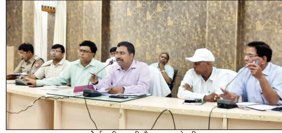
बोर्ड परीक्षा की बैठक करते डीएम

कौशाम्बी। जिले के विभिन्न थाना क्षेत्रों में आए दिन रेलवे लाइन के किनारे सड़क के किनारे झाड़ी तालाब में लावारिस लाश मिलती है स्थानीय थाना पुलिस लावारिस लाश को पोस्टमार्टम भेजकर अपनी जिम्मेदारी से मुक्त हो जाती है पूर्व में भी तमाम अज्ञात लाश को खराज सैनी पुरामुक्ती सराय अकेल चरवा आदि थाना क्षेत्रों में मिल चुकी है लेकिन तमाम अज्ञात लाश का खुलासा वर्षों बाद भी थाना पुलिस नहीं कर सकी है आखिर अज्ञात लाश कौशाम्बी सीमा क्षेत्र में लाकर फेंकने वाले कौन हैं और चप्पे-चप्पे पर पुलिस के जवानों की ड्यूटी लगने के बाद अज्ञात लाश सड़क किनारे रेलवे स्टेशन पर फेंक कर अपराधी कैसे गायब हो जाते हैं यह पुलिसिया व्यवस्था पर बड़ा सवाल है कहीं थाना पुलिस का अज्ञात लाशों के हत्यारों से गहरी सांगठन तो नहीं है यह बड़ी जांच का विषय है।