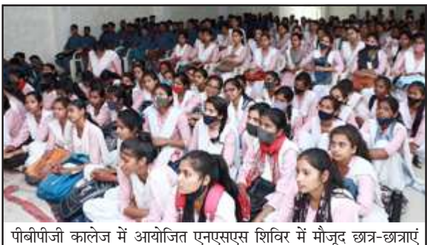
पीबीपीजी कालेज में आयोजित एनएसएस शिविर में मौजूद छात्र-छात्राएं