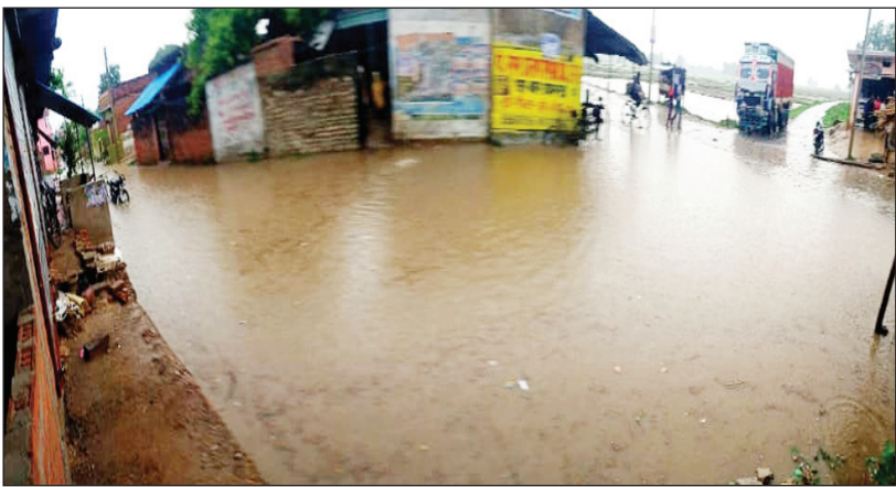
जसरा के तातारगंज चौराहे पर लबालब भरा बरसात का पानी