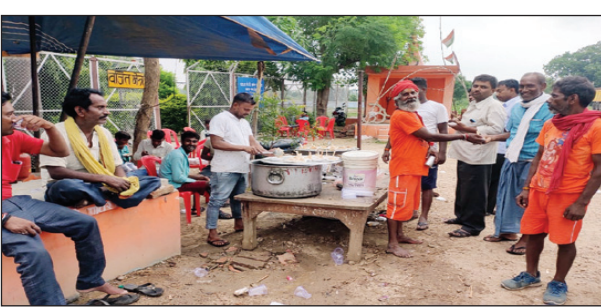
कांवरियों के जलपान के लिए लगे शिबिर में उपस्थित लोग