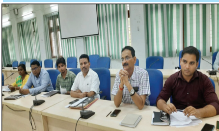
संचारी रोग की बैठक में उपस्थित अधिकारी

जिला पंचायत राज अधिकारी एवं सभी डूँओ को अभियान चलाकर नालियों की साफ-सफाई, देवा का छिड़काव एवं फॉगिंग कराने के निर्देश