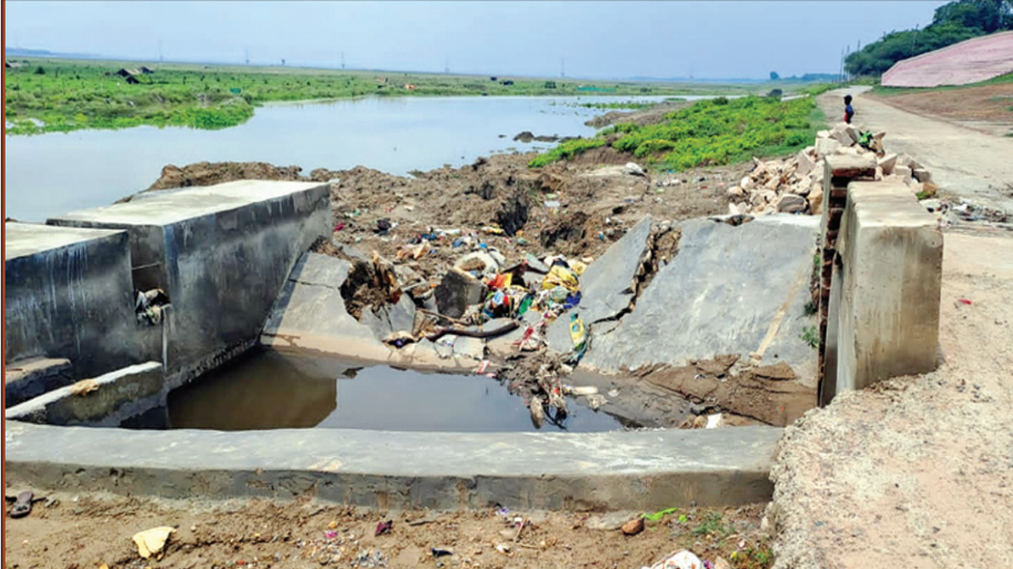
एसटीपी से नाले को जोड़ने के लिए बना चैम्बर बारिस में बहा

झूंसी। गंगा किनारे करोड़ों के बजट से हो रहा एसटीपी निर्माण कार्य अनिमित्यता की भेंट चढ़ गया। गंगोली शिवाला के पास एसटीपी का चैम्बर कुछ घंटों की बारिस में ध्वस्त हो गया। एसटीपी का निर्माण नमामि गंगे योजना के तहत चल रहा है। इनके जरिये झूंसी के गंदे नाले का पानी शोधित कर गंगा में गिराया जायेगा। प्रयागराज में गंगा में गिर रहे गंदे नाले को शोधित करने के लिए जिले भर में करीब नौ सौ करोण की लागत से एसटीपी निर्माण कार्य कराया जा रहा है। जिसे 2024 में लगाने वाले माह कुम्भ से पहले कंप्लेंट हो जाना है लेकिन झूंसी में चल रहा एसटीपी निर्माण कार्य पूरा होने से पहले ही अनिमित्यता की भेंट चढ़ गया है। बताते की झूंसी से कुल 13 नाले हैं जिसे सीवर ट्रीटमेंट प्लांस से जोड़ने के लिए गंगा किनारे चैम्बर व पाइप