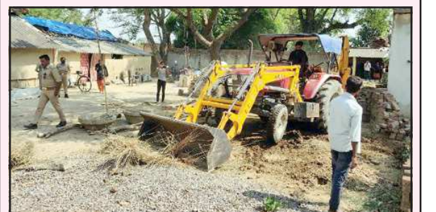
रास्ते पर अवैध अतिक्रमण हटाती जेसीबी।