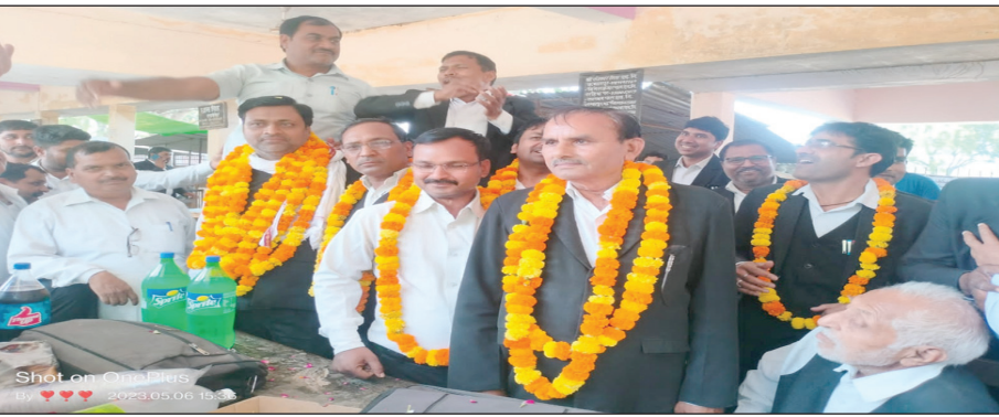
तहसील बार एसोसिएशन के अधिवक्ता