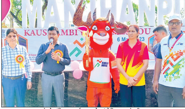
खेलों इंडिया कार्यक्रम को संबोधित करते डीएम

बढ़ावा देने का कार्य किया जा रहा है, जिसके परिणामस्वरूप प्रत्येक स्तर पर यथा-विद्यालय, विश्वविद्यालय, जनपद स्तर एवं मण्डल स्तर आदि स्तरों पर खेल प्रतियोगिताओं का आयोजन किया जा रहा है उन्होंने कहा कि खेल से स्वास्थ्य भी ठीक रहता है तथा बहुत से युवा खेल में अपना कैरियर बनाते हैं। उन्होंने बच्चों से कहा कि खेल के मैदान में जरूर जायें