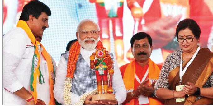
कांग्रेस के पास कौन सा पंजा है जो 1 रुपय में से 85 पैसे खा जाता है? मोदी ने कहा कि कांग्रेस के भ्रष्टाचार के मुद्दे को उठाते हुए कहा कि, इनके

कि कांग्रेस के लोग आज भी देश-दुनिया में भारत को मंदर ऑफ डेमोक्रेसी कहने की हिम्मत नहीं करते, ये सिर्फ भारत के लोकतंत्र पर हमला करते हैं। यही गुलामी की मानसिकता है जिससे आज भारत बाहर आ रहा है। भाजपा सरकार अपनी संस्कृति और अपनी विरासत के लिए समर्पित है। उल्लेखनीय है कि प्रधानमंत्री नरेन्द्र मोदी ने आज बंगलुरु में मेगा रोड शो किया। इस दौरान बड़ी संख्या में लोग मौजूद रहे। कर्नाटक में 10 मई को होने वाले विधानसभा चुनाव के लिए प्रधानमंत्री मोदी वहां पहुंचे हैं।