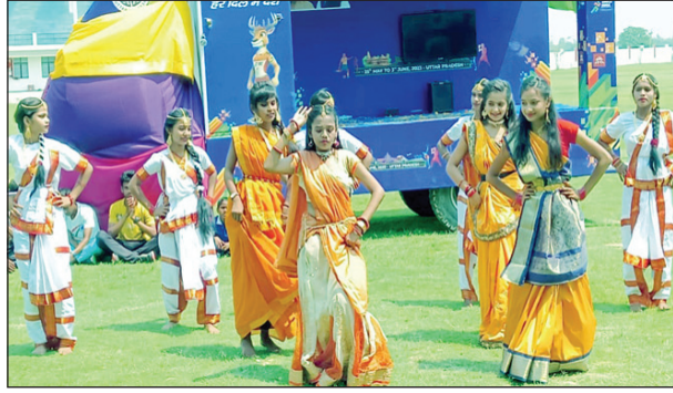
खेलों इंडिया कार्यक्रम में डांस करती बालिकाएं