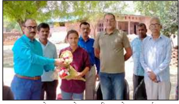
छात्रा को गुलदस्ता देकर सम्मानित करते प्रधानाचार्य।