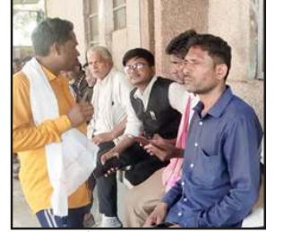
मर्ची में बैठे मृतक के परिजन।