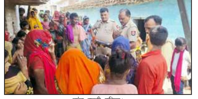
जांच करती पुलिस।