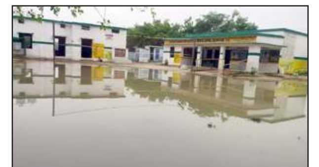
बारिश के पानी से प्राथमिक विद्यालय जरियारी बना तालाब।

रानीगंज तहसील के विकास खंड शिवगढ़ के प्राथमिक विद्यालय जरियारी में इन दिनों बरसात होते ही विद्यालय परिसर तालाब में तब्दील हो गया है। विद्यालय के चारों तरफ लंबालंब पानी भरा हुआ है। यहाँ तक कि कमरे में पानी पहुंच गया है। जलभराव से जहाँही सांप भी विद्यालय के आसपास डेर जमाना