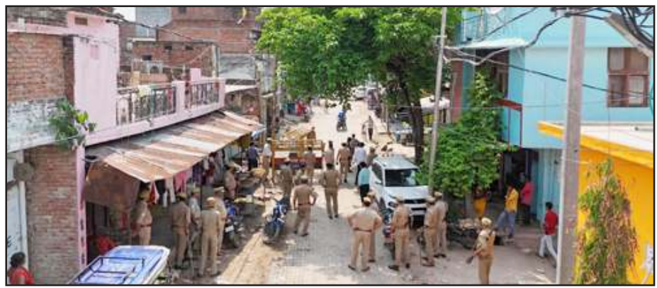
गस्त करती पुलिस बल।