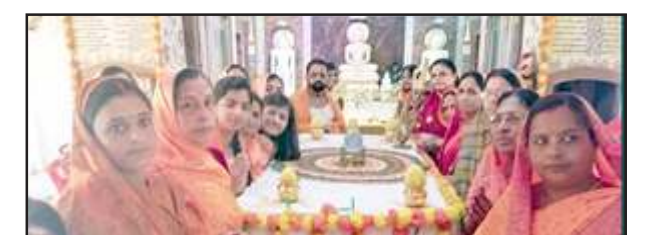
पूजन अर्चन करते जैन धर्म के अनुयायी।