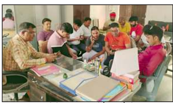
आनलाइन हाजिरी का एक्स पर विरोध जताते शिक्षकगण।

उन्होंने दावा किया कि प्रदेश प्रदेश के 10 लाख से अधिक शिक्षकों ने एक्स पर टिप्पणी कर आनलाइन हाजिरी का विरोध किया है। उन्होंने बताया कि सोमवार 15 जुलाई को शाम चार बजे जिला बेसिक शिक्षा अधिकारी को एक ज्ञापन देकर अवगत कराया जाएगा कि यदि शिक्षकों की मांगें 22 जुलाई तक नहीं मानी जाती