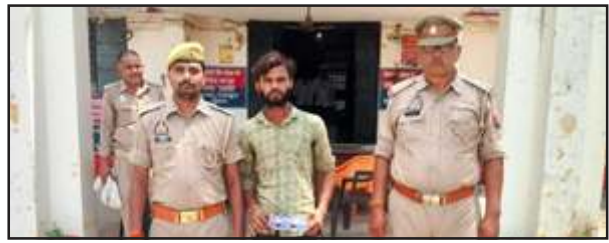
पुलिस गिरफ्त में चोर।