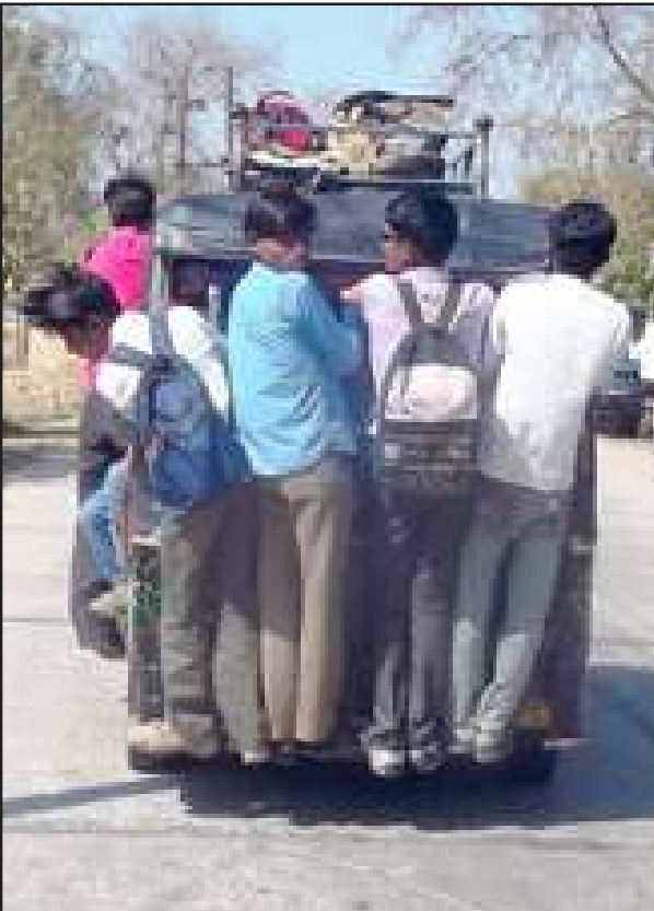
सीएम के आदेश बेअसर

डग्गामार वाहन जिले के सभी रूटों पर धड़ल्ले से चल रहे हैं। ये यात्रियों से मनमानी किराया वसूलने के साथ अभद्रता से पेश आते हैं। इनकी कहीं शिकायत की जाये तो उल्टा यात्रियों के साथ पुलिस व अन्य अधिकारी पेश आते हैं। एआरटीओ की मेहरबानी से झंझी-मिर्जापुर राजमार्ग में तमाम बसें व