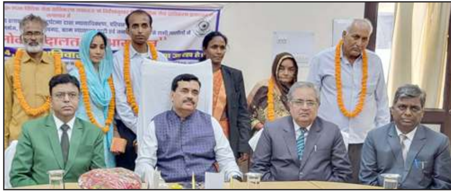
राष्ट्रीय लोक अदालत में मौजूद प्रशासनिक न्यायमूर्ति व न्यायाधीशगण।

न्यायमूर्ति द्वारा सभी न्यायिक अधिकारियों को निर्देशित किया गया