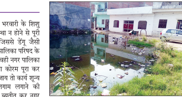
नगर पालिका क्षेत्र में जलभराव का दृश्य

भरवारी कौशांबी। नगर पालिका परिषद भरवारी के शिशु मंदिर कॉलोनी में जल निकासी की व्यवस्था न होने से पूरी कॉलोनी तालाब में तब्दील हो गई है जिससे डेंगू जैसी जघन्य बीमारी फैली हुई है उस पर नागर पालिका परिषद के अधिशाषी अधिकारी धृत राष्ट्र बने हुए है वही नगर पालिका परिषद के कर्मचारी कागजों में तो अपना काम पूरा कर चुके है जबकि जमीनी हकीकत में देखा जाय तो कार्य शून्य है ऐसे में कर्मचारियों के उपर लगातार लगे की आवश्यकता है मोहल्ले में जाकर समय ब्यतीत कर नगर पालिका के जिम्मेदार आल इस वेल करके चले आते है इसके किसी भी कार्य को किसी अधिकारी को देखने की आवश्यकता नहीं होती 'अब सवाल उठता है की लोग अपने आप को असहाय वा असुरक्षित महसूस करते हुए अपना जीवन जीने को मजबूर है जबकि सरकार की तरफ से गाइड लाइन भी है की किसी मोहल्ले में पानी न ठहरने पाए और पच्छर मार दावा का छिड़काव बराबर किया जाना चाहिए परंतु भरवारी क्षेत्र की कॉलोनी में ऐसा होता नहीं दिख रहा है 'अब यह तस्वीर बताने के लिए कम नहीं है लोग कितने महीने से गंदा पानी के बीच में रहकर जीवन जी रहे है इतना ही नहीं घरे के अंदर भी नाली वा तालाब