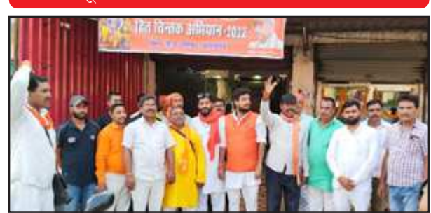
हितचिंतक अभियान के लिये कार्यालय के उद्घाटन पर मौजूद पदाधिकारी

उद्घाटन की तिथियां तय हो चुकी हैं। इस अभियान में 1000 कार्यकर्ताओं को लगाया जाएगा जो टोलियां बनाकर गांव में संपर्क करेंगे। उक्त जिला कार्यालय उद्घाटन के समय मोहनलाल