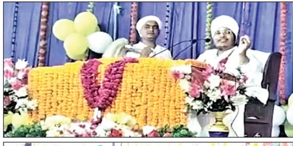
सत्संग में भक्तों को धर्म के बारे में बताते संत व उपस्थित भीड़