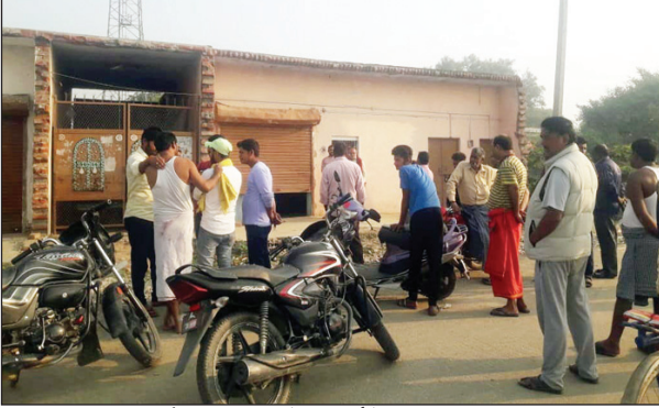
चोरी की घटना के बाद मौके पर जुटी भीड़

घटना की जानकारी मिलते ही मौके पर लगी ग्रामीणों की भीड़, कोखराज थाना क्षेत्र के काशिया पश्चिम गांव में इलेक्ट्रॉनिक की दुकान को चोरों ने बनाया निशाना