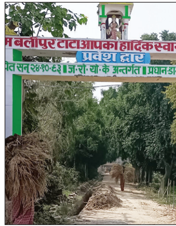
पाइप लाइन डालने के नाम पर खोद गया नाला का दृश्य

कौशाम्बी। जल निगम द्वारा हर घर जल योजना के अंतर्गत करोड़ों की लागत से पाइप लाइन बिछाए जाने का कार्य चालत तहसील क्षेत्र के बलीपुर टाटा गांव में कई महीने पूर्व शुरू कराया गया था पाइप लाइन बिछाए जाने की इस कार्य में शिथिलता की शिकायत अधिकारियों से हुई थी जिस पर जेसीएमसी के निर्माण कार्यों की जांच करने मुख्य विकास अधिकारी मौके पर पहुंचे थे जहां तमाम खामियां जांच के दौरान मिली थी इस पर विभागीय अधिकारियों के साथ ठेकेदारों को फटकार लगाते हुए मुख्य विकास अधिकारी ने समय सीमा के भीतर गुणवत्तापूर्ण पाइपलाइन बिछाए जाने का निर्देश दिया था लेकिन मुख्य विकास अधिकारी का निर्देश जल निगम के अधिकारी और ठेकेदार के ऊपर प्रभावी नहीं हो सका है बलीपुर टाटा गांव में जल जीवन मिशन के अंतर्गत फेस टू जेसीएमसी के द्वारा पाइप लाइन बिछाए