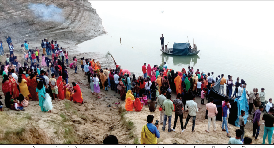
घूरपुर के इरादतगंज गांव के यमुना घाट पर डूबते सूर्य को अर्घ्य देकर पूजा अर्चना करती सुहागिन महिलाएं

दिया। बच्चे की मौत से परिजनों में कोहराम मच गया। मौके पर ग्रामीणों की भारी भीड़ जमा हो गई। ग्रामीणों ने शव रख चक्काजाम कर दिया। सूचना पर पहुंची इलाकाई पुलिस लोगों को समझाने बुझाने का काम कर रही है।