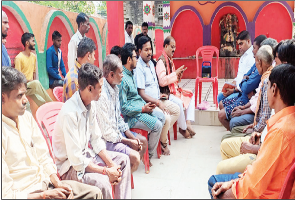
मन की बात सुनते नगरवासी

कौशाम्बी। नगर पालिका परिषद मंडनपुर के दलित बस्ती वार्ड नम्बर 02 डॉ ए पी जे अब्दुल कलाम नगर के लोगों ने प्रधानमंत्री नरेन्द्र मोदी के कार्यक्रम मन की बात को सुना प्रधानमंत्री द्वारा मन की बात कार्यक्रम के द्वारा बताया गया कि आज सुर्नी की रोशनी से किसान अपने खेतों में सोलर लगाकर अपने खेतों की सिंचाई कर रहे हैं जिससे हमारा भारत आत्मनिर्भर बन रहा है और वो जितनी बिल के खर्च से भी बच रहे हैं जिससे उनको खेती करने में लागत की कम लाग रही है। प्रधानमंत्री के मन की बात सुन रहे लोगों ने कहा कि उनके विचारों को अपने व्यक्तित्व जीवन में उतारने की प्रेरणा मिली है इस मौके पर भारतीय जनता पार्टी के पूर्व जिलाध्यक्ष