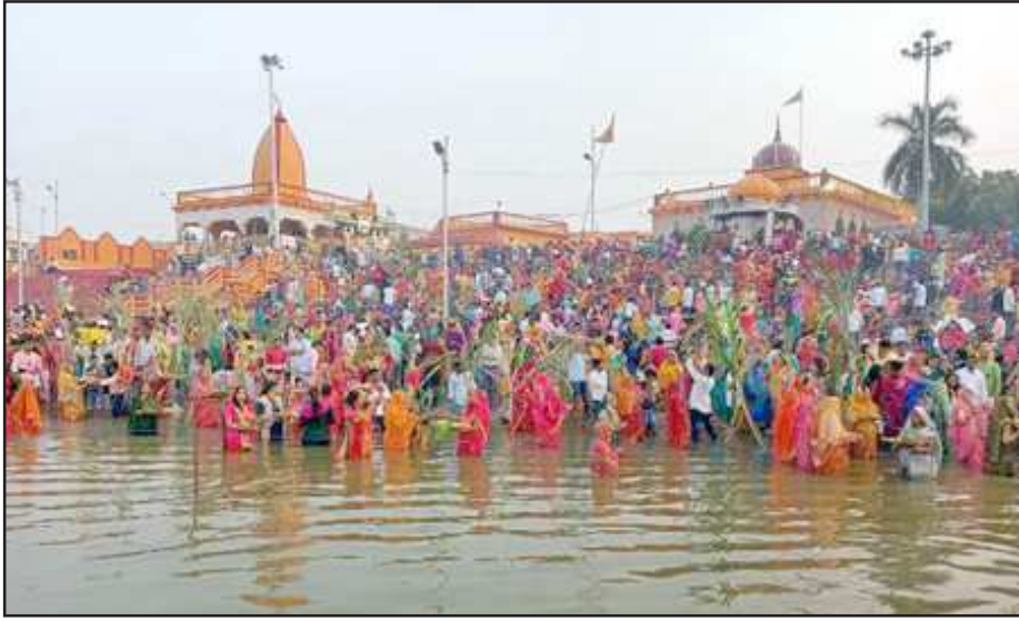
बेल्ला देवी घाट पर ढलते सूर्य को अर्घ्य देवी महिलाएं।

बता दें कि तीन दिनों पहले डाला छठ की पूजा नहाय खाय के महिलाओं ने शुरू की थी। इस मुख्य पूजन के लिये नगर पालिका छठ समिति व मंदिर प्रबंधन ने बेल्ला