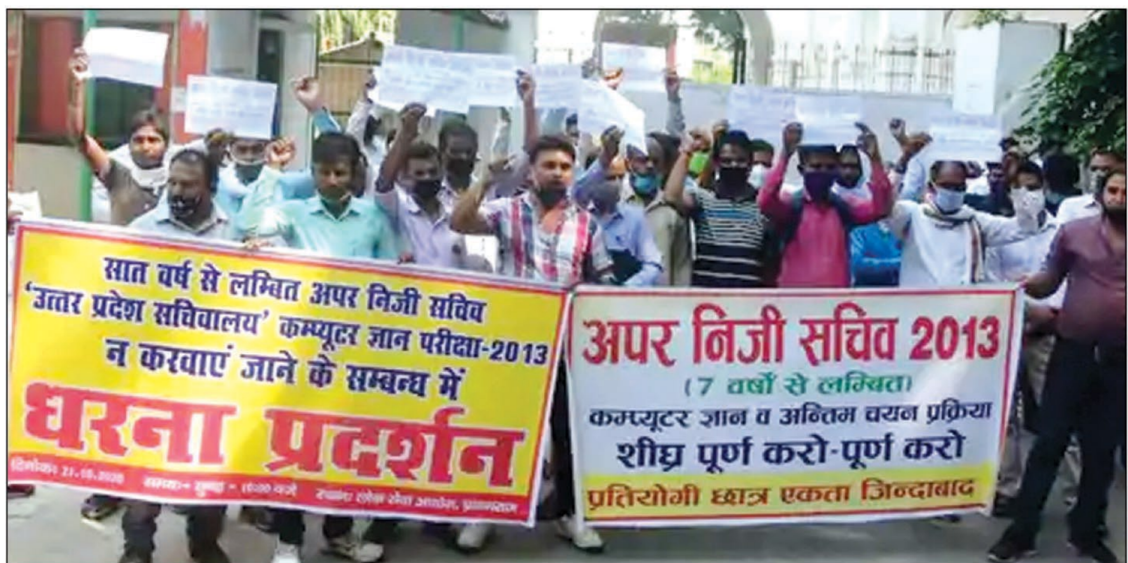
परीक्षा की मांग को लेकर प्रदर्शन करते अभ्यर्थी