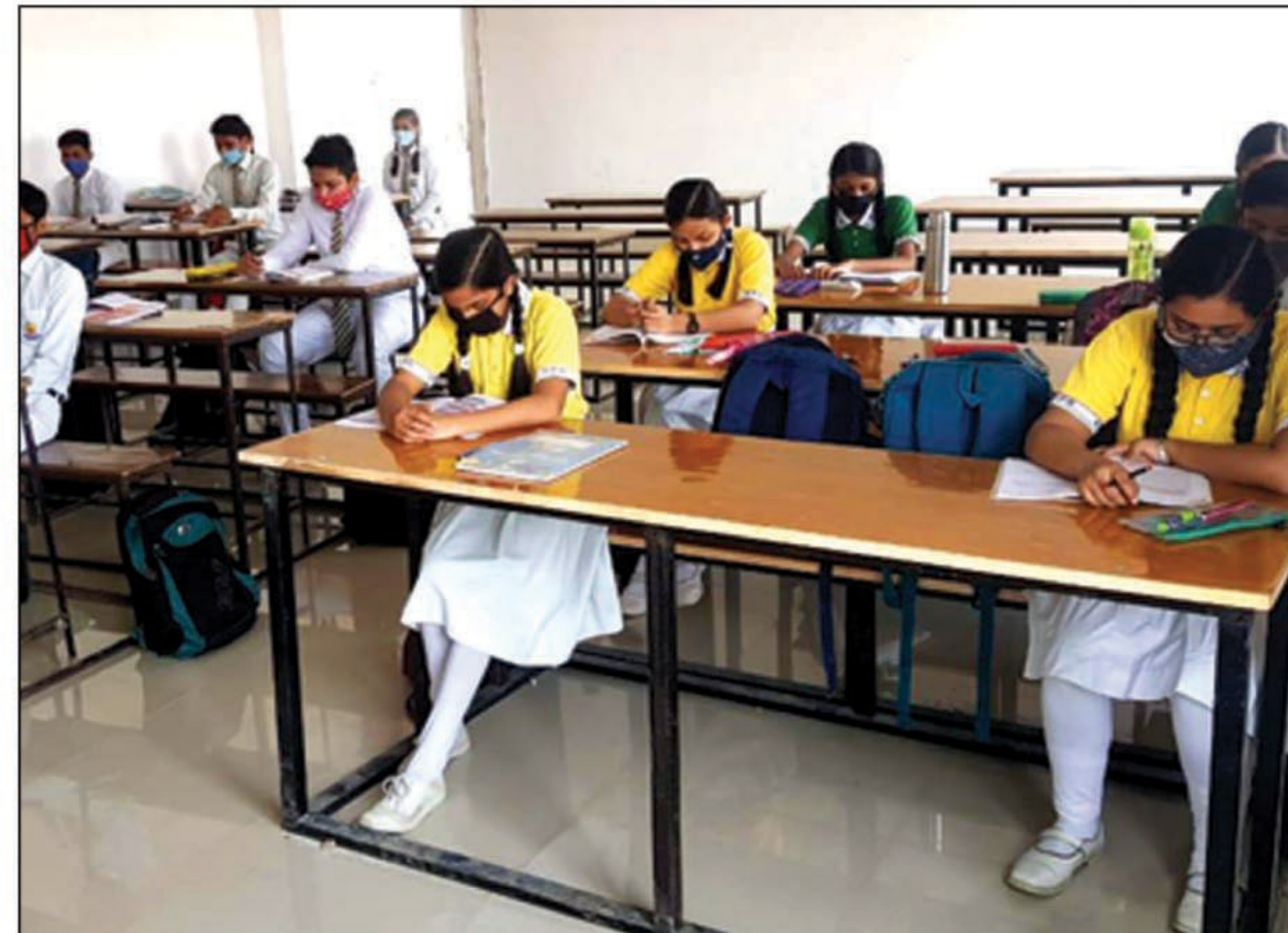
खुले विद्यालय में शिक्षा ग्रहण करते विद्यार्थी