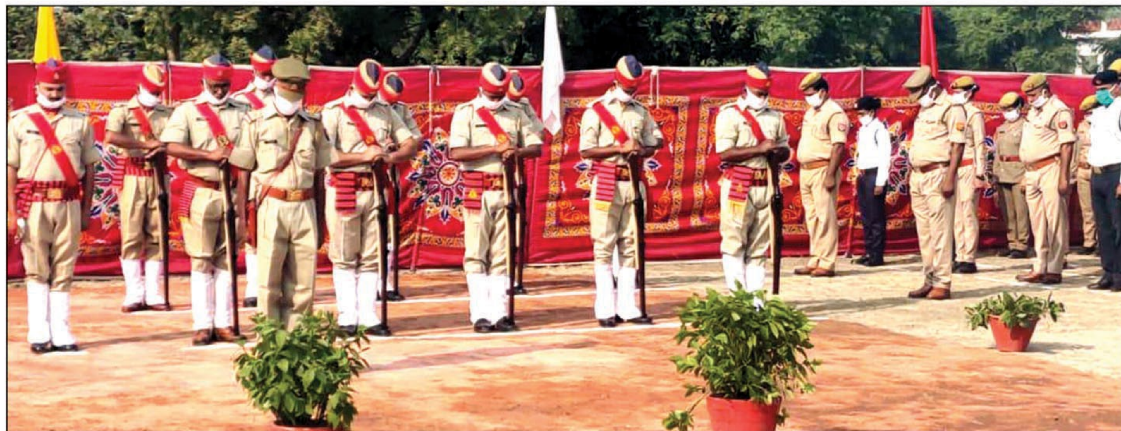
शहीदों को श्रद्धांजलि देते हुए

कौशांबी। पुलिस स्मृति दिवस के अवसर पर पुलिस अधीक्षक कौशांबी एवं उपस्थित समस्त अधिकारी कर्मचारी गण द्वारा पुलिस लाइन कौशांबी में शहीद पुलिसकर्मियों के सम्मान में श्रद्धा सुमन अर्पित कर उन्हें श्रद्धांजलि दी गयी इस मौके पर पुलिस अधीक्षक ने कहा कि शहीद पुलिसकर्मियों की शहादत व्यर्थ नहीं जाएगी उनके योगदान को भुलाया नहीं जा