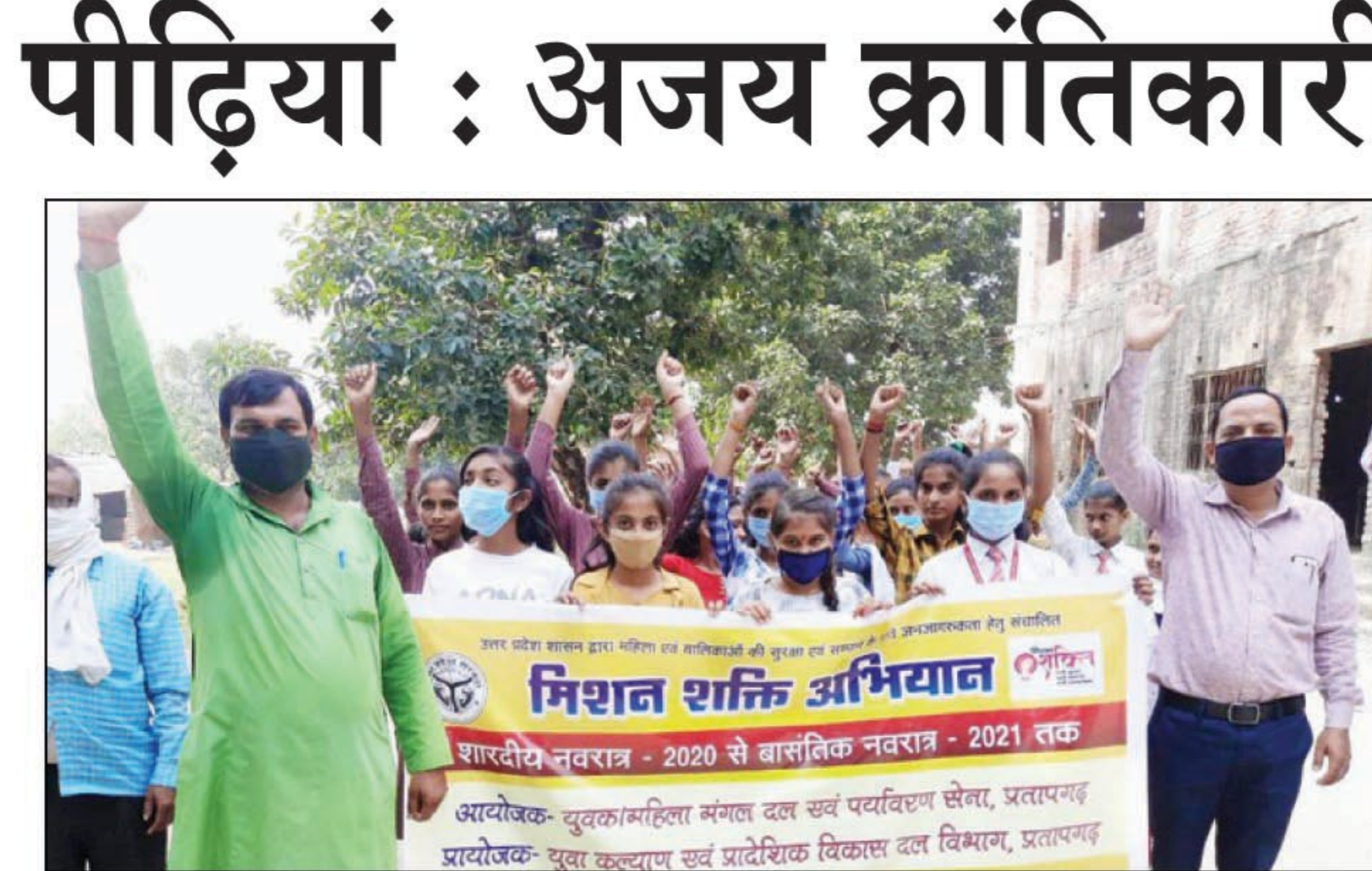
मिशन शक्ति अभियान में रैली निकालें लोगों को जागरूक करते