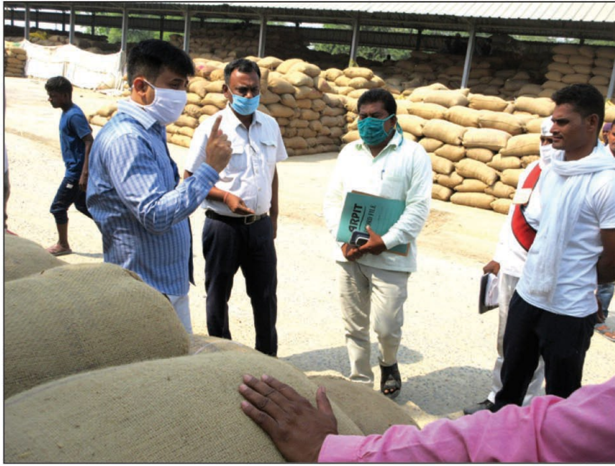
जिलाधिकारी क्राप कटिंग करारकर अपने सामने क्रय केन्द्र पर तौल कराते

जिलाधिकारी ने किसानों को आस्वस्त करते हुए कहा कि सबकी धान को छोड़कर सभी प्रकार के हाईब्रिड धान को गांव में ही कैम्य लगाकर खरीदा जायेगा, जिससे किसानों को इधर-उधर नहीं भटकना पड़ेगा। उन्होंने गांव में कैम्य लगाकर किसानों के धान को खरीदने का निर्देश डिट्टी आरएमओ को दिया है। जिलाधिकारी ने व्यापारियों द्वारा किसानों के खरीदे गये धान को वापस लाकर धान क्रय केन्द्रों में बिचवाने का निर्देश डिट्टी आरएमओ को दिया है, जिससे किसानों को उनकी उपज का मूल्य प्राप्त हो सके। उन्होंने सभी क्रय केन्द्र प्रभारियों तथा डिट्टी