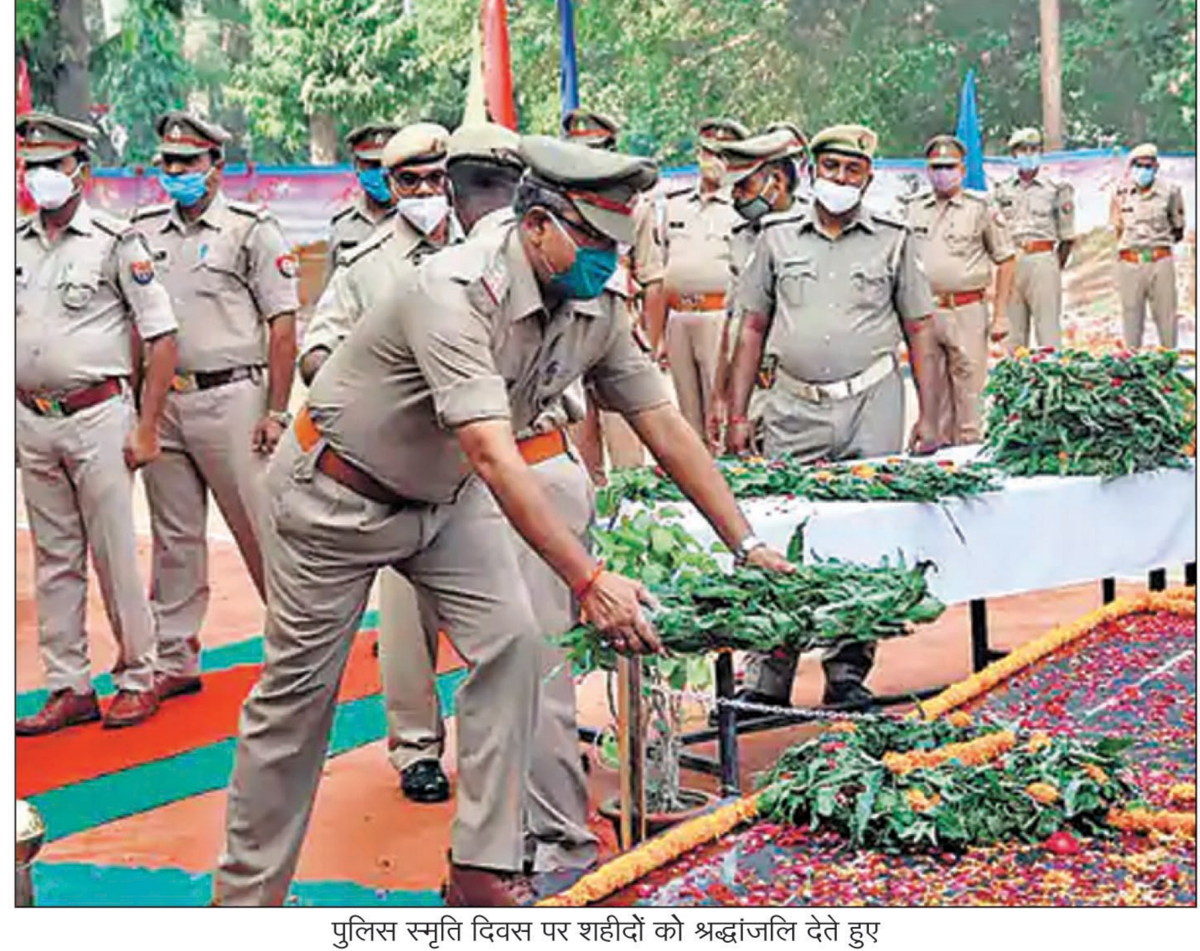
पुलिस स्मृति दिवस पर शहीदों को श्रद्धांजलि देते हुए