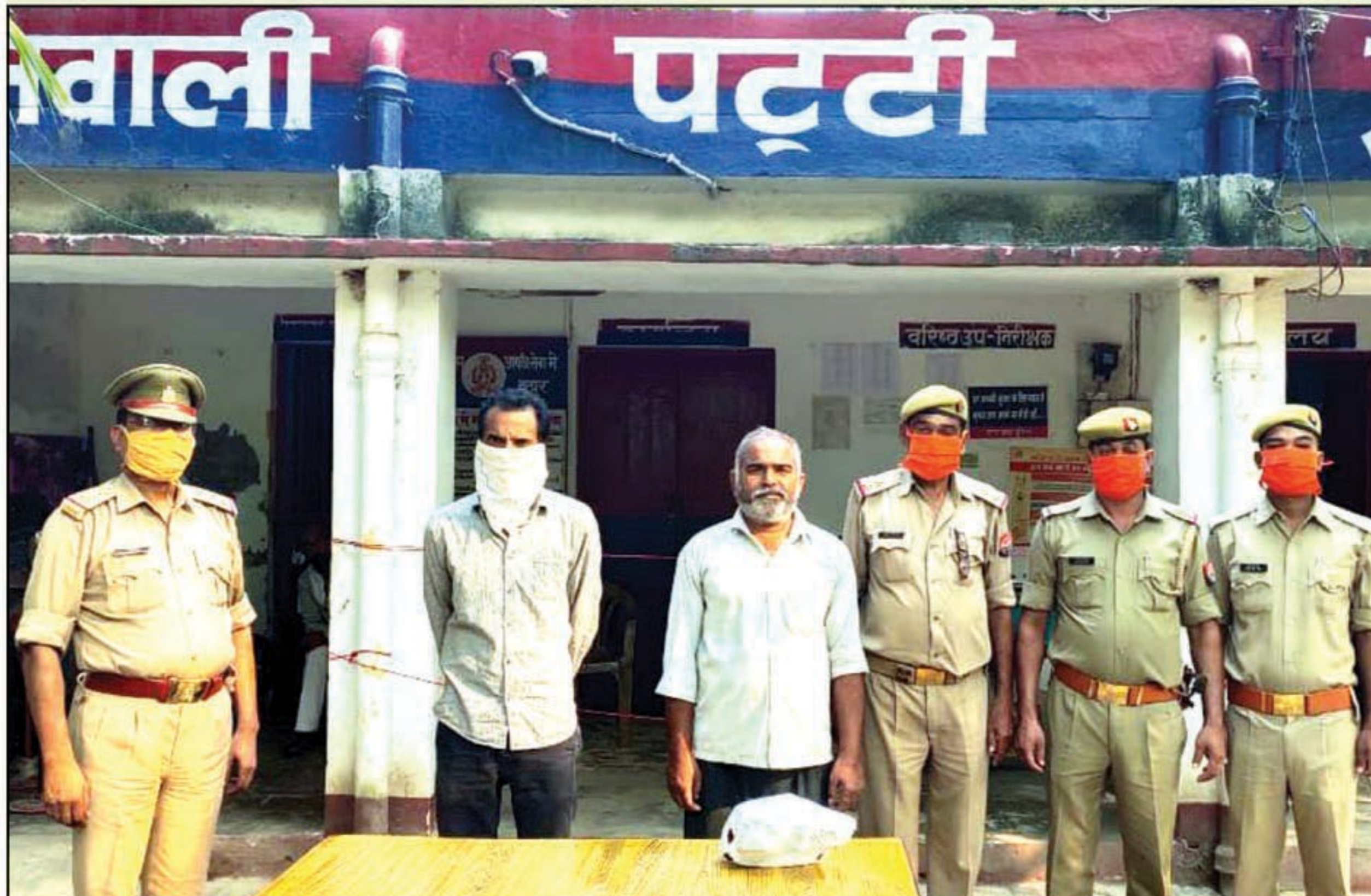
हत्या के अभियोग में बाँधित पुलिस की गिरफ्त में

धारा 60, 60ए, 63 आबकारी अधिनियम, मु0अ0सं0 527ध20 धारा 3ध25 आरम्भ 419, 420, 467, 468, 471, 272 एक्ट का अभियोग पंजीकृत किया गया। भादव व 3ध4 कापी राइट एक्ट व