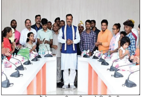
अनाथ बच्चों के साथ दीपावली मनाते डिप्टी सीएम