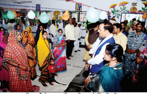
महिलाओं के साथ दीपावली मनाते डिप्टी सीएम

सरकार गरीबों के साथ कंधे से कंधा मिलाकर खड़ी है एवं देश व प्रदेश में गरीब कल्याण के अनेक कार्य किए जा रहे हैं