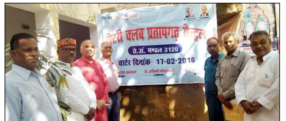
प्रतिभा सम्मान समारोह में मौजूद सरदर विधायक व अन्य।