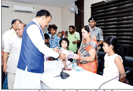
अनाथ बच्चों के साथ दीपावली मनाते डिप्टी सीएम