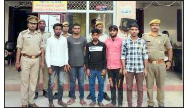
पुलिस की गिरफ्त में मनचले बदमाश।