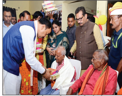
बृद्ध जनों को सम्मानित करते डिप्टी सीएम