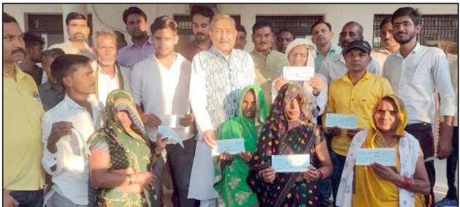
किसानों को चेक प्रदान करते राज्यसभा सदस्य प्रमोद तिवारी।