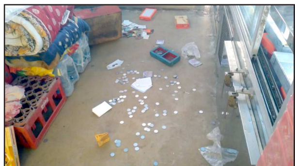
बदमाशों द्वारा मिठाई की दुकान में हुई तोड़फोड़।