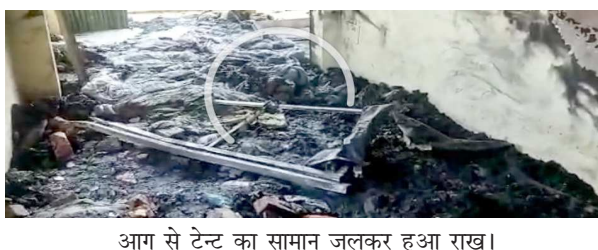
आग से टेन्ट का सामान जलकर हुआ राख।