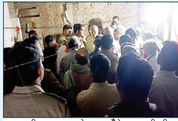
छात्र की आत्महत्या के बाद मौके पर लगी भीड़