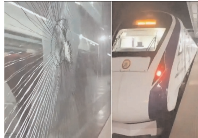
सितंबर को चेन्नई से तिरुनेलवेली डिंडीगुल और मदुरै तक वंदे भारत होते हुए तारनगर, विल्लुपुरम, त्रिची, रेल सेवा की शुरू हुई थी।

तिरुनेलवेली के पास वंदे भारत एक्सप्रेस पर रविवार रात हुए पथराव के बाद सोमवार सुबह ट्रेन को गंतव्य के लिए रवाना किया गया। तिरुनेलवेली रेलवे जंक्शन के सूत्रों के अनुसार, वंदे भारत एक्सप्रेस पर पथराव उस समय हुआ जब ट्रेन वंजी मिनियाची स्टेशन के करीब से गुजर रही थी। पथराव में 9 डिब्बों की खिड़की के पैनेल टूट गए। हालांकि, पथराव में कोई भी व्यक्ति घायल नहीं हुआ। सोमवार सुबह 6 बजे अस्थायी मरम्मत के ट्रेन को रवाना कर दिया गया। घटना की जांच चल रही है। उल्लेखनीय है कि पिछले साल 24