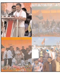
की सरकार चाहती है कि एचईसी काम करना बंद कर दे। इसे भी प्राइवटाइज कर दिया जाये। मोदी सरकार एचईसी के लोगों को बेरोजगार करना चाहती है,

भारत जोड़ो न्याय यात्रा के तहत कांग्रेस सांसद राहुल गांधी झारखंड में हैं। यात्रा के तहत यहां धुवों स्थित शहीद मैदान में आयोजित जनसभा को राहुल गांधी ने संबोधित किया। इस दौरान राहुल ने हैवी इंजीनियरिंग कापोरेशन (एचईसी) के मुद्दे पर केन्द्र की मोदी सरकार पर जमकर हमला बोला। राहुल ने कहा कि एचईसी का गला क्यो घोंटा जा रहा है। एचईसी के साथ अन्याय क्यो हो रहा है। कांग्रेस सांसद ने आरोप लगाते हुए कहा कि केन्द्र