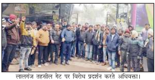
लालगंज तहसील गेट पर विरोध प्रदर्शन करते अधिवक्ता।

लालगंज प्रतापगढ़। लालगंज तहसील में एसडीएम के तबादले की मांग को लेकर बुधवार को तहसील प्रांगण में अधिवक्ताओं ने एसडीएम के विरुद्ध नारेबाजी करते हुए विरोध प्रदर्शन किया। अधिवक्ताओं ने सातवें दिन तहसील की सभी अदालतों में न्यायिक कामकाज का पूर्ववत् बहिष्कार जारी रखा। इसके चलते अदालतों में कामकाज नहीं होने से कड़के की ठंड में पहुंचे वादकारी मायूस होकर घर वापस लौट रहे देखे जा रहे हैं।