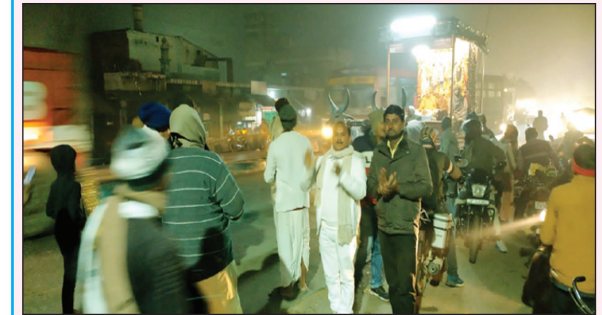
इस्कान कृष्ण भक्ति पदयात्रा का स्वागत करते नगर वासी

नाथ बाबा के पास हैडपंप रिबोर कराया गया है शीतल माता मंदिर के पास रिबोर हुआ है और अनिल के घर के पास हैडपंप रिबोर हुआ जिससे हैण्डपम्प रिबोर के नाम पर 1 लाख 84 हजार 655 रुपए निकाले जा चुके हैं लेकिन इतनी बड़ी धांधली होने के बाद भी आलाधिकारियों के कान में जू नहीं रेंग रही है आखिर बड़ी धांधली कब उजागर होगी जन चर्चाओं की माने तो ग्राम प्रधान और पंचायत सचिव के साथ एडीओ पंचायत की मिली भगत से यह खेल खेला जा रहा है सवाल उठता है कि बिना किसी बड़े अधिकारी की मिली भगत के ग्राम पंचायत में हैडपंप मरम्मत और रिबोर के नाम पर इतने बड़े घोटाले कैसे हो सकते हैं हैडपंप मरम्मत और रिबोर के नाम पर निकाले गए रकम की आला अधिकारियों ने जांच कराई तो पंचायत के जिम्मेदारों की मुश्किलें बढ़ना तय है।