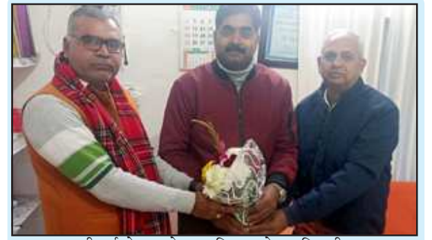
डीआईओएस को सम्मानित करते पदाधिकारी।