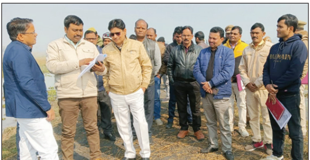
अलवारा झील का निरीक्षण करते जिलाधिकारी

अलवारा झील के संरक्षण, सौन्दर्यीकरण एवं पर्यटन को आकर्षित करने के दृष्टिगत विस्तृत प्रस्ताव तैयार कर शासन को प्रेषित करने के दिये निर्देश