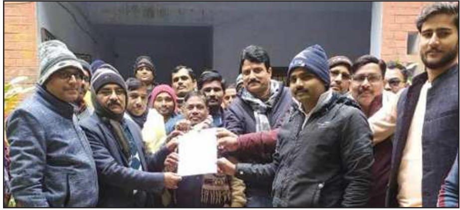
सहायक विकास अधिकारी को ज्ञापन देते ग्राम प्रधान।

सूत्री ज्ञापन में एनएमएम एस ऐप बन्द किया जाय। प्रतिदिन की मजदूरी 213 रु की जगह 400 रु किया जाय क्योंकि कम पैसे मिलने पर कोई मजदूर काम करने को तैयार