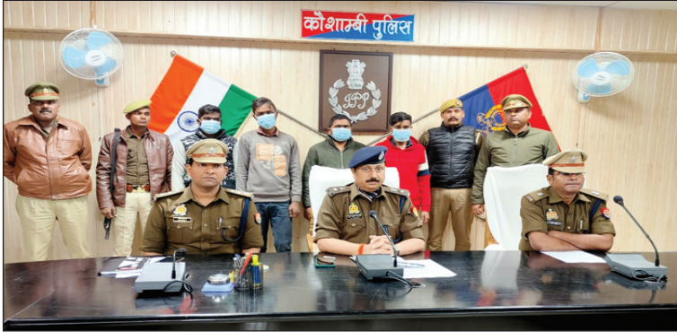
हत्याकांड खुलासे की जानकारी देते पुलिस अधीक्षक पीछे खड़े हत्या अभियुक्त