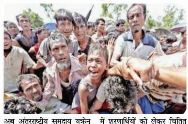
अब अंतरराष्ट्रीय समुदाय यूक्रेन में शरणार्थियों को लेकर चिंतित

सुरक्षा के साथ म्यांमार लौटाया जाए। बांग्लादेश इस बारे में क्या सोचता है? इस सवाल के जवाब में डॉ. हसन महमूद ने कहा कि 2017 में लाखों रोहिंग्या अचानक बांग्लादेश आने के बाद से जो सहायता आ रही थी वह कम हो गई है। बांग्लादेश में पहले से ही बहुत अधिक जनसंख्या घनत्व है - लगभग 1,248 प्रति वर्ग किलोमीटर। यह भारत से ज्यादा है। हालांकि, बांग्लादेश से जितना बन पड़ा है कर रहा है।