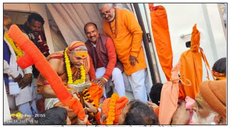
स्वामी शंकराचार्य अविमुक्तेश्वरानन्द से आशीर्वाद लेते लोग।

से प्रयागराज विमानन हेतु प्रस्थान विमान संख्या 91-697 एयरलाइंस एयर के विमान से बिलासपुर