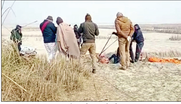
कब्र से शव निकलवाती पुलिस