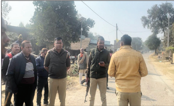
नवीन परती पर अवैध निर्माण को ध्वस्त कराते तहसीलदार व पुलिस टीम

मऊआइमा। करबा चौकी प्रभारी का स्थांतरण हुए दो माह गुजर गए। आज तक किसी भी प्रभारी की तैनाती न होने से विवेचना अधूरा पड़ा हुआ है। प्राप्त जानकारी के मुताबिक मऊआइमा कस्बा में तैनात प्रभारी का स्थांतरण हुए लगभग दो माह हो गए हैं। परन्तु आज तक कोई प्रभारी की तैनाती न होने से करबा की विवेचना का कार्य अधूरा पड़ा हुआ है। इसी प्रकार हल्का नम्बर एक में तीन दरोगाओं की जगह एक दरोगा, हल्का नम्बर दो में तीन दरोगाओं की तैनाती है। जबकि तीन में केवल दो दरोगाओं की तैनाती है। हल्का चार में तीन के स्थान पर एक दरोगा की तैनाती है। मऊआइमा में पुलिसकर्मियों की तैनाती न होने से क्षेत्र की निगरानी का भार तैनात अन्य दरोगाओं पर पड़ रहा है।