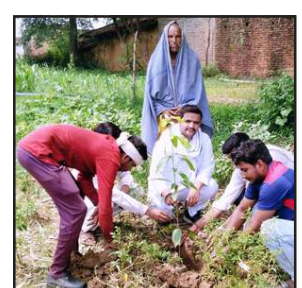
पौधा लगाते सपा नेता।