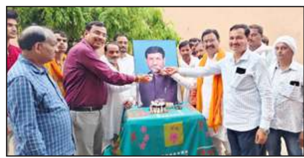
पूर्व सांसद का जन्मदिन मनाते समर्थक।

चित्रकूट। बुंदेलखंड के कदावर राजनेता/पूर्व भाजपा सांसद आरके सिंह पटेल का जन्मदिन पार्टी कार्यकर्ताओं व समर्थकों ने बांदा-चित्रकूट संसदीय क्षेत्र में धूमधाम से मनाया। बुधवार को बांदा-चित्रकूट लोकसभा से भाजपा सांसद आरके सिंह पटेल के कैंबिनेट मंत्री रहे आरके सिंह पटेल का जन्मदिन बल्दाऊगंज स्थित आवास में पार्टी कार्यकर्ताओं व समर्थकों ने केक काटकर धूमधाम से मनाया। इस मौके पर वरिष्ठ नेता शक्ति प्रताप सिंह तोमर ने कहा कि बुंदेलखंड