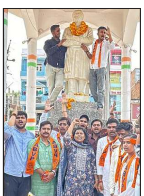
परिसर चलो अभियान के रथ में मौजूद अभविष्य पदाधिकारी।