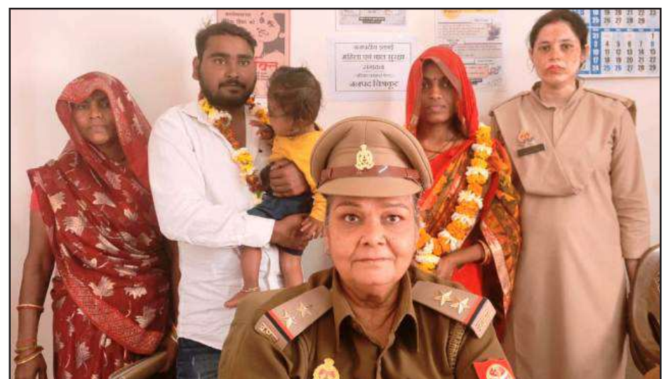
सुलह कराती पुलिस।