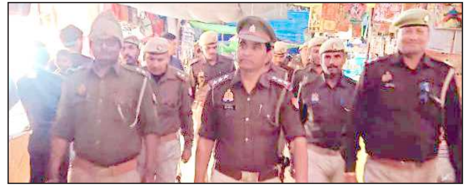
पैदल गस्त करती पुलिस।