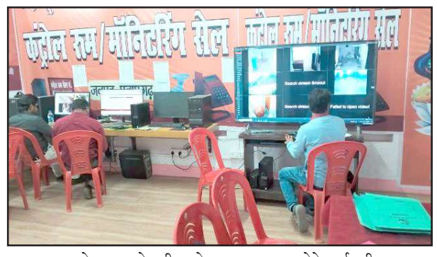
कन्ट्रोल रूम से परीक्षा केन्द्र का जायजा लेते कर्मचारी।

इंटर बंगला में एक मात्र पंजीकृत परीक्षार्थी भी रहा अनुपस्थित