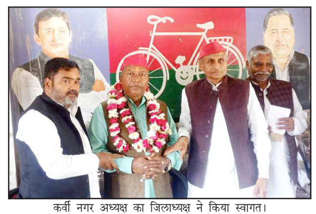
कर्बी नगर अध्यक्ष का जिलाध्यक्ष ने किया स्वागत।