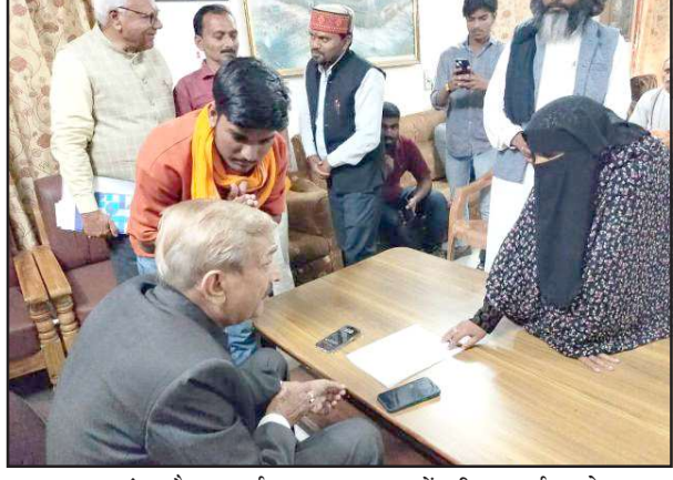
लालगंज कैम्प कार्यालय पर समस्याओं की सुनवाई करते राज्यसभा सदस्य प्रमोद तिवारी

शुक्रवार को रामपुर खास के एक दिवसीय दौरे पर पहुंचे विपक्ष के उपनेता प्रमोद तिवारी लालगंज नगर स्थित कैम्प कार्यालय पर कार्यकर्ताओं से संवाद कर रहे थे। उन्होंने कार्यकर्ताओं से कहा कि राहुल