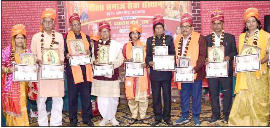
शारदा संगीत महाविद्यालय में आयोजित कार्यक्रम में मौजूद अतिथिगण।

उक्त अवसर पर समारोह के मुख्य अतिथि पूर्व बाल न्यायाधीश