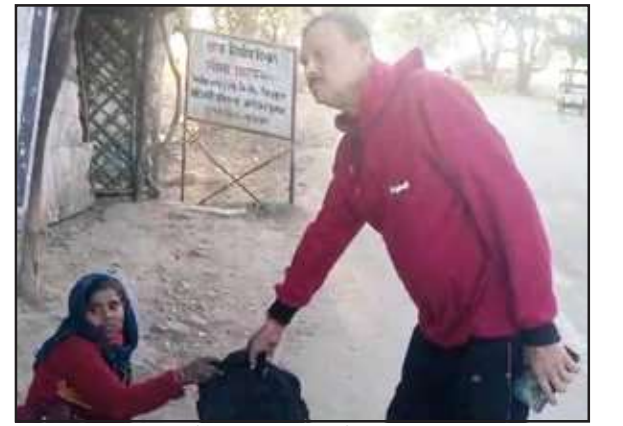
महिला को सड़क पार कराते एसपी वाचक।

पुलिस टीमों ने जांच दौरान लोगों से कहा कि हेलमेट व सीटबेल्ट बिना लगाये यात्रा न करें। घर में लोग आपका इंतजार कर रहे हैं। ऐसे में हेलमेट लगाकर ही यात्रा करें।