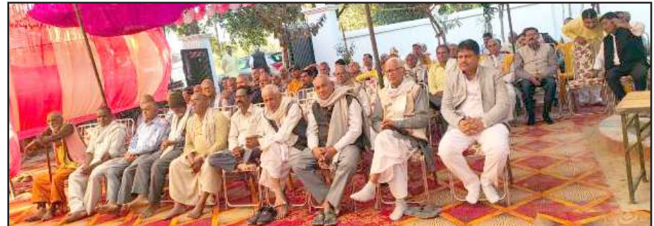
श्रीमद भागवत कथा सुनने को उमड़ी भीड़।

आचार्य ने कहा कि जब-जब धरती पर धर्म की हानि होती है और अधर्म बढ़ता है तब-तब भगवान मनुष्य रूप में पृथ्वी पर अवतरा विपरीत परिस्थितियों के बावजूद प्रह्लाद ने भक्ति का मार्ग नहीं छोड़ा। भगवान ने नरसिंह रूप में वराह अवतार लेकर हिरण्यकश्यप का वध कर उन्हें अपने परमधाम को पहुंचाया। भक्त प्रह्लाद के कारण ही अधर्मी पिता को भी परमधाम प्राप्त हुआ। कपिल भगवान का प्राकट्य एवं कपिल देवहूति संवाद, भगवान शिव के गर्णों द्वारा दक्ष यज्ञ विध्वंस, ध्रुव चरित्र और पुरंजनों पाख्यान की कथा सुनाई। भक्त ध्रुव की कथा सुनाते हुए महाराज ने