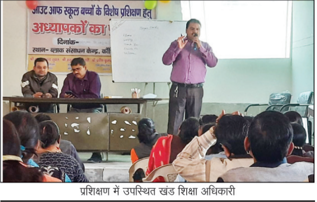
प्रशिक्षण में उपस्थित खंड शिक्षा अधिकारी