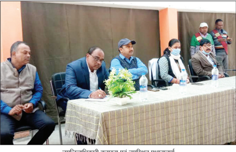
उपजिलाधिकारी करछना एवं उपस्थित प्रधानाचार्य