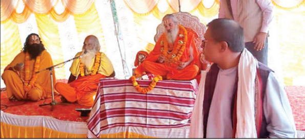
श्री लक्ष्मी नारायण महायज्ञ में मंत्रोच्चार करते आचार्य