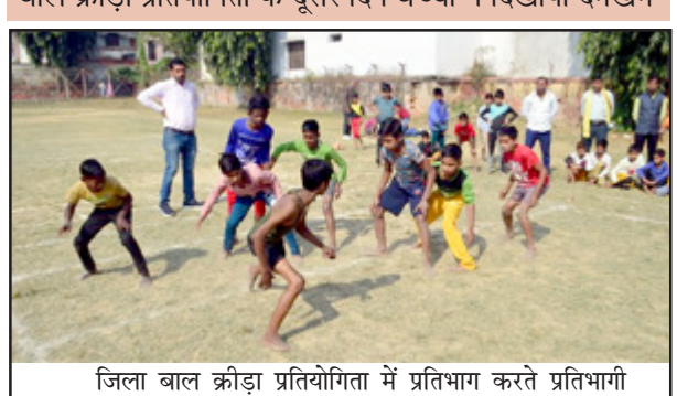
जिला बाल क्रीड़ा प्रतियोगिता में प्रतिभाग करते प्रतिभागी

बाल क्रीड़ा प्रतियोगिता के दूसरे दिन बच्चों ने दिखाया दमखम