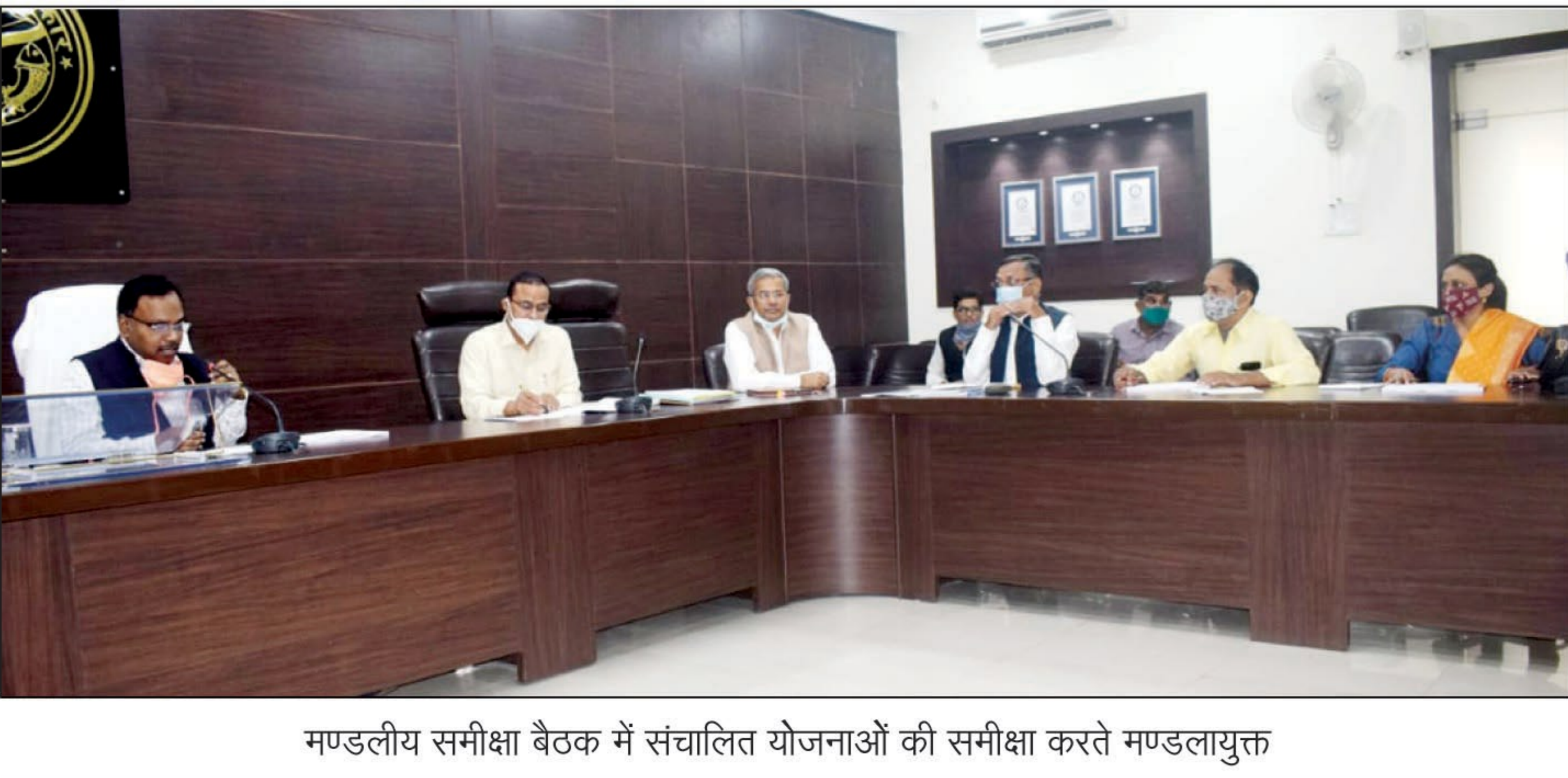
मण्डलीय समीक्षा बैठक में संचालित योजनाओं की समीक्षा करते मण्डलायुक्त