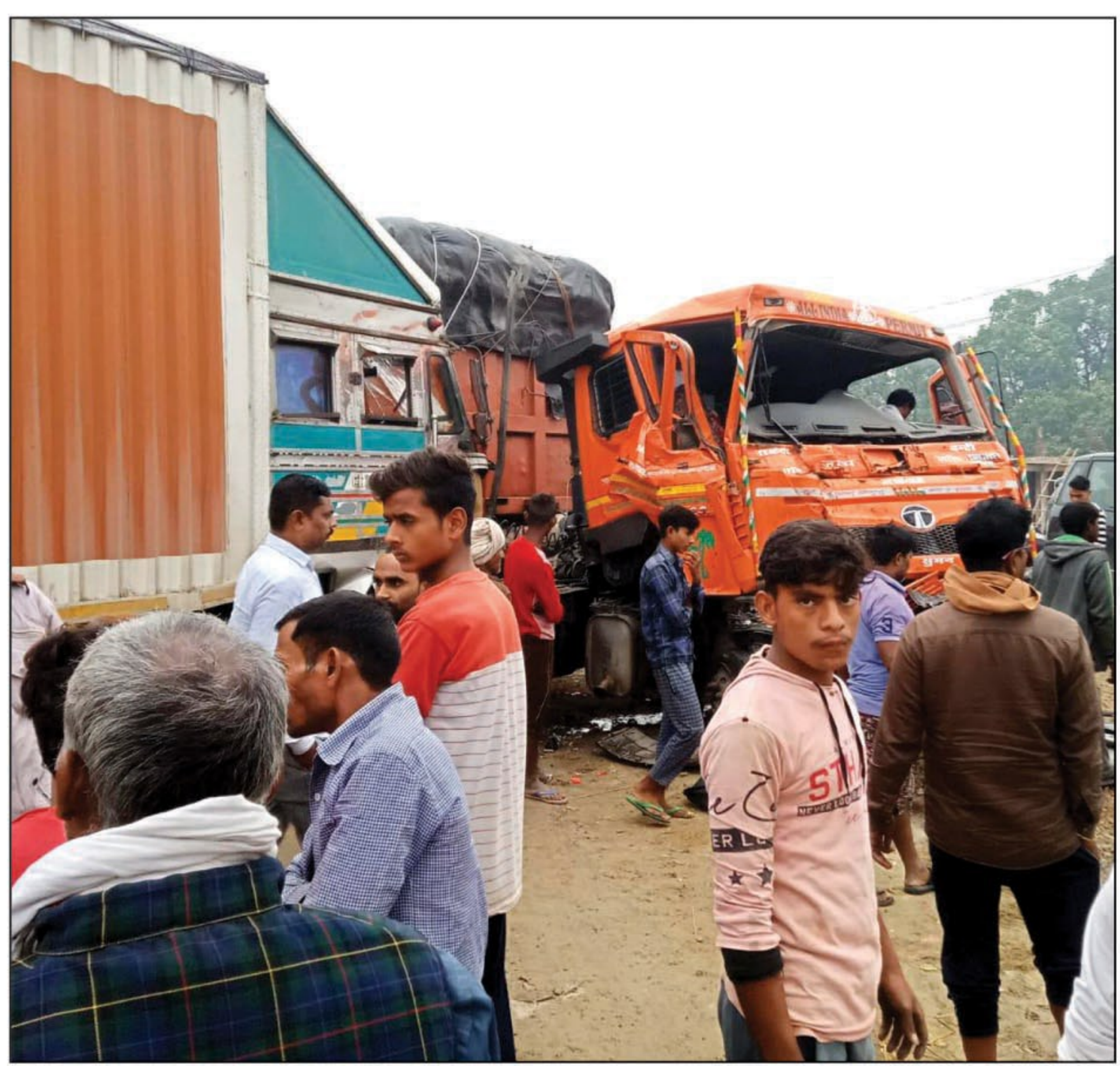
हादसे के बाद मौके पर जमा लोग

कस्बा में जमीनों की कीमत छू रही है आसमान अगर जांच हुई तो खुल जायगी माफियाओं की पोल