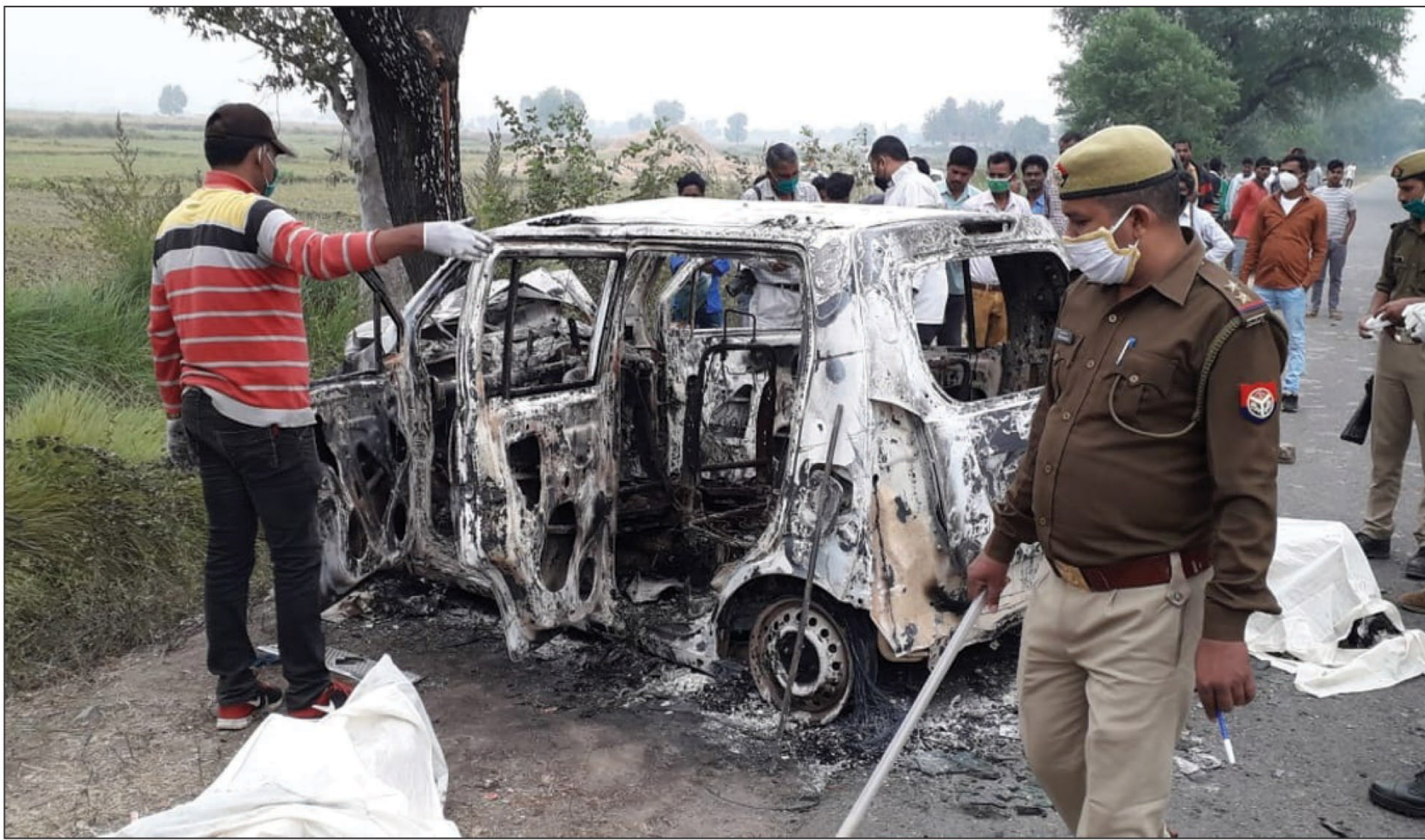
पेड़ से टकराने के बाद आग लगने से कार सवार सहित जलकर खाक कार व जांच पड़ताल करती पुलिस

कोरांव/नैनी। बुधवार देर रात एक विवाह कार्यक्रम से कार चालक और उसकी पत्नी के साथ लौट रहे ठेकेदार की वैगनार कार यमुनापार के कोरांव थाना अंतर्गत जवनियां नहर के समीप बबूल के पेड़ से टकरा गई। टक्कर इतनी तेज थी कि कार में आग लग गई। आग से तीनों लोग जलकर खाक हो गए। पता चलने पर पहुंचे ग्रामीणों ने पुलिस को सूचना दी और घंटों मशकत के बाद आग पर काबू पाया। उसके बाद जानकारी हुई कि कार के अंदर तीन लोग सवार थे। जिनके शरीर का सिर्फ ढांचा बचा था, बाकी सब कुछ जलकर खाक हो गया था। कार के चेचिस नंबर के जरिए पुलिस ने गाड़ी मालिक व उसके ड्राइवर और उसकी पत्नी की शिनाख्त कराने पर पता चला कि वह पूर्व प्रधान का नाती है।