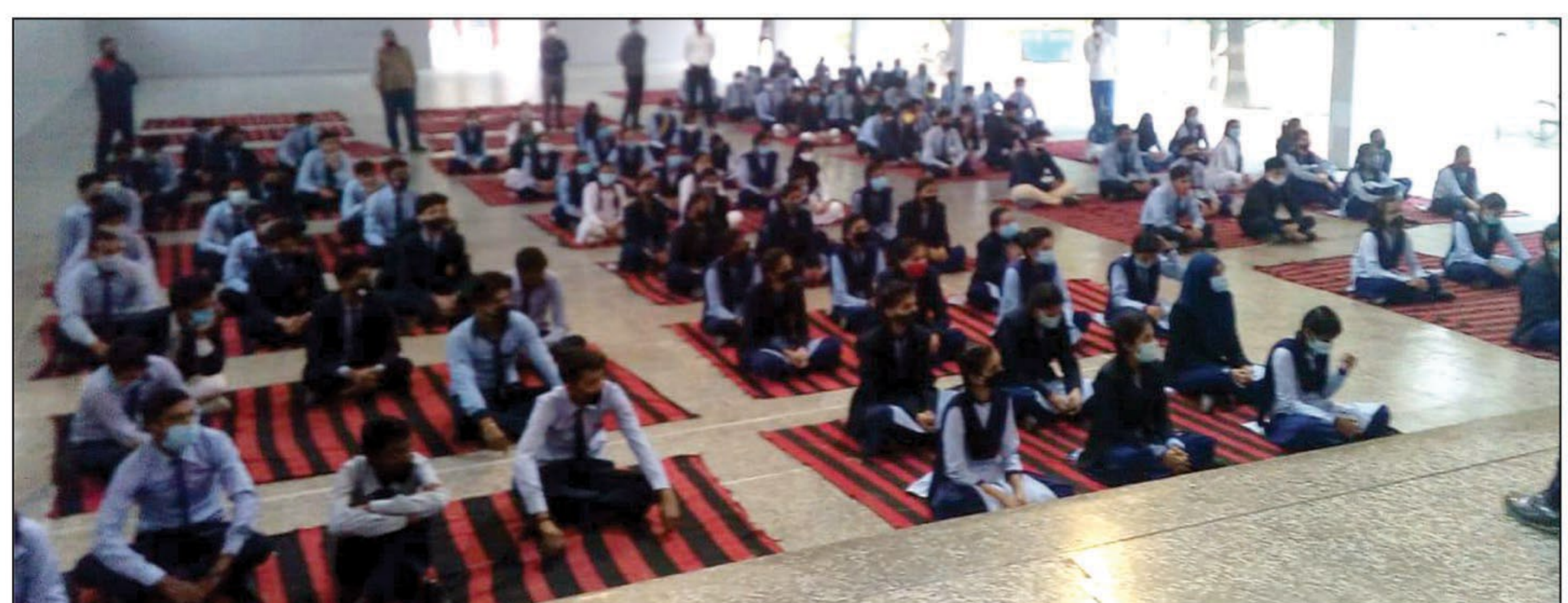
यातायात माह में प्रशिक्षण प्राप्त करते विद्यार्थी