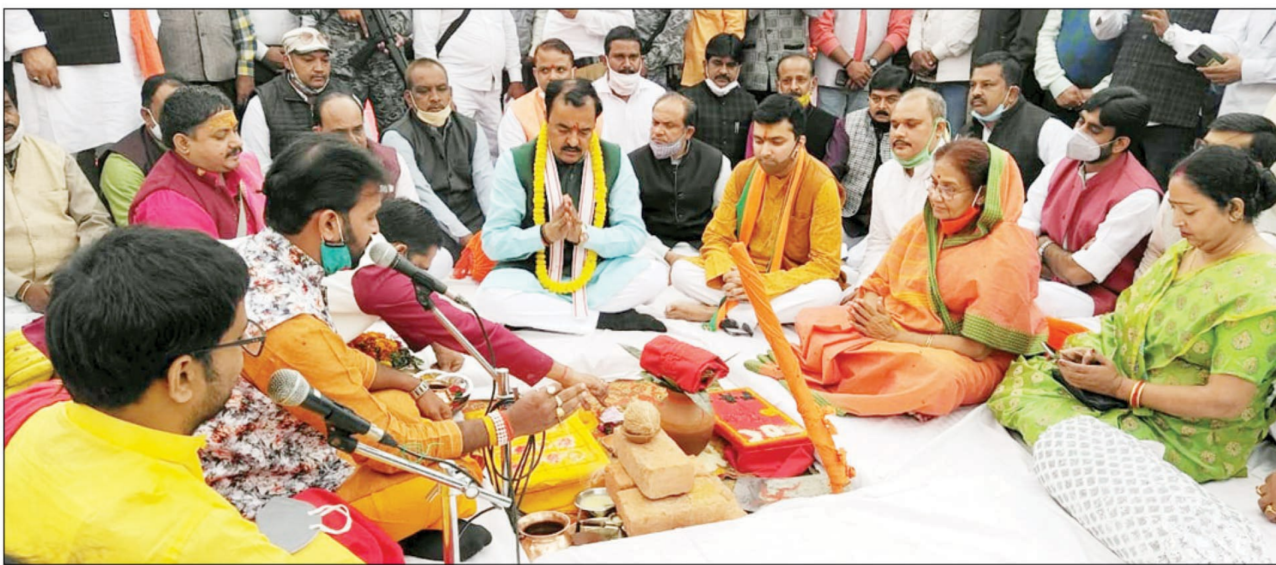
रेल उपरिगामी सेतु का भूमिपूजन एवं शिलान्यास करते उप मुख्मन्त्री केशव प्रसाद मौर्य

इस अवसर पर लोगों को सम्बोधित करते हुए मा0 उपमुख्यमंत्री केशव प्रसाद मौर्य ने कहा कि इस रेल उपरिगामी सेतु के निर्माण से बघाड़ा, दारागंज से आने-जाने वाले लोगों को रेलवे क्रॉसिंग पर लगने वाले जाम से निजात मिलेगी। उन्होंने कहा कि इसके अलावा माघ मेला व कुम्भ मेला में आने वाले स्नानार्थियों के लिए भी यह उपरिगामी सेतु अत्यधिक उपयोगी