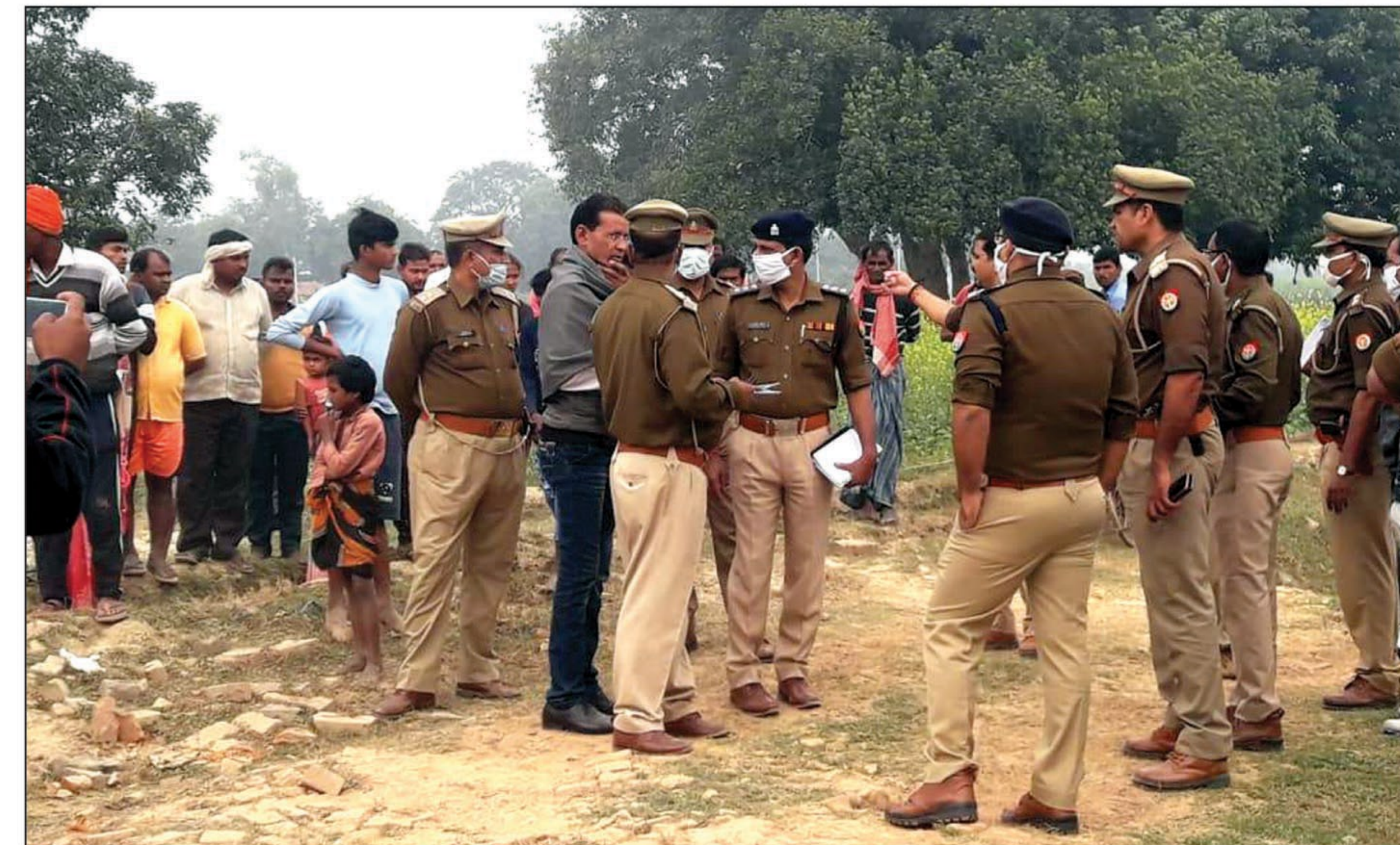
घटनास्थल पर मौजूद पुलिस कप्तान वा जुटी भीड़