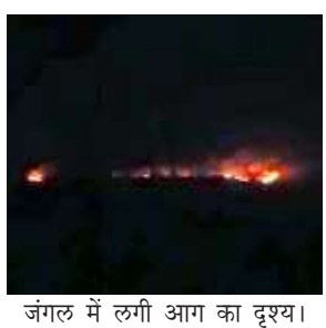
जंगल में लगी आग का दृश्य।

मानिकपुर/चित्रकूट। पिछले हफ्ते से रानीपुर टाइगर रिजर्व जंगल आग से धधक रहा है। वन्य प्राणियों का जीवन खतरे में है। रानीपुर टाइगर रिजर्व मानिकपुर वन परिक्षेत्र भाग-1 चमरौहा क्षेत्र के चिरोल जंगल में भीषण आग लगी है। गुरुवार को रानीपुर टाइगर रिजर्व जंगल में अग्निकांड का खुलासा हुआ। बताया गया कि रात होने के बाद भी आग का भयानक रूप देखा जा रहा है। मानिकपुर के बेधक, बाणाबाबा, ककरेड़ी आदि जंगल आग से खाक हो चुके हैं। लगातार