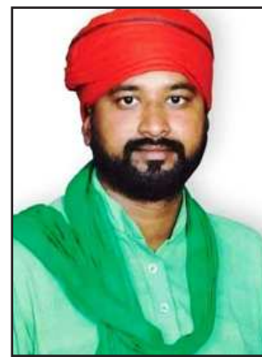
सदर विधायक अनिल प्रधान।

गुरुवार को सदर विधायक अनिल प्रधान ने कहा कि राष्ट्रीय राजमार्ग 35 जिला मुख्यालय कर्वा के पास अमानपुर गांव में भीषण सड़क हादसे का कारण बने डम्पर के फर्जी रवत्रे की उच्च स्तरीय जांच कराई जाये। सूबे के मुख्यमंत्री को लिखे पत्र में कहा कि दो अप्रैल को सवेरे साढ़े पांच बजे राष्ट्रीय राजमार्ग पर गिट्टी लुटे डम्पर व आटों में आमने-सामने भिड़ंत हुई थी। आटों सवार आठ लोगों की मौत हो गई है। भीषण सड़क हादसा होने के बाद जिम्मेदार अधिकारियों की संवेदन हीनता उजागर हुई है। पीडित परिजनों