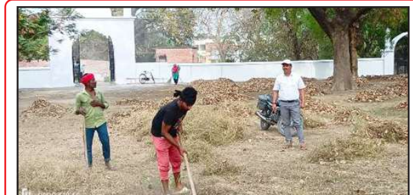
ईदगाह में साफ-सफाई करते नगर पालिका कर्मचारी।

जायेगी। इच्छुक पात्र अभ्यर्थी निर्धारित प्रारूप का निःशुल्क आवेदन समस्त प्रमाण पत्रों, आधार कार्ड, जाति प्रमाण पत्र की प्रतियां प्रेषित फोटो कापी एवं एक फोटो के साथ विलम्बतम 10 अप्रैल तक जिला सेवायोजन कार्यालय प्रांगण में किसी भी कार्य दिवस में जमाकर सकते हैं।