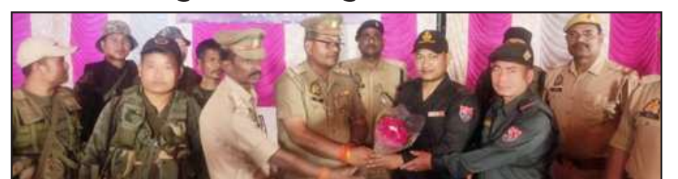
मणिपुर फोर्स का स्वागत करते पुलिस अधिकारी।