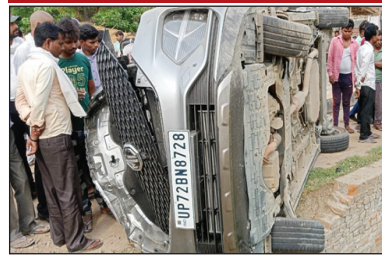
अखंड भारत संदेश