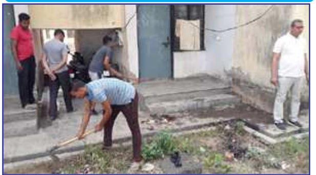
थाना परिसर की साफ-सफाई करते पुलिस कर्मी।

उन्होंने क्षेत्राधिकारी पट्टी और अन्य पुलिसकर्मियों को निर्देशित किया था। सोमवार की दोपहर