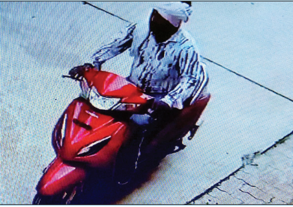
सीसीटीवी कैमरे में कैद बदमाश की तस्वीर