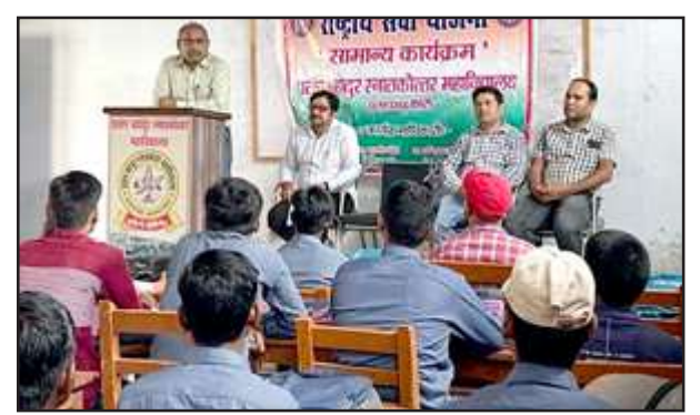
जागरूकता संगोष्ठी में बोलते वक्ता।