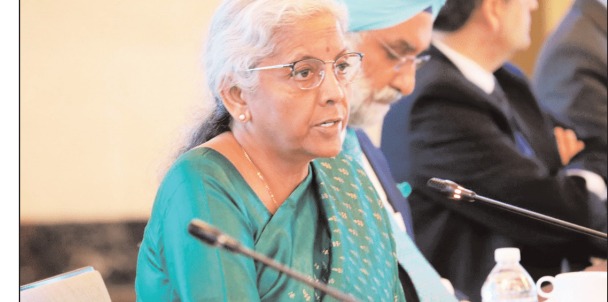
रहे थे। अगर उन्हें वास्तव में परवाह होती, तो वे इस पर चर्चा करते। उन्होंने कहा कि आज आपने राज्यसभा में देखा कि सुबह सूची में मणिपुर मुद्दे पर चर्चा होनी तय थी।

नई दिल्ली: केन्द्रीय वित्त मंत्री निर्मला सीतारमण ने सोमवार को विपक्ष पर जमकर निशाना साधा। उन्होंने कहा कि विपक्ष मणिपुर मुद्दे पर चर्चा में हिस्सा नहीं लेना चाहता। आज जब यह मुद्दा संसद में उठाया गया तो विपक्ष चर्चा से भागता नजर आया। विपक्ष के व्यवहार से दुखी हूँ। उन्होंने कहा कि मणिपुर जैसे संवेदनशील मसला विपक्ष के लिए सिर्फ एक राजनीतिक मुद्दा है। आज यह साबित हो गया कि वे मणिपुर मुद्दे पर सिर्फ मगरमच्छ के आंसू बहा