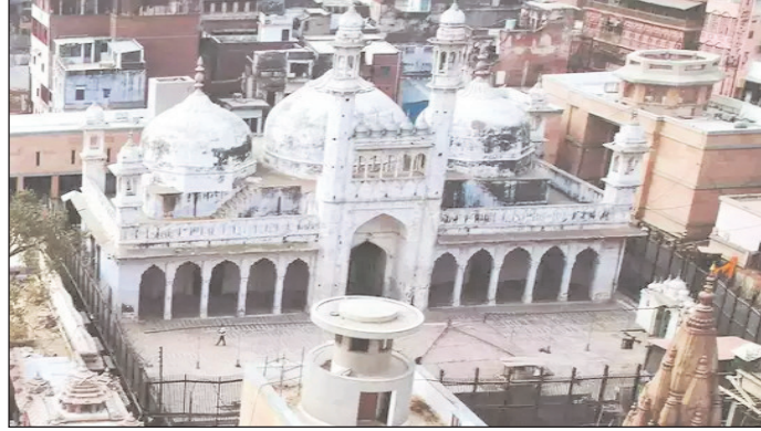
नेशन फर्स्ट। अगर देश में किसी को रहना है तो राष्ट्र को सर्वोपरि मानना है, अपने मत और मजहब को नहीं। वहीं, अखिल भारतीय संत समिति महामंत्री

चाहते हैं समाधान हो। दरअसल, मुख्यमंत्री योगी एएनआई के पॉडकास्ट में अपनी बात रख रहे थे। इस दौरान ज्ञानवापी को लेकर पूछे गए सवाल के जवाब में उन्होंने बड़ा बयान दिया। इस दौरान एक और अन्य सवाल के जवाब में मुख्यमंत्री योगी आदित्यनाथ ने कहा कि देश संविधान से चलेगा, मत और मजहब से नहीं। देखिए मैं ईश्वर का भक्त हूँ, लेकिन किसी पाखंड में विश्वास नहीं करता हूँ। आपका मत, आपका मजहब, अपने तरीके से होगा, अपने घर में होगा। अपनी मस्जिद, अपने इबादतगाह तक होगा। सड़क पर प्रदर्शन करने के लिए नहीं और इसको आप जो है किसी भी अन्य तरीके से दूसरे पर थोप नहीं सकते।