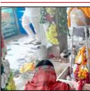
शिव मंदिर पर पूजन-अर्चन करती महिलाएं।

बताते हैं कि जो भी पूर्ण भाव और आस्था के साथ मंदिर में दर्शन और रुद्राभिषेक करता है उसकी हर मनोकामना जरूर पूर्ण होती है। मंदिर के बाहर बना हुआ कुंआ भी बहुत प्राचीन है। मंदिर पर रकने वाले श्रद्धालु