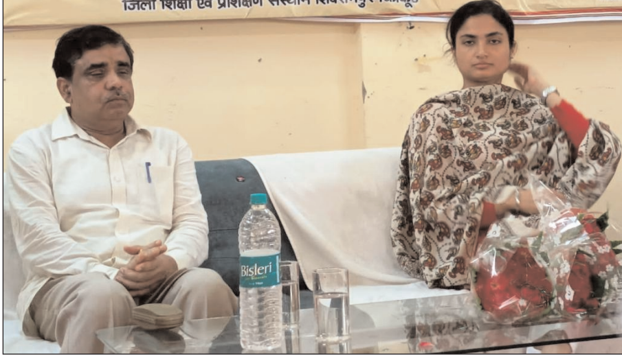
विज्ञान किट, निपुण तालिका, शिक्षक संदर्शिका, कहानी पोस्टर, चित्र पोस्टर आदि के उपयोग को