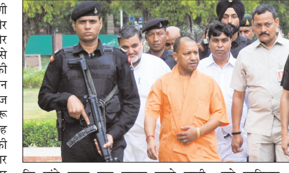
कि लंबे समय तक शासन करने वाली कांग्रेस, सपा और बसपा की सरकारों ने जनता को जनहित और विकास की योजनाओं के लाभ से वंचित रखा। कांग्रेस नारा देकर भी गरीबी नहीं हटा पाई। सपा के

गोरखपुर: उत्तर प्रदेश के मुख्यमंत्री योगी आदित्यनाथ ने कहा कि संसाधनों से अमीर होने के बावजूद उत्तर प्रदेश पूर्व की गैर भाजपा सरकारों की कुनीति व कुशासन से गरीब और बीमारू राज्य बना था। भाजपा की डबल इंजन सरकार ने सुनीति और सुशासन से उत्तर प्रदेश को नई पहचान दी है। आज दुनिया मानती है कि यूपी गरीब व बीमारू राज्य नहीं बल्कि वह प्रदेश है, जहां छह साल में साढ़े पांच करोड़ लोग गरीबी की रेखा से ऊपर उठे हैं। मुख्यमंत्री योगी सोमवार को वीर बहादुर सिंह स्पोर्ट्स कॉलेज परिसर में आयोजित पीपम आवास योजना के लाभार्थी सम्मेलन को संबोधित कर रहे थे। इस दौरान मुख्यमंत्री ने पूर्ववर्ती सरकारों को सवालियों के घेर में खड़ा किया। उन्होंने कहा