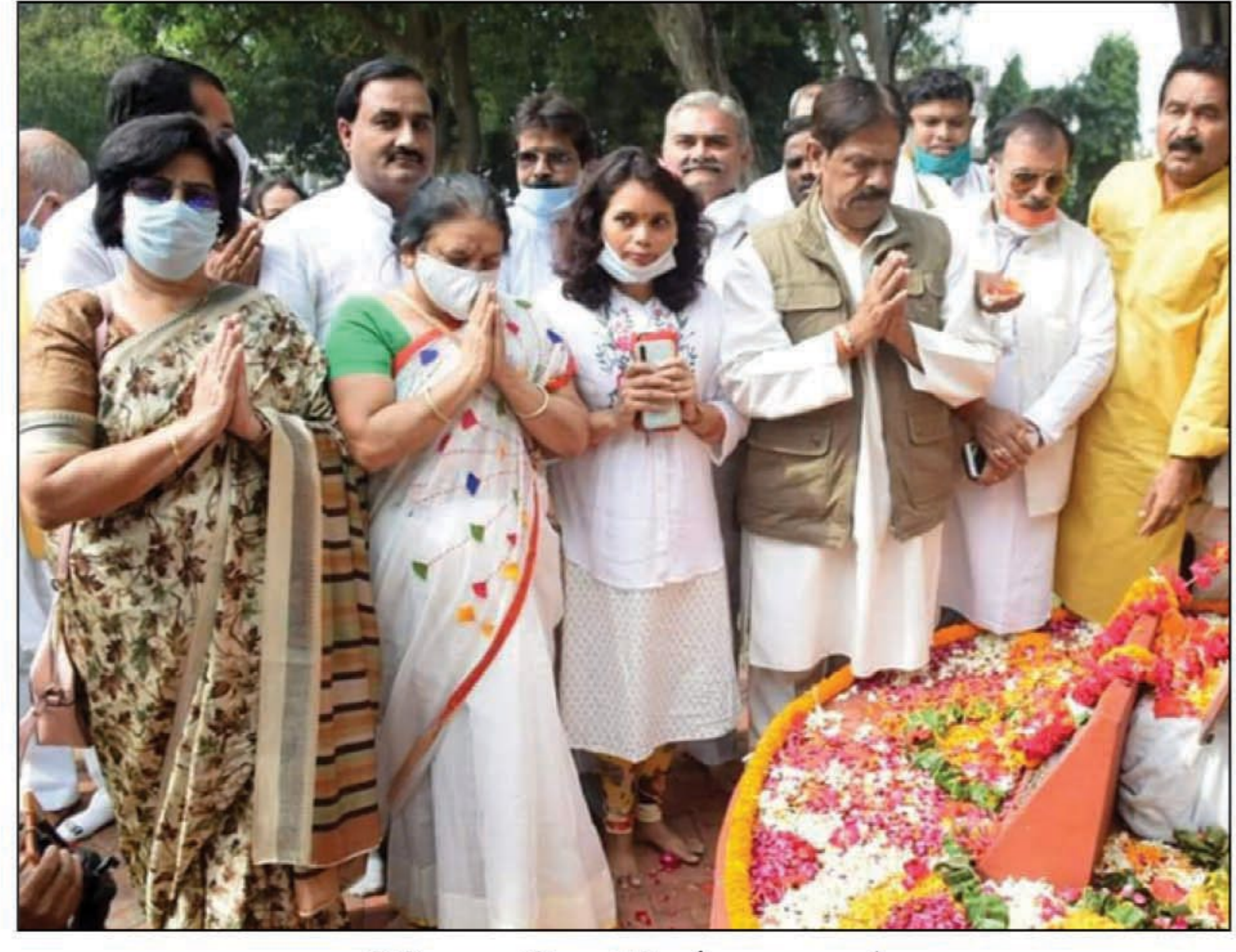
पुण्यतिथि पर इंदिरा गांधी को नमन करते हुए