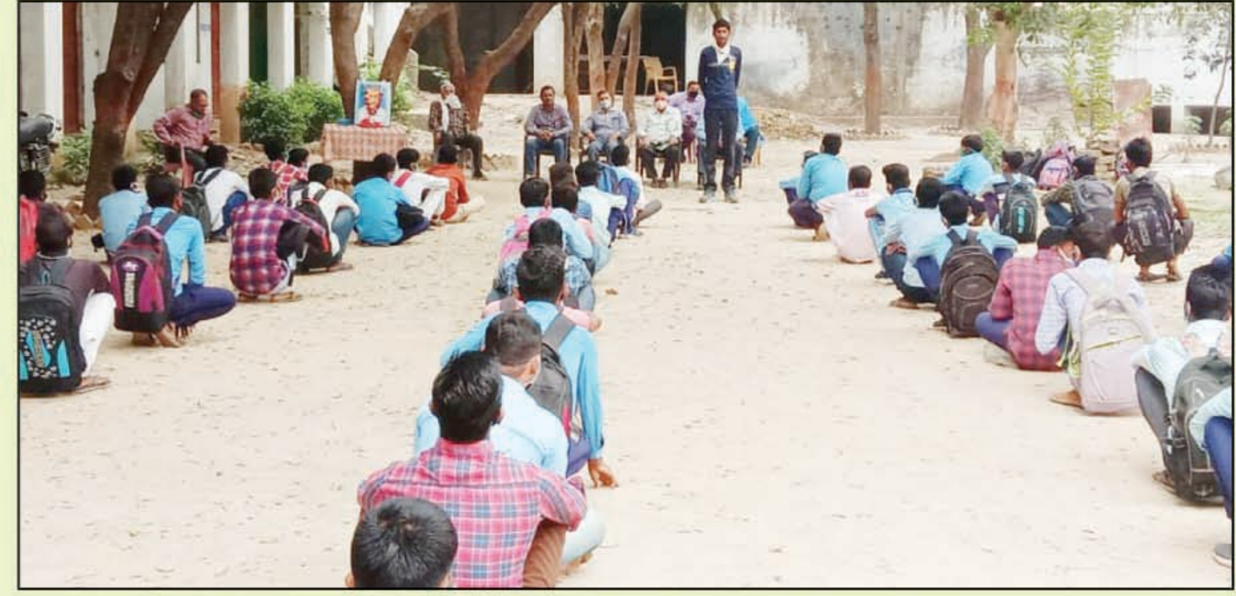
बच्चों को सरदार पटेल के बारे में बताते अध्यापकगण