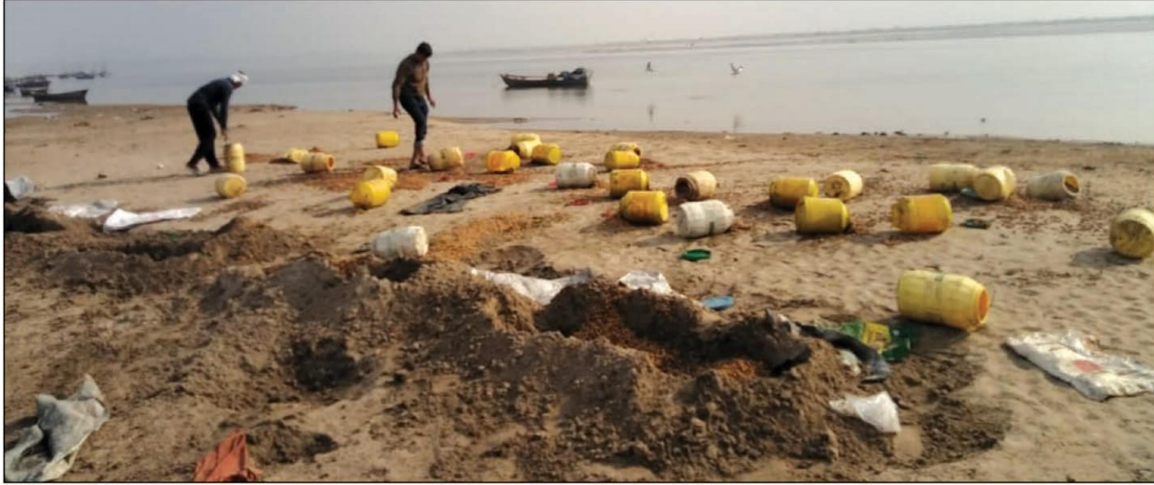
अवैध शराब व लहन नष्ट करते हुए