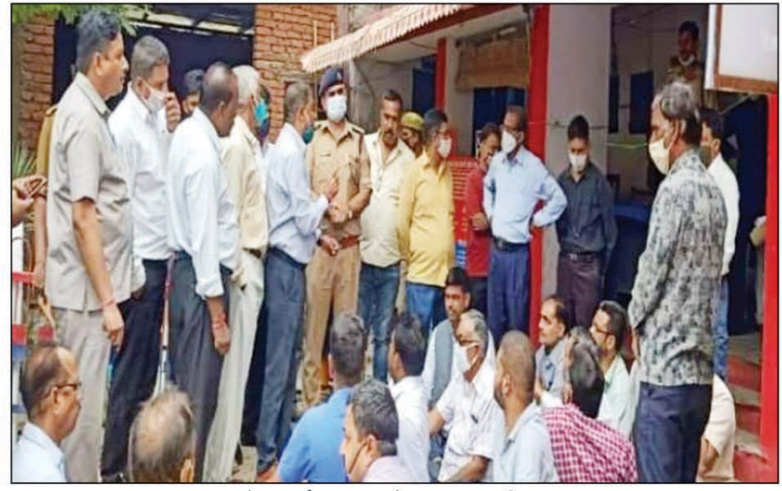
थाने का घेराव करते नाराज अधिवक्ता

प्रयागराज। पुलिस की कार्रवाई से नाराज होकर शनिवार को अधिवक्ता धूमनगंज थाना परिसर के अंदर धरना पर बैठ गए। थाने में अधिवक्ताओं की संख्या बढ़ने लगी अधिवक्ता हंगामा भी करने लगे। जब इसकी जानकारी पुलिस विभाग के आला अधिकारियों को हुई तो विभाग में खलबली मच गई मौके पर पहुंचे सीईओ तब पुलिस के अधिकारियों ने किसी तरह अधिवक्ताओं को समझा-बुझाकर मामला शांत पुलिस के मुताबिक प्रीतम नगर इलाके में कुछ युवकों ने एक लड़की का पीछा किया था। इसके बाद लड़की के मुहल्ले में बमबाजी की भी घटना हुई थी। इस मामले की जांच हुई तो कुछ युवकों का नाम प्रकाश में आया। शनिवार सुबह एक युवक को पुलिस ने पकड़ लिया और