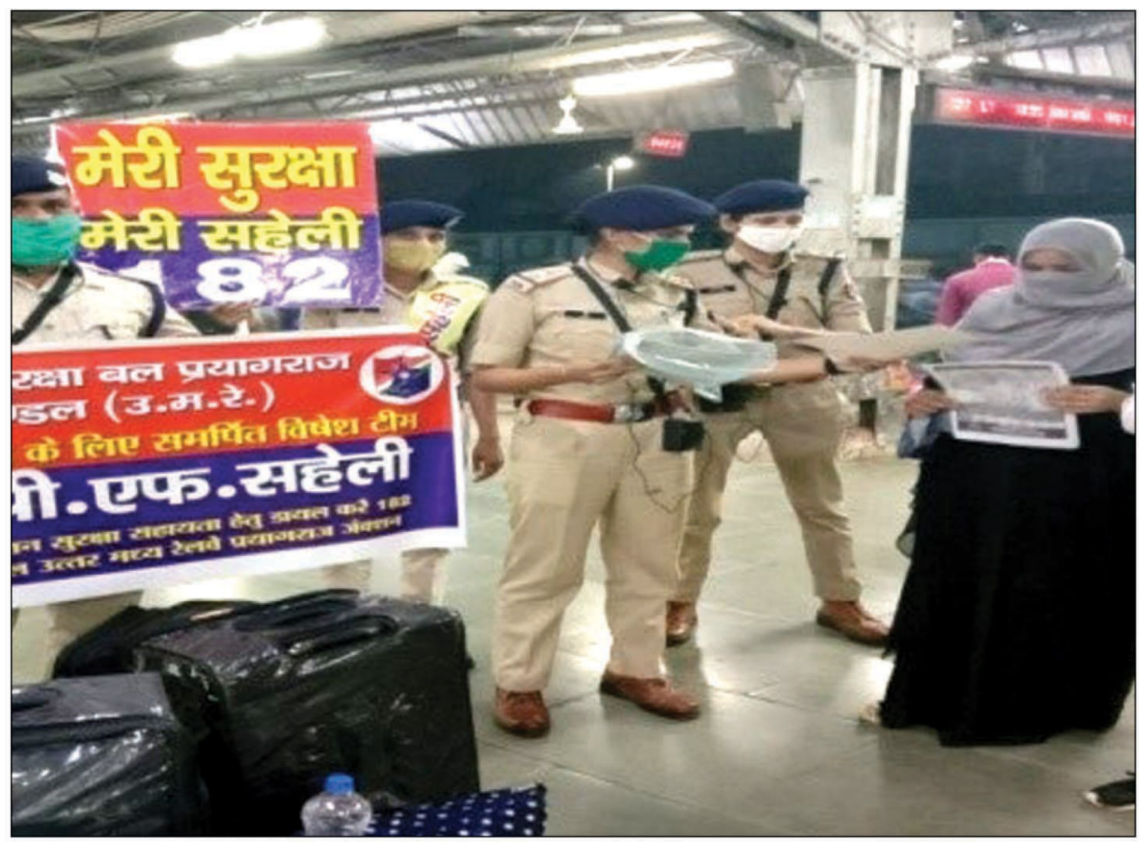
स्टेशन पर महिला यात्रियों को जागरूक करते हुए

इस कार्यक्रम के तहत दिनांक 25 अक्टूबर से अबतक उत्तर मध्य रेलवे में संचालित होने वाली 8 प्रारंभिक ट्रेनों एवं 67 पासिंग ट्रेनों में सतत अभियान चलाया जा रहा है। इसके लिए 121 सुरक्षा कर्मियों की 27 टीमों गठित की गई हैं। गंतव्य स्टेशन पर रेल सुरक्षा बल की टीमों चिन्हित महिला यात्रियों से फीडबैक भी एकत्र करती हैं और इन प्रतिक्रियाओं का विश्लेषण किया जाता है। इन फीडबैक के विश्लेषण के आधार पर यदि कोई सुधार वांछित हो तो सुधारात्मक कार्रवाई की जाती है। इसके अतिरिक्त यदि मेरी सहेली पहल के तहत कवर की गई ट्रेन से कोई डिस्ट्रेस कॉल आती है, तो कॉल के निराकरण की निगरानी वरिष्ठ अधिकारियों के स्तर पर की जाती है। मेरी सहेली पहल को महिला यात्रियों से उत्साहजनक प्रतिक्रिया मिल रही है।