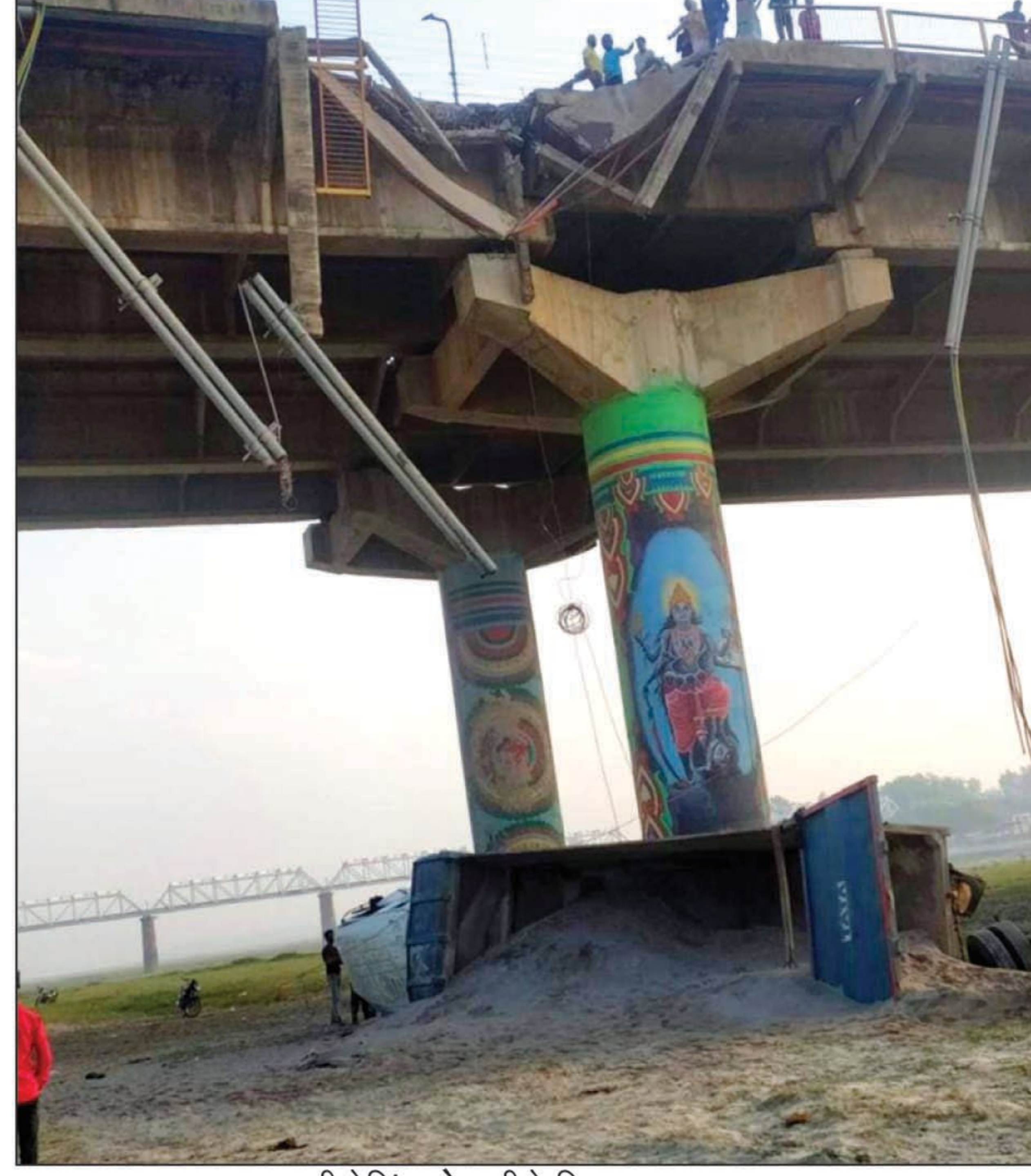
पुल की रेलिंग तोड़ नीचे गिरा डम्पर का दृश्य

झूंसी प्रयागराज। बालू लदा डंपर शनिवार तड़के शास्त्री पुल की रेलिंग तोड़ते हुए नीचे गिर गई। इस घटना से शास्त्री पुल पर हड़कंप मच गया। लोगों ने पुलिस को सूचना दी। झूंसी और दारांगंज पुलिस मौके पर पहुंच गई। गाड़ी के नीचे गिरने से परखचे उड़ गए थे। पुलिस ने बताया कि ट्रक चालक और उसके दो साथियों को गंभीर हालत में अस्पताल में भर्ती कराया गया है। तीनों का इलाज चल रहा है। वे सुरक्षित हैं। वहीं इस घटना के बाद शास्त्री पुल पर लोगों की भीड़ जुट गई। शास्त्री पुल पर सैकड़ों की संख्या में मॉनिंग वॉक के लिए लोग निकलते थे। वही मॉनिंग वॉक पर निकले एक व्यक्ति ने बताया कि रेलिंग तोड़ते हुए ट्रक नीचे गिरने से पहले इस रास्ते से करीब 20 लोग गुजर गए थे। घटनास्थल पर लोग गाड़ी व टूटी हुई रेलिंग को फोटो तथा वीडियो बनाकर सोशल मीडिया पर वायरल करते रहे। पुलिस से बात करने पर पता चला कि चालक को सुबह गाड़ी चलाते वक्त झपकी आ गई थी जिससे वह अनियंत्रित होकर रेलिंग तोड़ते हुए अपने विपरीत दिशा में शास्त्री पुल के नीचे जा गिरी।