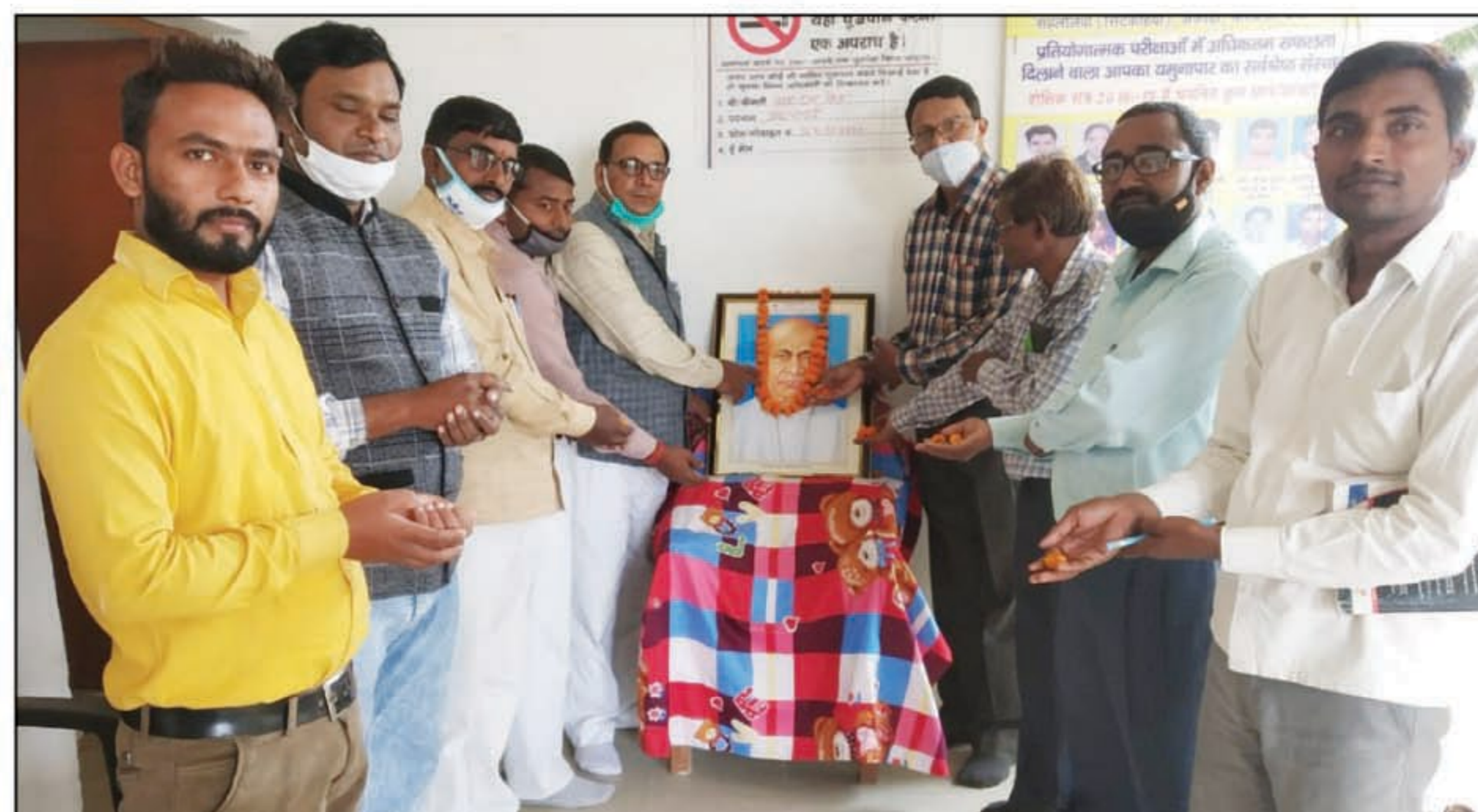
सरदार पटेल की जयंती मनाते लोग