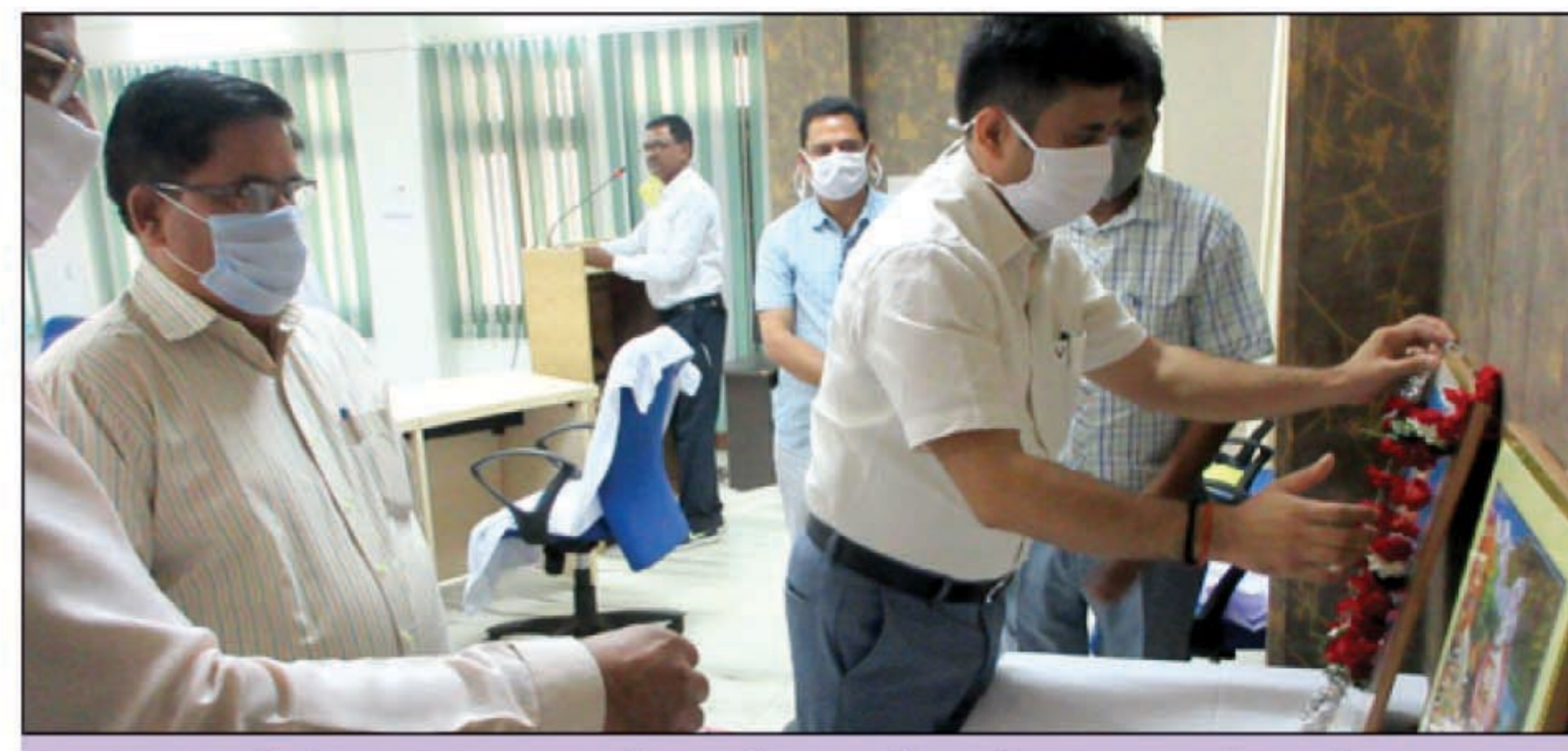
जयंती के अवसर पर उपस्थित जिला अधिकारी व अन्य अधिकारी गण