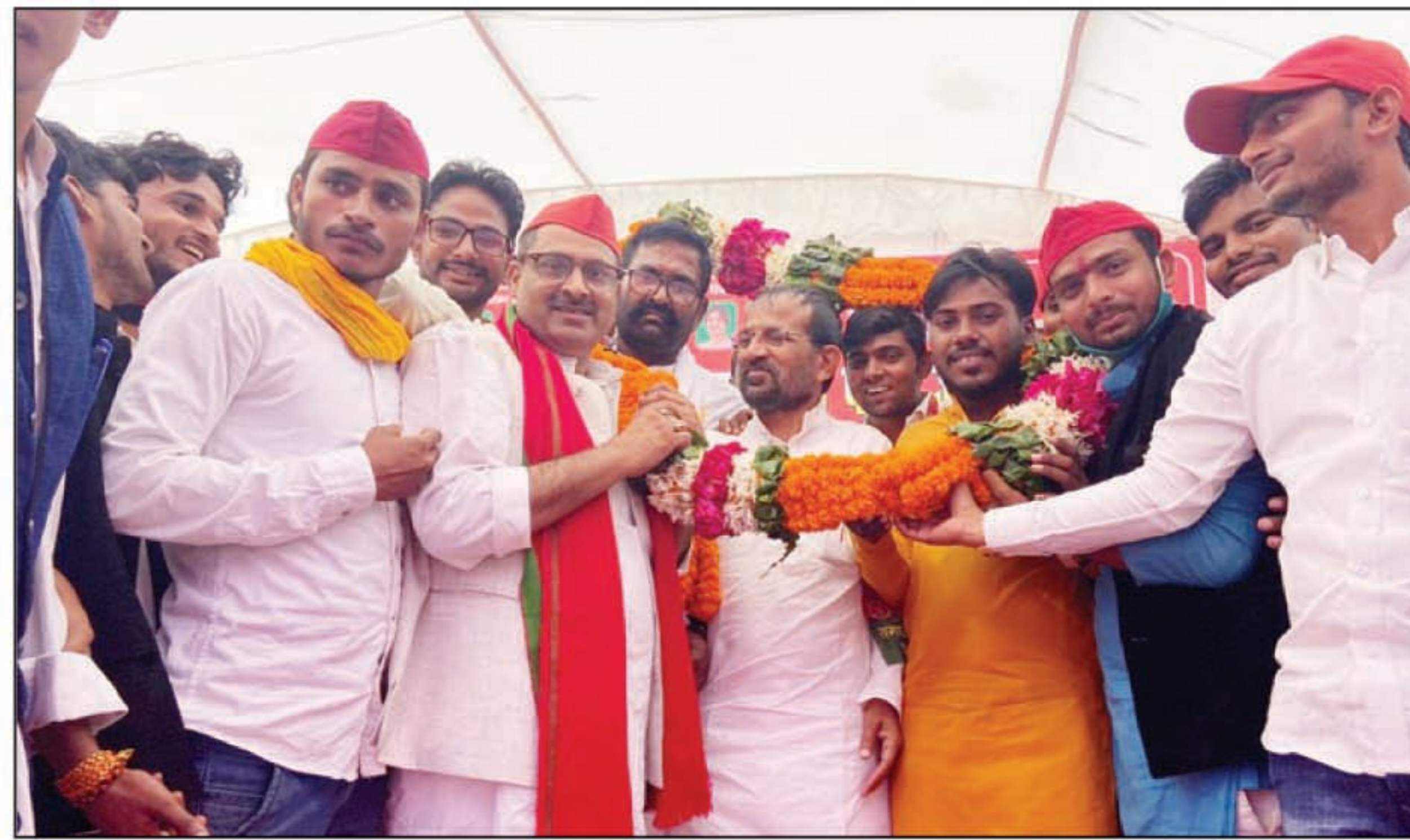
सरदार पटेल जयंती कार्यक्रम में मुख्य अतिथि का माला पहनाकर स्वागत करते लोग

सिरसा। विधानसभा मेजा क्षेत्र में ग्राम पंचायत सोनाई उचडीह बस स्टॉप के नजदीक शनिवार को भारत रत्न लौह पुरुष सरदार पटेल की जयंती बड़े धूमधाम से समाजवादी पार्टी के कार्यकर्ताओं ने मनाया। कार्यक्रम में लौह पुरुष सरदार पटेल की जीवन और कार्यशैली पर चर्चा की गई और उनके जीवन पर प्रकाश डाला गया। कार्यक्रम की शुरुआत उनकी प्रतिमा पर माल्यार्पण कर दीप प्रज्वलित कर उन्हें नमन करते हुए की गई। समाजवादी पार्टी द्वारा आयोजित पटेल जयंती कार्यक्रम के मुख्य अतिथि पूर्व छात्र संघ अध्यक्ष इलाहाबाद विश्वविद्यालय पूर्व