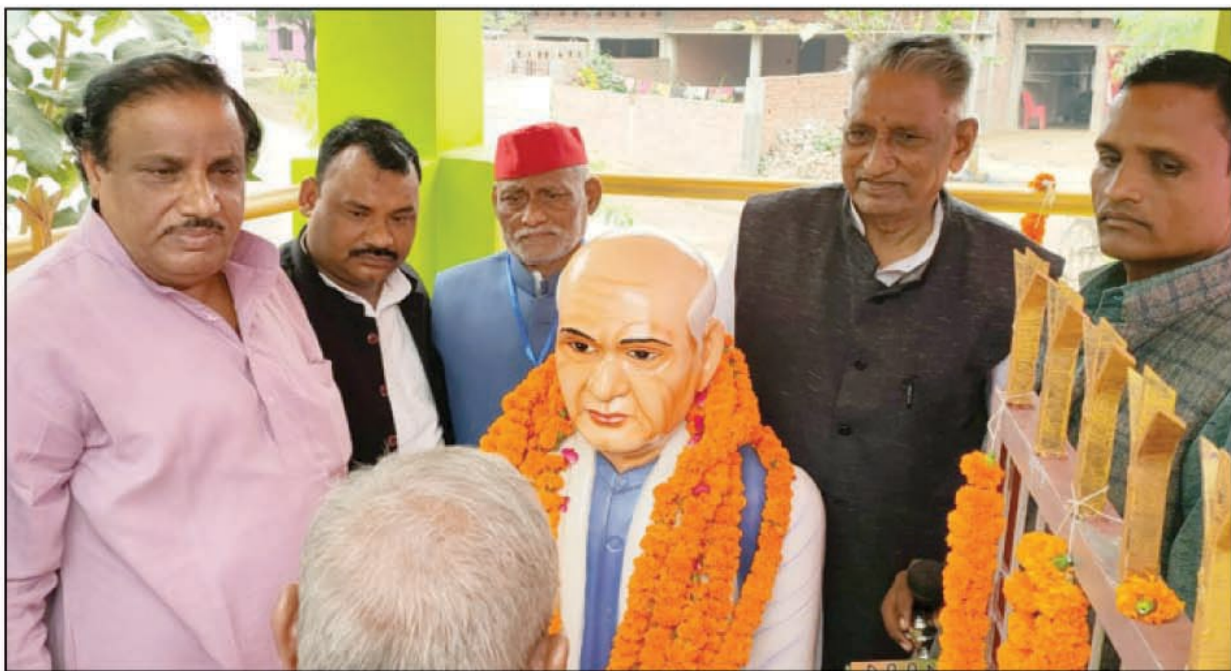
सरदार पटेल की प्रतिमा पर माल्यार्पण कर नमन करते लोग व कार्यक्रम में उपस्थित लोग