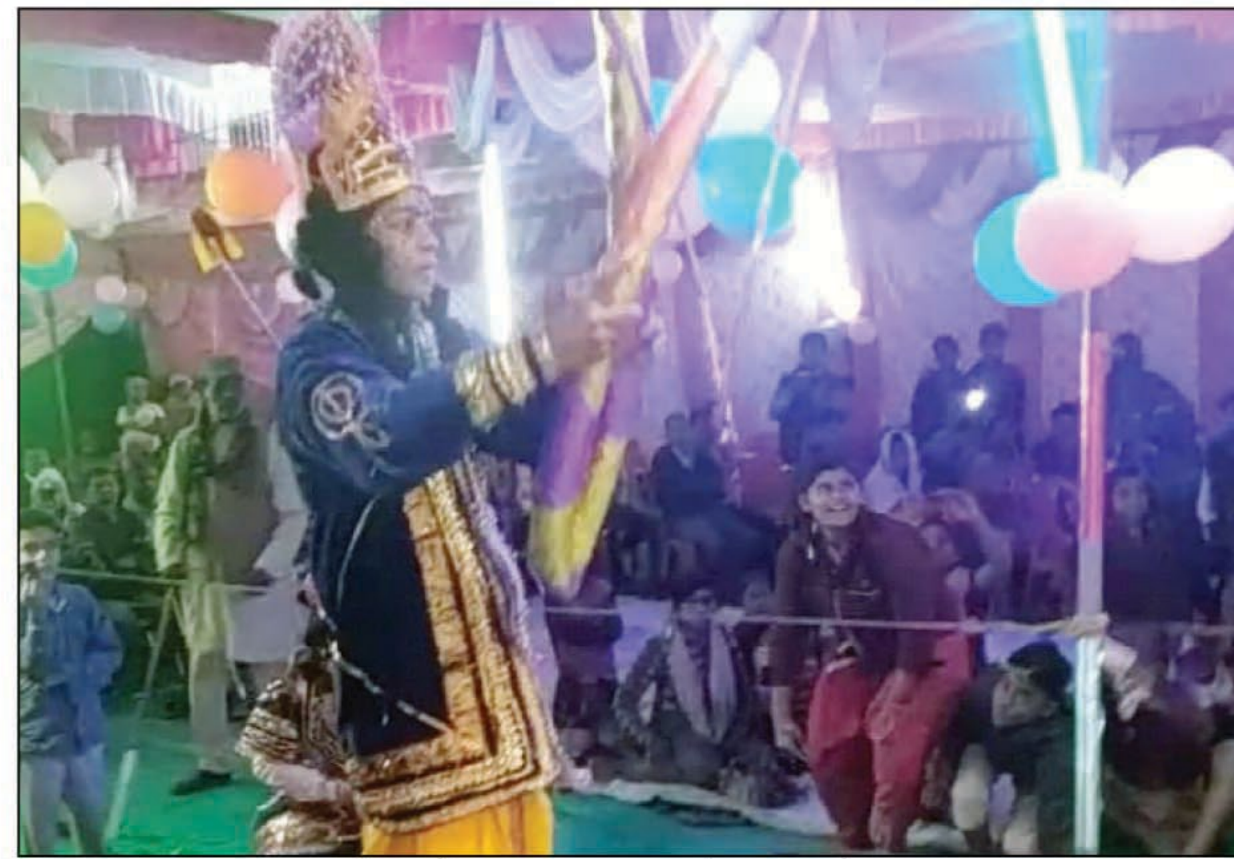
रामलीला में धनुष यज्ञ का मंचन करते कलाकार

करछना। क्षेत्र के देवरी कला में चल रही पंचदिवसीय रामलीला का समापन शुक्रवार देर रात धनुषयज्ञ की रामलीला के साथ हुआ। महाराजा जनक द्वारा सीता की वरण को लेकर सजाई गई मखशाला में देश देशान्तर के राजा धनुष भंग करने को पहुंचे जहां दरबार में मुनि विश्वामित्र के साथ मंच पर विराजमान राम लक्ष्मण की अद्भुत झंझों ने सभी को मंत्रमुग्ध कर दिया। रावण और बाणासुर समेत सभी राजाओं ने धनुष तोड़ने का प्रयास किया किन्तु तोड़ना तो दूर धनुष को कोई हिला तक नहीं सका। यह दृश्य देखकर महाराज जनक चिंतित हो बोल पड़े, हे देश देश के राजागण हम किस कहे बलशाली है, मुझको तो यह विश्वास हुआ पृथ्वी वीरों से खाली है विदेह राज की बढ़ती चिंता को देख