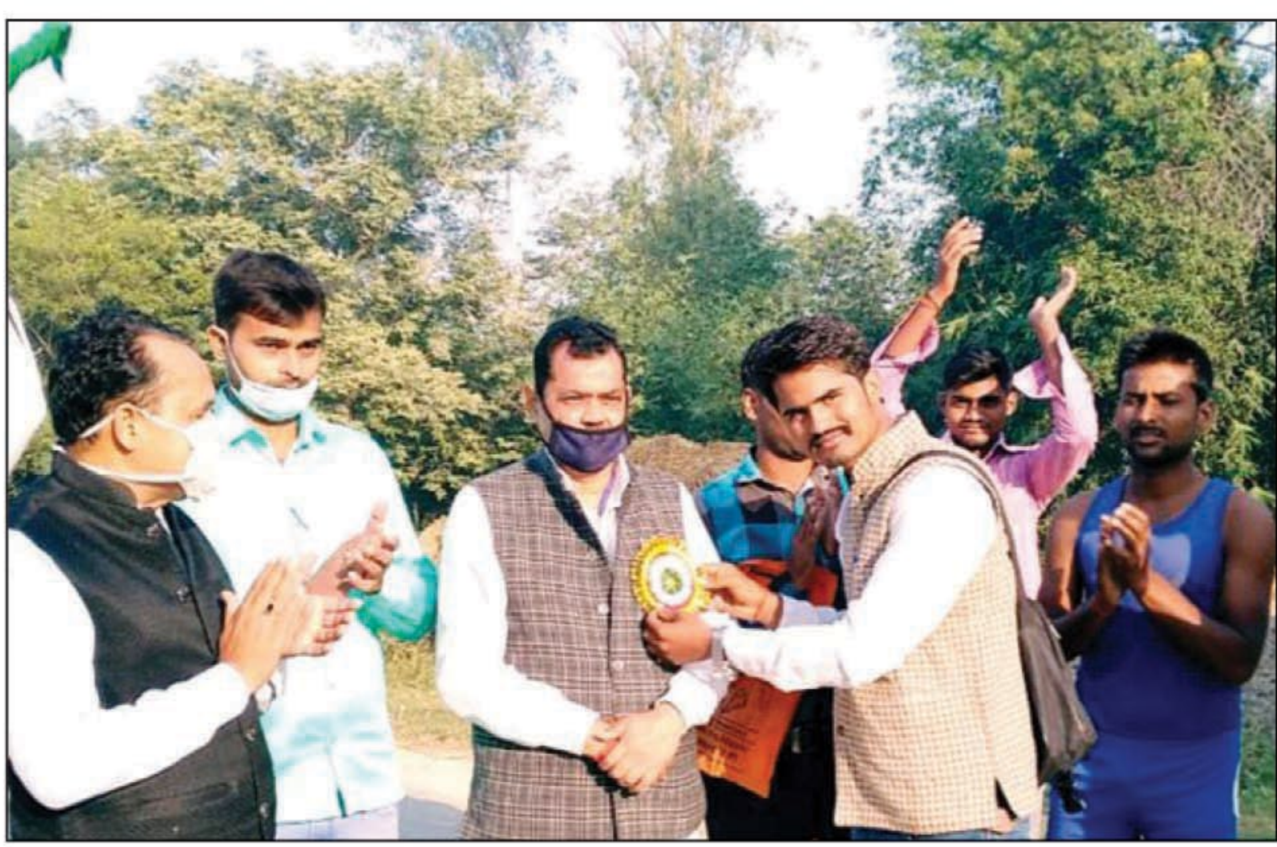
लौह पुरुष का जन्मदिवस मनाते