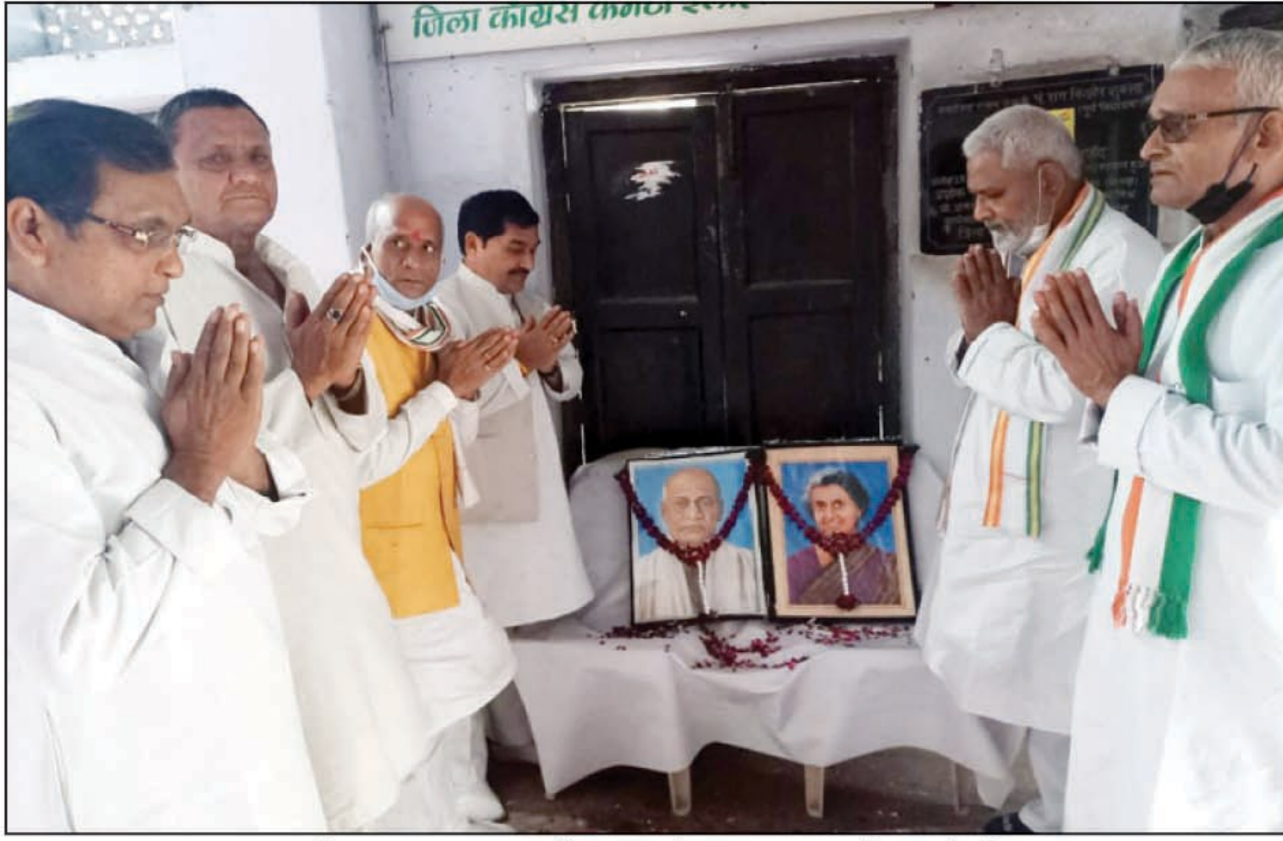
प्रतिमा पर माल्यार्पण करते नमन करते कांग्रेसी