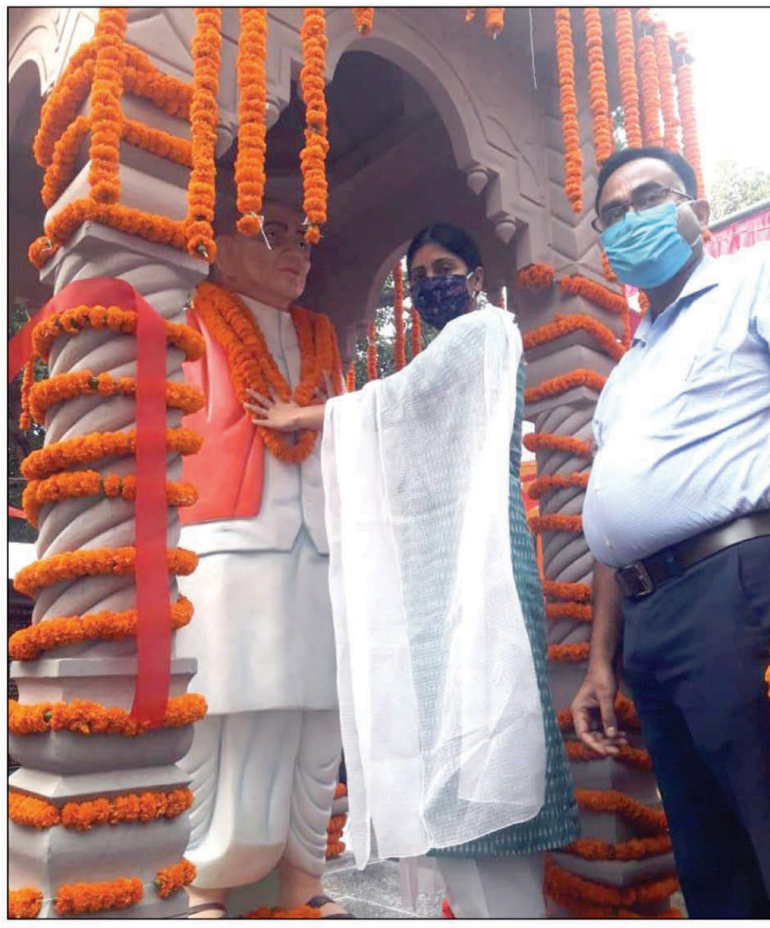
सरदार बल्लभ भाई पटेल की मूर्ति का अनावरण करती सांसद अनुप्रिया पटेल

कौशाम्बी। जिले के बाकरगंज के एक कालेज परिसर में सरदार बल्लभ भाई पटेल की मूर्ति का अनावरण करने के बाद अपना दल की राष्ट्रीय अध्यक्ष सांसद अनुप्रिया पटेल ने कहा कि सशक्त राष्ट्र का निर्माण आधुनिक भारत के शिल्पकार लौह पुरुष सरदार बल्लभ भाई पटेल ने किया है उन्होंने कहा कि निर्भीकता निडरता के साथ सरदार बल्लभ भाई पटेल ने 562 देसी रियासतों को आजाद भारत में शामिल करा दिया है उपस्थित लोगों को संबोधित करते हुए सांसद अनुप्रिया पटेल ने कहा कि सरदार बल्लभभाई पटेल के आदर्शों और विचारों से सीख