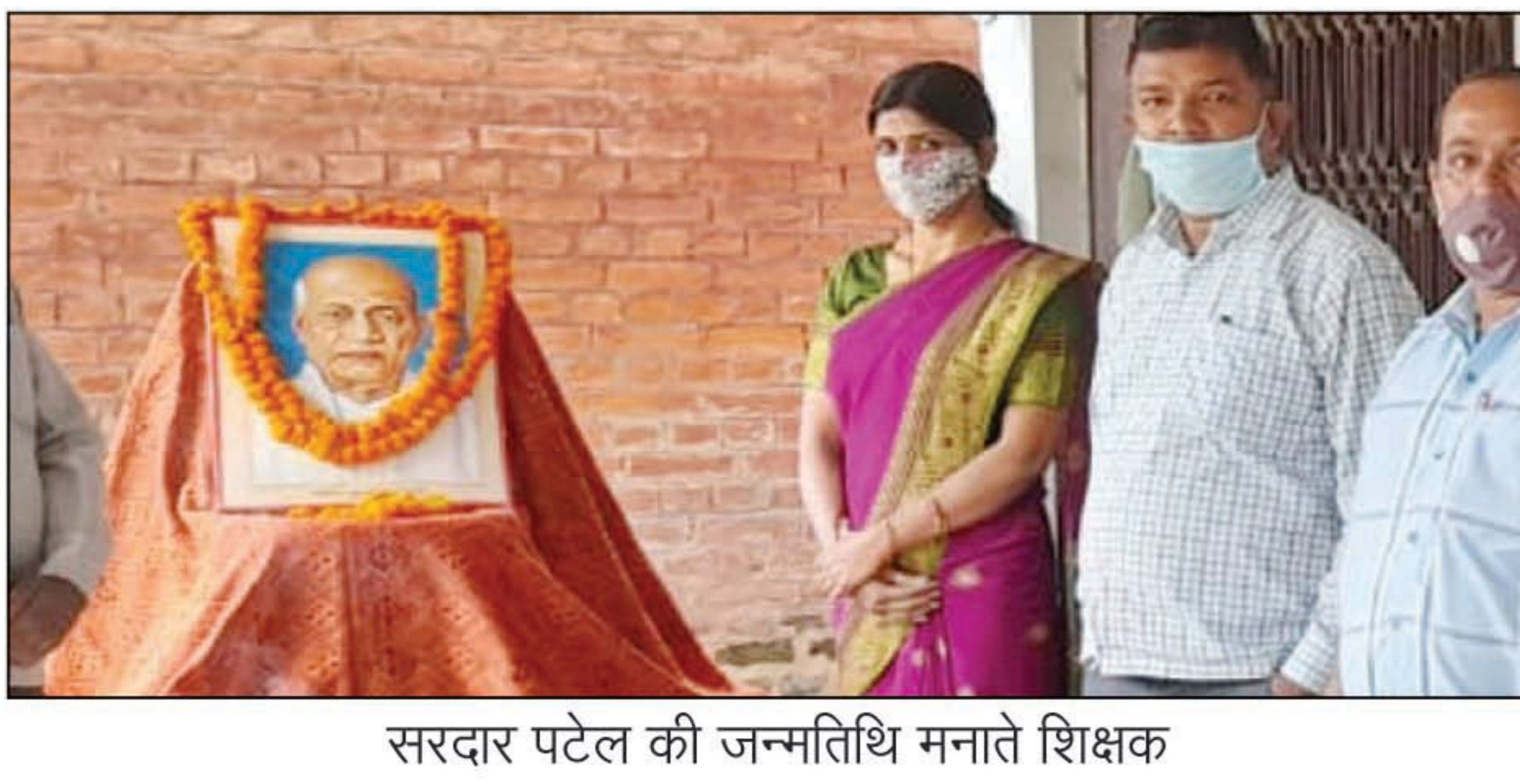
सरदार पटेल की जन्मतिथि मनाते शिक्षक