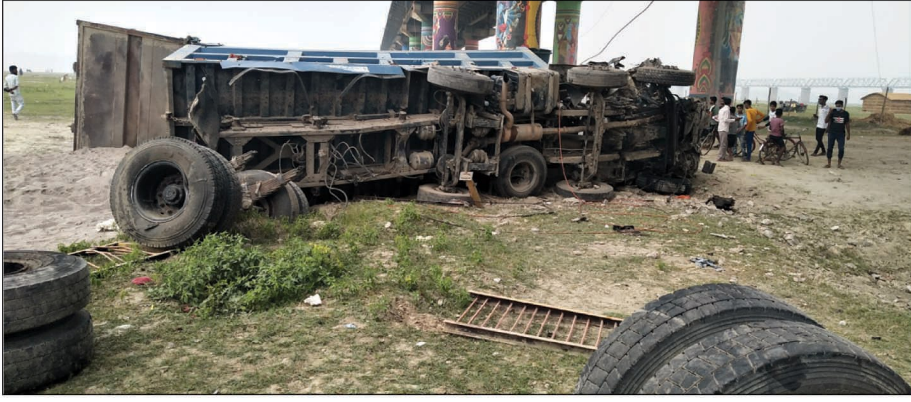
पुलिस से नीचे गिरा डम्पर व टूटकर बिखरा पहिया

झूंसी प्रयागराज। बालू लदा डंपर शनिवार तड़के शास्त्री पुल की रेलिंग तोड़ते हुए नीचे गिर गई। इस घटना से शास्त्री पुल पर हड़कंप मच गया। लोगों ने पुलिस को सूचना दी। झूंसी और दारांगंज पुलिस मौके पर पहुंच गई। गाड़ी के नीचे गिरने से परखचे उड़ गए थे। पुलिस ने बताया कि ट्रक चालक और उसके दो साथियों को गंभीर हालत में अस्पताल में भर्ती कराया गया है। तीनों का इलाज चल रहा है। वे सुरक्षित हैं। वहीं इस घटना के बाद शास्त्री पुल पर लोगों की भीड़ जुट गई। शास्त्री पुल पर सैकड़ों की संख्या में मॉनिंग वॉक के लिए लोग निकलते थे। वही मॉनिंग वॉक पर निकले एक व्यक्ति ने बताया कि रेलिंग तोड़ते हुए ट्रक नीचे गिरने से पहले इस रास्ते से करीब 20 लोग गुजर गए थे। घटनास्थल पर लोग गाड़ी व टूटी हुई रेलिंग को फोटो तथा वीडियो बनाकर सोशल मीडिया पर वायरल करते रहे। पुलिस से बात करने पर पता चला कि चालक को सुबह गाड़ी चलाते वक्त झपकी आ गई थी जिससे वह अनियंत्रित होकर रेलिंग तोड़ते हुए अपने विपरीत दिशा में शास्त्री पुल के नीचे जा गिरी।