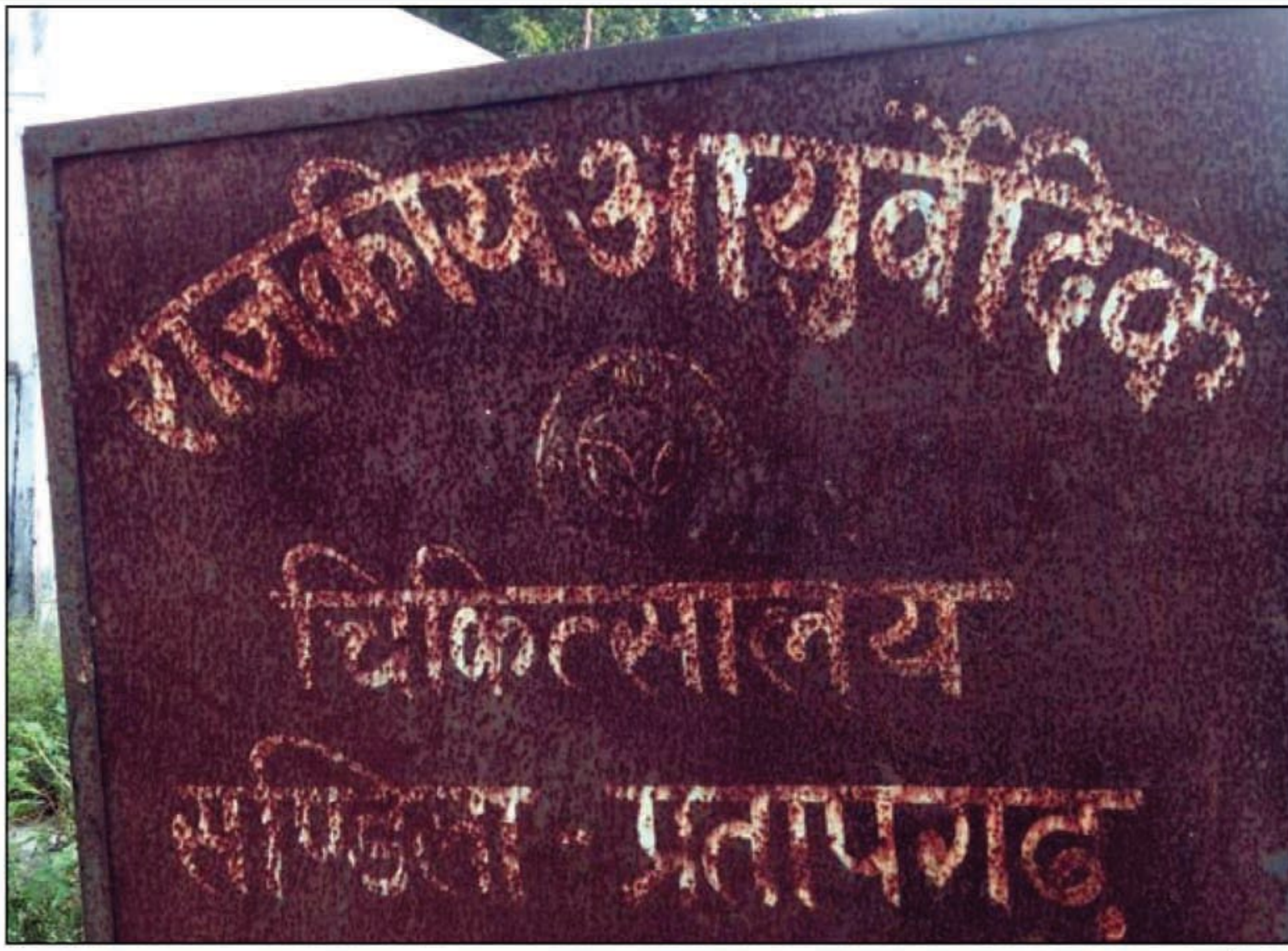
चिकित्सालयों में व्यवस्था चरमराई

प्रतापगढ़। जिले के बेलगाम हो चुके अधिकारी न तो जिले के हाकिम के आदेशों में रहे हैं और न ही जनप्रतिनिधियों की शिकायतों को सुनने को तैयार हैं ऐसे हालात में जिले की प्रशासनिक व्यवस्था पूरी तरह चरमराने लगी है। इसका उदाहरण रानीगंज क्षेत्र में संचालित पशु चिकित्सालय व आयुर्वेदिक चिकित्सालय से लिया जा सकता है। उक्त दोनों चिकित्सालयों से संबंधित शिकायती पत्र क्षेत्रीय लोगों ने सांसद प्रतापगढ़ को देकर आरोप लगाया कि पशु चिकित्सालय में तैनात चिकित्सक अधिकतर चिकित्सालय से गायब रहती है। चिकित्सालय का संचालन चिकित्सालय के चतुर्थ श्रेणी के एक कर्मचारी द्वारा किया जा रहा है। इसी तरह आयुर्वेदिक चिकित्सालय संडीला, रानीगंज में एक महिला चिकित्सक की तैनाती है किंतु वह भी सप्ताह में कभी कभी दिखाई देती है उक्त चिकित्सालयों में तैनात चतुर्थ श्रेणी के कर्मचारी को अधिकतर दूसरी