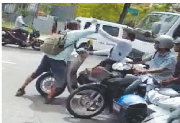
हैं। उन्होंने स्कूटर को छोड़ सड़क पर पैदल भागकर अपनी जान बचाई। इस हमले के बाद (जेपी) के प्रवक्ता भी हैं, जो राष्ट्रपति इब्राहिम सोलिह की सत्तारूढ़ मालदीवियन डेमोक्रेटिक

मौका नहीं मिला। हमले में मंत्री को हाथ और चेहरे पर चोटें आईं