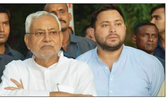
के विधायकों से कहा कि स्थानीय नेताओं से उनकी कोई शिकायत नहीं है। नीतीश कुमार ने भाजपा विधायकों की तरफ इशारा करते हुए कहा कि हमको आप लोगों से कुछ शिकायत नहीं है। हम आप लोगों पर कुछ कह रहे हैं। हमसे कहा गया था कि नंद किशोर यादव को अध्यक्ष बनाएंगे, लेकिन नहीं बनाया। 2005 में क्या वोट आया

पटना: बिहार के मुख्यमंत्री नीतीश कुमार ने विधानसभा में विश्वास मत पर चर्चा के दौरान भाजपा के केंद्रीय नेतृत्व पर जमकर निशाना साधा। उन्होंने अटल बिहारी वाजपेयी का जिक्र करते हुए कहा कि अब भाजपा पहले वाली नहीं रही। अब भाजपा में ऐसे लोग हैं, जो कोई काम नहीं करते, केवल झूठ प्रचार करते हैं। इन लोगों को केवल झूठ बोलना है। उन्होंने विधानसभा में बैठे भाजपा के विधायकों को कहा कि वे उनके खिलाफ खूब बोलें, तभी भाजपा का केंद्रीय नेतृत्व उन्हें आगे बढ़ाएगा। नीतीश कुमार ने भाजपा