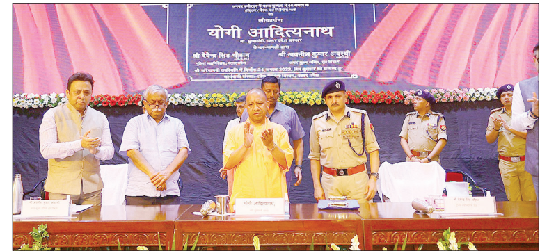
कहा कि उत्तर प्रदेश पुलिस दुनिया का सबसे बड़ा पुलिस बल है, लेकिन पूर्ववर्ती सरकारों ने इसके आधुनिकरण की दिशा में कोई कार्य नहीं किया बल्कि प्रदेश में पीएस की 54 कंपनी समाप्त कर दी थी। प्रदेश में एक भी महिला बटालियन और एसडीआरएफ का गठन नहीं किया। हमारी सरकार ने इस दिशा में कार्य करते हुए प्रदेश में एएसएफ, तीन महिला बटालियन और एसडीआरएफ की तीन बटालियन का गठन किया। उन्होंने कहा कि 24 से 25 करोड़ की आबादी के हिसाब से प्रदेश में डेढ़ लाख पुलिस बल

लखनऊ: मुख्यमंत्री योगी आदित्यनाथ ने कहा कि पांच साल पहले उत्तर प्रदेश की गिनती देश के बीमार राज्यों में होती थी। विकास की कोई सोच नहीं थी। कानून व्यवस्था बदतर थी। आप दिन प्रदेश में दंगे होते थे। प्रदेश में व्यापारी, महिला, नौकरी पेशा, किसान, श्रमिक अपने आप को सुरक्षित महसूस नहीं करते थे। 2017 में हमारी सरकार बनने के बाद जब मैंने 20 मार्च को गृह विभाग का निरीक्षण किया तो धूल से सनी फाइलों का ढेर था। इसके बाद हमारी सरकार ने पुलिस के आधुनिकीकरण की दिशा में कदम बढ़ाया और इसके लिए छह हजार करोड़ रुपये का बजट जारी किया। इससे सेफसिटी और सीसीटीएमएस प्रोजेक्ट को बढ़ावा मिला। मुख्यमंत्री योगी बुधवार को राजधानी में 260.02 करोड़ रुपये की लागत से तैयार हुई पुलिस की 144 आवासीय और अनावासीय परियोजनाओं के लोकार्पण के अवसर पर पुलिस कर्मियों को संबोधित कर रहे थे। इस दौरान उन्होंने