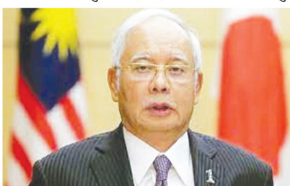
फैसला नयी सत्तारूढ़ गठबंधन सरकार में नजीब की मलय पार्टी के बड़े सहयोगी के रूप में शामिल होने के छह महीने बाद आया है। अरबों डॉलर के घोटाले को लेकर जनता के गुस्से के कारण 2018 में नजीब की पार्टी को सत्ता से बाहर होना पड़ा था। यह फैसला राजनीतिक परिवारों में से एक के वंशज नजीब, पांच अलग-अलग मुकदमों में 42 आरोपों का सामना कर रहे हैं और दोषी पाए जाने पर उन्हें वर्षों जेल में बिताना पड़ सकता है। नजीब के पिता और चाचा देश के दूसरे और तीसरे प्रधानमंत्री रहे थे।

अदालत की इस विशेष पीठ ने नजीब की सजा को बरकरार रखने का फैसला सुनाया। यह नजीब के खिलाफ भ्रष्टाचार के पांच मुकदमों में से एक में आया है। मलेशिया के सबसे प्रमुख