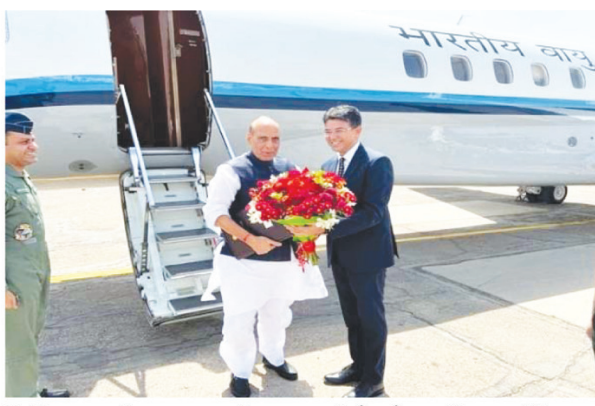
किर्गिजस्तान के राष्ट्राध्यक्ष हिस्सा लेंगे। उससे पहले ताशकंद में इन देशों के रक्षा मंत्रियों की बैठक हो रही है। बैठक में भाग लेने भारत के रक्षा मंत्री राजनाथ सिंह ताशकंद पहुंचे। वहाँ उन्होंने

ताशकंद। भारत के रक्षा मंत्री राजनाथ सिंह शंघाई सहयोग संगठन के रक्षा मंत्रियों की बैठक में हिस्सा लेने के लिए उज्बेकिस्तान की राजधानी ताशकंद पहुंचे हैं। उज्बेकिस्तान के रक्षा मंत्री लेफ्टिनेंट जनरल बखोदिन कुर्बानोव ने हवाई अड्डे पर उनका स्वागत किया। शंघाई सहयोग संगठन के राष्ट्राध्यक्षों का शिखर सम्मेलन अगले माह 15 व 16 सितंबर को समरकंद में प्रस्तावित है। इस शिखर सम्मेलन में भारत, रूस, चीन, पाकिस्तान, कजाखस्तान, उज्बेकिस्तान, ताजिकिस्तान और