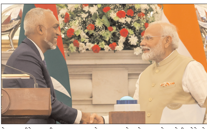
के समय पीने का पानी उपलब्ध कराना हो, भारत ने हमेशा अपने पड़ोसी होने के दायित्व को निभाया है। हमने मुक्त व्यापार

मालदीव भारत ने सदैव मालदीव के लिए फर्स्ट रिसपॉन्डर की भूमिका निभाई है। चाहे मालदीव के लोगों के लिए जरूरी वस्तुओं की जरूरत पूरा करना हो, प्राकृतिक आपदा के समय पीने का पानी उपलब्ध कराना हो, कोविड के समय वैक्सीन देने की बात हो, भारत ने हमेशा अपने पड़ोसी होने के दायित्व को निभाया है। प्रधानमंत्री नरेंद्र मोदी और मालदीव के राष्ट्रपति मोहम्मद मुड़ज्जू ने मालदीव में हनीमाधू अंतर्राष्ट्रीय हवाई अड्डे के रनवे का वरुंचल माध्यम से उद्घाटन किया। पीएम मोदी ने इस दौरान कहा कि भारत और मालदीव के संबंध सदियों पुराने हैं। भारत मालदीव का सबसे करीबी पड़ोसी और