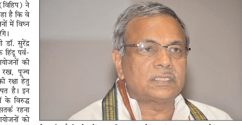
से प्रार्थना है कि वे हमें वह शक्ति प्रदान करें, जिससे हम राष्ट्र विरोधियों और हिंदू विरोधियों के षड्यंत्रों को समाप्त कर भारत को विश्व का शीर्षस्थ देश बनाने का अपना संकल्प पूरा कर सकें। उन्होंने कहा कि हिंदू समाज की विशेषता है कि उसके उत्सव विभिन्न रंगों की छटाओं से भरे होते हैं। डांडिया नृत्य मां दुर्गा की