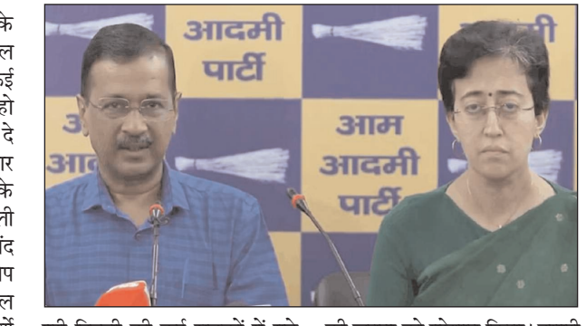
पूरी दिल्ली की कई सड़कों में गड्ढे दिखाई दे रहे हैं। अरविंद केजरीवाल ने कहा, "मेरे जेल जाने के बाद भाजपा ने दिल्ली की जनता को परेशान किया। हमारी सरकार के काम रोकें। भाजपा के लोगों ने सड़कों की मरम्मत का काम भी रुकवा दिया। जेल से

नई दिल्ली। दिल्ली सरकार के पूर्व मुख्यमंत्री अरविंद केजरीवाल और मुख्यमंत्री आतिशी बीते कई दिनों से दिल्ली की सड़कों पर हो रहे गड्ढों का जायजा लेते दिखाई दे रहे हैं। दिल्ली सरकार ने एक बार फिर सड़कों को गड्ढा मुक्त करने के लिए काम शुरू कर दिया है। दिल्ली सरकार के पूर्व मुख्यमंत्री अरविंद केजरीवाल ने भाजपा पर आरोप लगाते हुए कहा है कि मेरे जेल जाने के बाद विकास के कई कार्यों को रोकने के साथ-साथ भाजपा के लोगों ने सड़क मरम्मत के कार्य को भी रोक दिया था। जिसकी वजह से