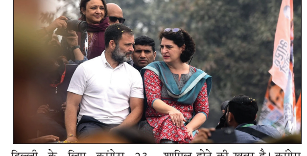
दिल्ली के लिए कांग्रेस 23 अक्टूबर से न्याय यात्रा निकालने की तैयारी में है। इस यात्रा में राहुल गांधी और प्रियंका गांधी के भी शामिल होने की खबर है। कांग्रेस की ये यात्रा चार चरणों में होगी। 23 अक्टूबर से शुरू होकर ये यात्रा 28 नवंबर को समाप्त होगी।

नई दिल्ली। कांग्रेस की इस यात्रा में लगातार 2014, 2019 और 2024 में जीत की हेट्टिक लगाए वाली बीजेपी के सांसदों की असफलता को गिनाया जाएगा। इसके साथ ही कांग्रेस की तरफ से पूर्व सीएम शीला दीक्षित के समय के कार्यकाल की याद दिलाई जाएगी। कांग्रेस ने लोकसभा चुनाव से ठीक पहले अगले साल 14 जनवरी से 30 मार्च के बीच मणिपुर से महाराष्ट्र तक राहुल गांधी की भारत न्याय यात्रा निकाली थी। अब