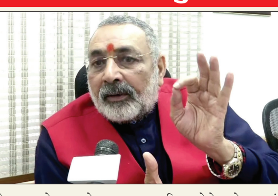
को लागू करने का आरोप लगाया है। गिरिराज सिंह ने अपने बयान में कहा कि आपने देखा होगा झारखंड में एक मुद्दा उठा और उसके बाद

झारखंड गिरिराज सिंह ने अपने बयान में कहा कि आपने देखा होगा झारखंड में एक मुद्दा उठा और उसके बाद कई राज्यों में वही मुद्दा देखने को मिला। झारखंड में हेमंत सोरेन सरकार में इस्लामिक कानूनों का पालन किया जा रहा है। झारखंड में इस साल चुनाव होने है। भाजपा राज्य में अपनी पूरी ताकत लगा दी है। इन सबके बीच केन्द्रीय मंत्री गिरिराज सिंह ने बड़ा दावा किया है। गिरिराज सिंह ने हेमंत सोरेन सरकार पर इस्लामिक कानूनों