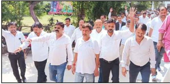
लालगंज तहसील में विरोध प्रदर्शन करते अधिवक्ता।

नाराज वकीलों ने डीएम को संबोधित एसडीएम को ज्ञापन सौंपकर मजिस्ट्रेट्टीयल जांच की मांग उठायी है। इसके पहले अधिवक्ताओं ने संयुक्त अधिवक्ता