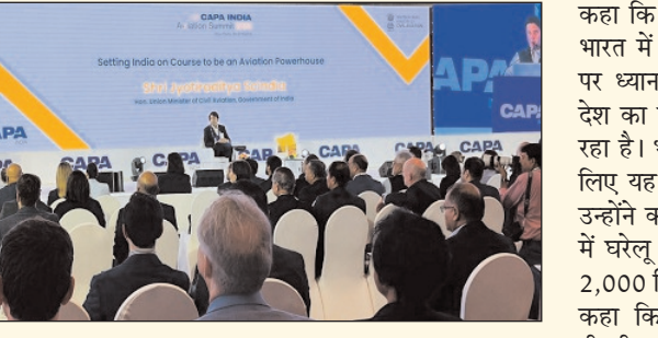
विमानन क्षेत्र की परामर्शदाता कंपनी सीपीएए द्वारा आयोजित एक सम्मेलन में

नई दिल्ली। देश के विमानन क्षेत्र में वृद्धि की संभावनाओं के मद्देनजर भारत को विमानन क्षेत्र के उत्पादों के विनिर्माण पर ध्यान देना चाहिए। पिछले छह साल में यात्रियों की संख्या करीब दोगुनी हो गई है। हम दुनिया में नागरिक उड्डयन बाजार में तीसरे स्थान पर हैं। हमने देश में पिछले 9 साल में एयरपोर्ट की संख्या बढ़ाकर दोगुनी की है। केंद्रीय नागर विमानन मंत्री ज्योतिरादित्य सिंधिया ने यह बात कही है। नागर विमानन मंत्री ने सोमवार को विमानन क्षेत्र की परामर्शदाता कंपनी सीपीएए द्वारा आयोजित एक सम्मेलन में कहा कि अब समय आ गया है कि हमें भारत में एयरोस्पेस उत्पादों के विनिर्माण पर ध्यान देना चाहिए। उन्होंने कहा कि देश का विमानन क्षेत्र बहुत तेजी से बढ़ रहा है। भारत में विनिर्माण शुरू करने के लिए यह पूरी तरह से उपयुक्त समय है। उन्होंने कहा कि अगले पांच से सात वर्ष में घरेलू विमानन कंपनियों के पास कुल 2,000 विमानों का बेड़ा होगा। सिंधिया ने कहा कि 2030 तक हम दुनिया की तीसरी सबसे बड़ी अर्थव्यवस्था बन जाएंगे। देश के नागर विमानन क्षेत्र के लिए परिवेश को बढ़ाने की जरूरत पर जोर देते हुए सिंधिया ने कहा कि इस साल के अंत तक 15 उड़ान प्रशिक्षण संगठनों (एफटीओ) की स्थापना होने के अनुमान है, जिसके साथ इनकी संख्या बढ़कर 50 पर पहुंच जाएगी। ड्रोन क्षेत्र की वृद्धि के बारे में सिंधिया ने कहा कि 2030 तक यह तीन लाख करोड़ रुपये का हो जाएगा और 2.5 लाख रोजगारों का सृजन करेगा।