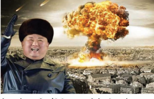
ले जाने वाली बैलिस्टिक मिसाइल को भी दागा गया। राज्य समाचार एजेंसी ने कहा कि अभ्यास का उद्देश्य सहयोगियों के खिलाफ कड़ी चेतावनी भेजने के लिए 'युद्ध प्रतिरोध और परमाणु जवाबी क्षमता' को मजबूत करना

था। किसीएनए ने कहा कि अभ्यास में मॉक न्यूक्लियर वारहेड से लैस एक बैलिस्टिक मिसाइल ने सामरिक परमाणु