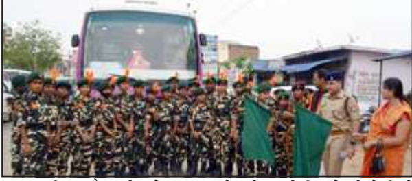
अखण्ड हिन्द फौज की धरोहर यात्रा को हरी झण्डी दिखाते सीओ सिटी

हिन्द फौज के सैनिकों का देश के प्रति समर्पण और देशप्रेम का जज्बा देश के प्रत्येक युवाओं के लिए प्रेरणादायी है। मेला संचालन में सुरक्षा एवं भीड़ नियंत्रण की दृष्टि से समय-समय पर अखंड