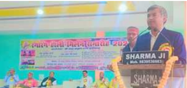
होली मिलन समारोह में बोलते मुख्य अतिथि।