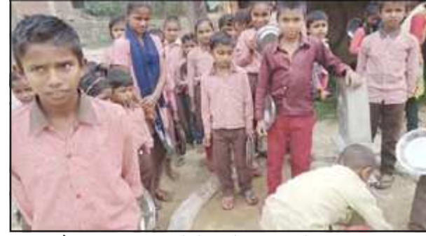
हैण्डपंप पर पानी पीने के लिये लगी बच्चों की भीड़।

अखंड भारत संदेश लालगंज, प्रतापगढ़। क्षेत्र स्थित संविलियन विद्यालय कलापुर के नौनिहाल हलक तर करने के लिए बूंद-बूंद पानी के लिए तरस रहे हैं।