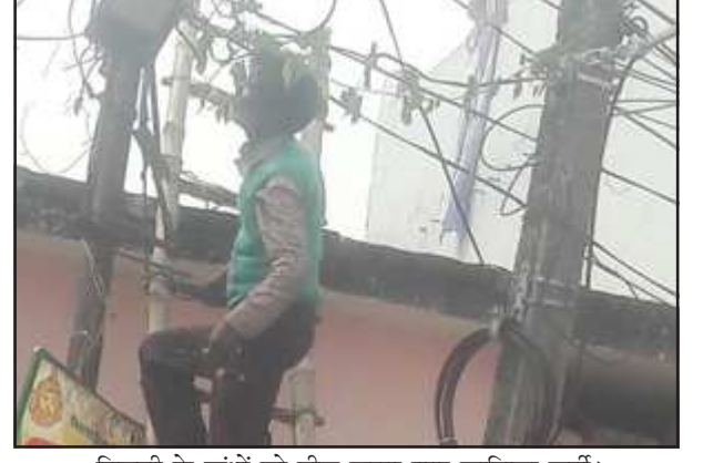
बिजली के खंभों को ठीक करता नगर कालिका कर्मी।