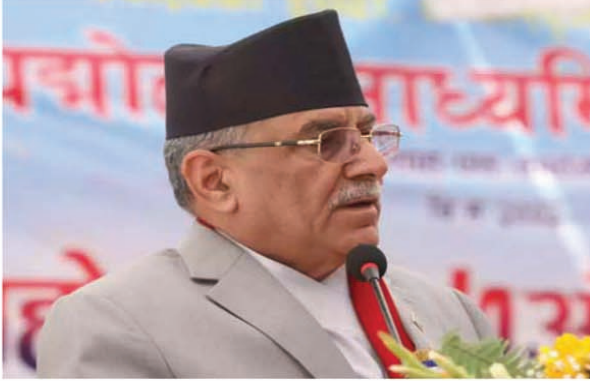
स्वतंत्र पार्टी और राष्ट्रीय प्रजातंत्र पार्टी के सरकार छोड़ने के बाद ये मंत्रालय खाली हो गए थे। अब नेपाली कांग्रेस ने प्रचंड की कैबिनेट में शामिल होने का फैसला लिया है। नेपाली कांग्रेस ने

काठमांडू। नेपाल के प्रधानमंत्री पुष्प कमल दहल प्रचंड दोपहर एक बजे संसद में विश्वास मत हासिल करेंगे। उन्हें नेपाली कांग्रेस, राष्ट्रीय स्वतंत्र पार्टी, जनता समाजवादी पार्टी, सीपीएन (यूएस), लोकतांत्रिक समाजवादी पार्टी, नागरिक उन्मुक्त पार्टी, जनमत पार्टी, राष्ट्रीय जनमोर्चा, आम जनता पार्टी का समर्थन प्राप्त है। इसलिए प्रचंड विश्वास मत हासिल करने को लेकर आश्वस्त हैं। प्रचंड ने विश्वास जताया कि उन्हें 100 फीसदी वोट मिलेंगे। हालांकि, सीपीएन (यूएमएल), आरपीपी और नेपाल मजदूर किसान पार्टी इसके पक्ष में नहीं हैं। प्रचंड ने कहा है कि विश्वास मत हासिल करने के बाद वह मंत्रिमंडल का विस्तार करेंगे। प्रचंड अभी अकेले 16 मंत्रालय संभाल रहे हैं। कम से कम आठ मंत्रालयों पर दावा किया है। सीपीएन (यूएस),