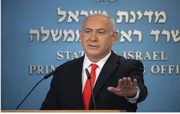
बाइडन ने सुरक्षा समन्वय बढ़ाने, सभी आतंकवादी कृत्यों को निंदा करने और दो-राष्ट्र समाधान की व्यवहार्यता बनाए रखने के लिए सभी पक्षों द्वारा तत्काल सहयोगात्मक कदम उठाने की आवश्यकता पर जोर दिया। व्हाइट हाउस ने कहा कि राष्ट्रपति

कह्रीरा। इस्त्राइल और फलस्तीन आपस में तनाव कम करने के लिए मिस्र में मिले। मिस्र के विदेश मंत्रालय ने बताया कि शर्म-अल-शेख में दोनों पक्षों के बीच लंबी बातचीत हुई, ताकि मौजूदा तनावपूर्ण स्थिति को संभाला जा सके। अमेरिका ने इस पहल का स्वागत किया है। व्हाइट हाउस ने एक बयान में