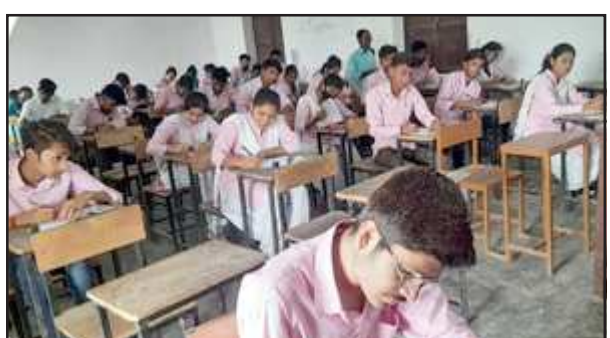
एमडीपीजी कालेज में परीक्षा देते परीक्षार्थी।