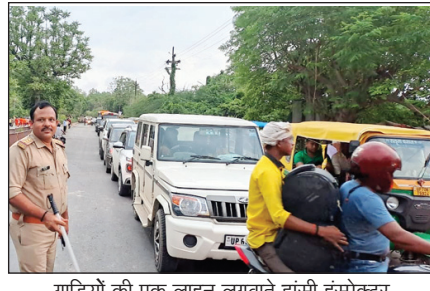
गाड़ियों की एक लाइन लगाते झूसी इंस्पेक्टर