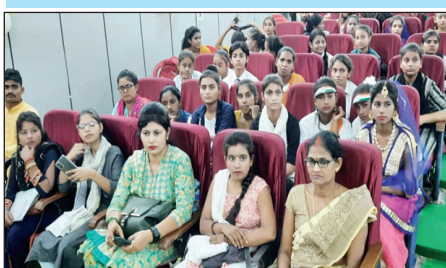
कला प्रदर्शनी में उपस्थित महिलाएं

युवा उत्सव के तहत आयोजित कलाकारों का कला प्रदर्शन प्रतियोगिता का सीडीओ ने किया शुभारम्भ