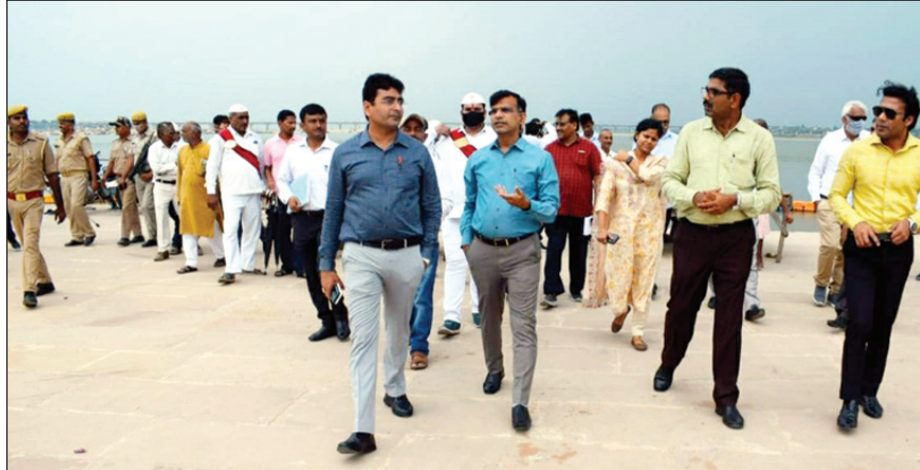
अरैल में चल रहे निर्माणाधीन पक्के घाट का निरीक्षण करते मण्डलायुक्त व जिलाधिकारी

नैनी। मण्डलायुक्त संजय गोयल एवं जिलाधिकारी संजय कुमार खत्री बुधवार को अरैल में बन रहे पक्के घाट का निरीक्षण किया। निरीक्षण के समय सिंचाई विभाग के अधीक्षण अभियंता ने बताया कि अरैल घाट पर कुल 300 मीटर पक्का घाट बनाये जाने का प्रस्ताव स्वीकृत हुआ था, जिसमें से अभी 100 मीटर पक्के घाट का निर्माण कराया गया है तथा 200 मीटर और पक्के घाट को बनाया जाना है। मण्डलायुक्त ने कहा कि 200 मीटर और बनने वाले पक्के घाट के बारे में टेकनिकल टीम से रिपोर्ट ले लिया जाए। उन्होंने घाट में उपयोगिता तथा मेला अवधि में घाट तक पानी की उपलब्धता के बारे में भी जानकारी लेते हुए इस सम्बंध में सिंचाई विभाग,