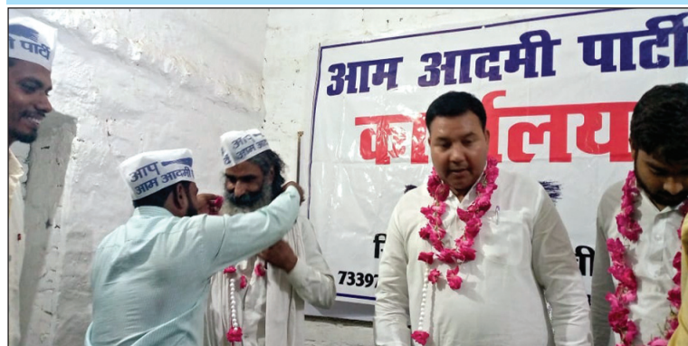
आम आदमी पार्टी नेता का स्वागत करते पार्टी जन

आम आदमी पार्टी के काशी प्रांत के अध्यक्ष ने कहा कि हमें एक ईमानदार सरकार लाने के लिए ईमानदारी से संगठन को मजबूत करने का कार्य करना है