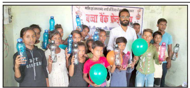
असहाय बच्चों को उपहार देते प्रतियोगी छात्र।

बच्चा बैंक स्टडी सेंटर पहुंचे प्रतियोगी छात्र, बच्चों को पढ़ाया, जरूरतमंद बच्चों की हर संभव मदद के लिए आगे आ रहे लोग