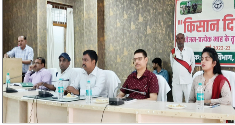
किसान सम्मान दिवस में उपस्थित डीएम व अन्य

बैठक में किसानों द्वारा बताया गया कि वर्षा न होने के कारण धान की रोपाई/सिंचाई में समस्या आ रही है, इस सम्बन्ध में अधिशासी अभियंता सिंचाई ने बताया कि किशनपुर पम्प नहर के सभी पम्प संचालित हैं तथा निचली गंगा नहर, प्रखण्ड फतेहपुर, सिंचाई खण्ड फतेहपुर में बैराज से 50 से 60 प्रतिशत ही पानी उपलब्ध कराया जा रहा है, जिस पर जिलाधिकारी ने अधिशासी अभियंता सिंचाई को आ रही समस्याओं का निस्तारण कराते हुए सभी नहरों को संचालित करने के निर्देश दिये। इसके साथ ही उन्होंने कहा कि सभी जेड00 क्षेत्र में भ्रमणशील रहकर आ रही समस्याओं का