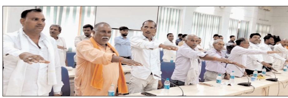
जल संचयन की शपथ लेते किसान