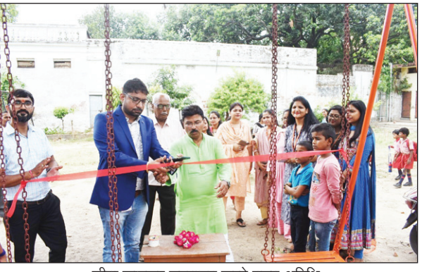
फीता काटकर उद्घाटन करते मुख्य अतिथि