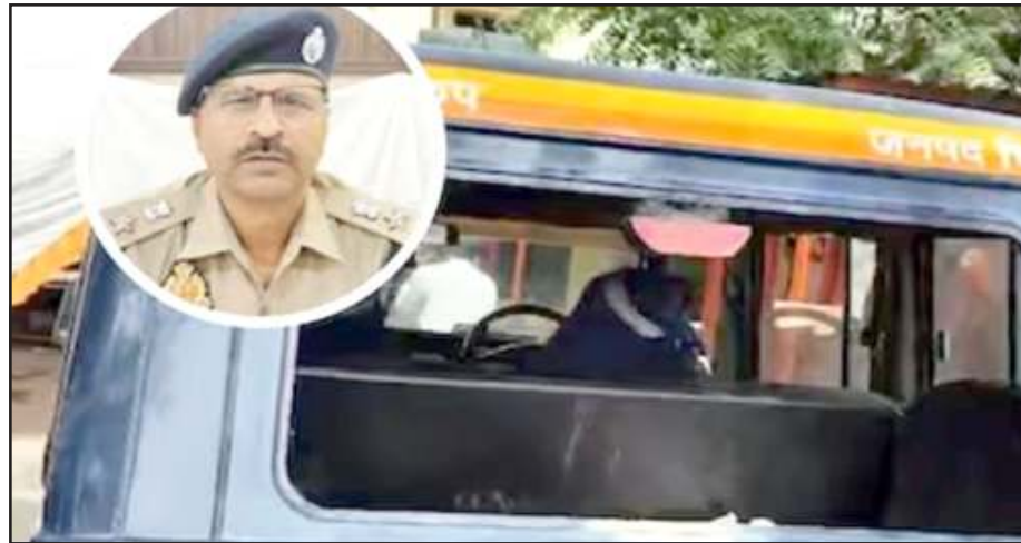
घटना के बारे में बताते एसपी व टूटी पुलिस की गाड़ी।

चित्रकूट। भरतकूप थाना क्षेत्र के रौलीकल्याणपुर गांव में डीजे की धुन पर बर्षडे पार्टी पर लोग नाच रहे थे। पुलिस के पहुंचने पर सन्नाटा छा गया। पुलिस ने देर रात डीजे बंद करने को कहा तो ग्रामीणों ने सवाल-जवाब शुरू कर दिये। इसे लेकर बवाल हो गया। पुलिस ने इस मामले में 13 लोगों को गिरफ्तार किया है। पुलिस से मुजहमत की ये घटना भरतकूप थाने के रौलीकल्याणपुर गांव में शुक्रवार की रात हुई। बताया गया कि देर रात डीजे बंद कराने गई पुलिस