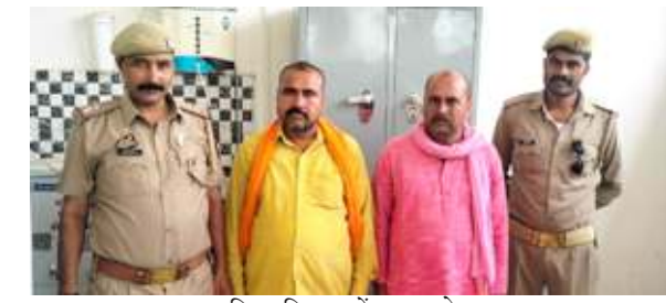
पुलिस गिरफ्त में बालू चोर।