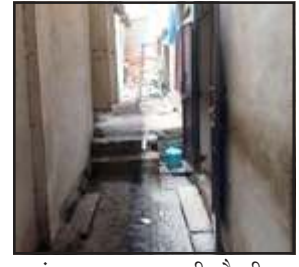
संयुक्त आवागमन की गैलरी।