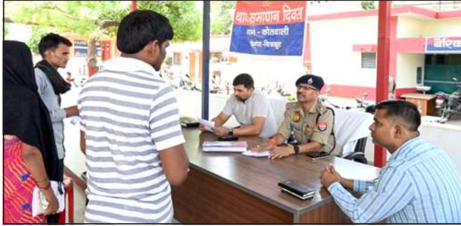
कर्मी कोतवाली में फरियादियों को सुनते डीएम-एसपी।