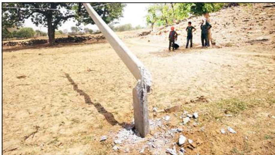
टूटा पड़ा खम्भा।

ये मामला है शुक्रवार की रात का। बताया गया कि पीड़ित ने दबंगों पर आरोप लगाया कि इनके परिवार