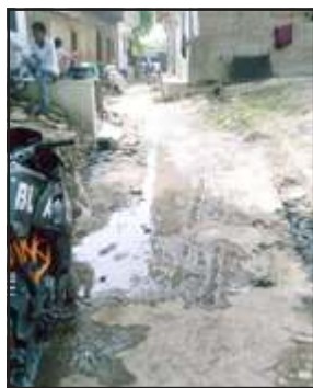
परियावां मुस्लिम बस्ती में बजबजा रही गंदगी।

परियावां, प्रतापगढ़। विकास क्षेत्र कालाकाकर की सबसे बड़ी आबादी वाली ग्राम पंचायत परियावां के मुस्लिम बस्ती में विगत चार पांच महीनों से नाली की सफाई न होने से गंदगी का सामना फल गया है नाली के चोक हो जाने से उसमें बहने वाला गंदा पानी नाली के ऊपर से खड़का में भर रहा है जो बहन न पाने के कारण बदनू देने लगा है शनिवार की सुबह मोहल्ले के लोगों ने बज बजा रही नाली के