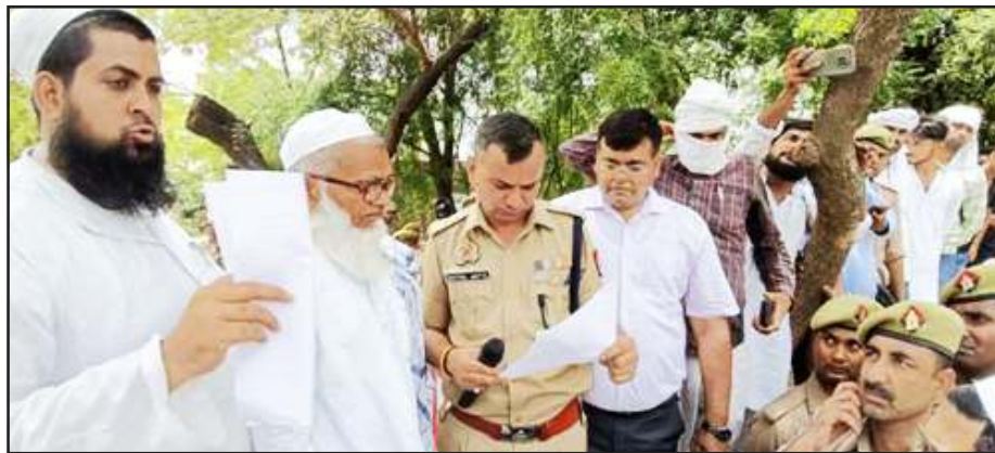
मौलाना की मौत पर घटना स्थल पर पहुंचे डीएम व एसपी।