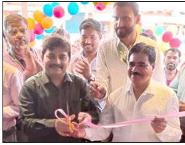
नई शाखा का शुभारम्भ करते आर्यावर्त बैंक महाप्रबंधक।