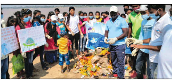
गंगा प्रहरी साफ सफाई कर जागरूक करते हुए