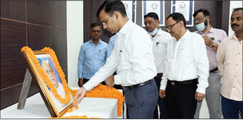
सरदार वल्लभ भाई पटेल के चित्र पर पुष्प अर्पित करते मण्डलायुक्त।