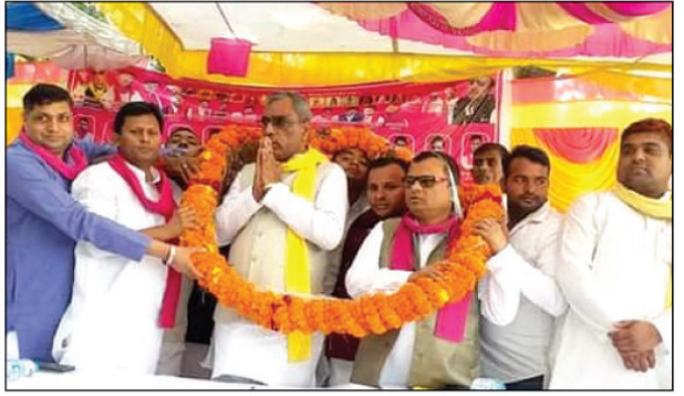
पूर्व मंत्री का स्वागत करते पार्टी जन