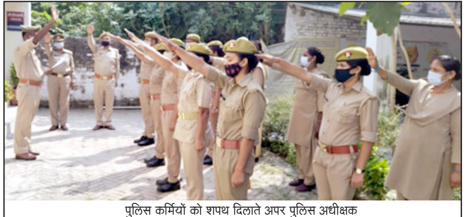
पुलिस कर्मियों को शपथ दिलाते अपर पुलिस अधीक्षक