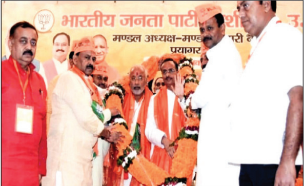
औद्योगिक नगरी नैनी के युनाइटेड कालेज में आयोजित काशी क्षेत्र के बैठक में आये डिप्टी सीएम दिनेश शर्मा का स्वागत करते व उपस्थित लोग।