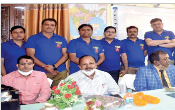
राजकीय इंटर कॉलेज 1996 बैच के छात्रों का सिल्वर जुबली कार्यक्रम में

अखंड भारत संदेश राजकीय इंटर कॉलेज 1996 बैच के छात्रों का सिल्वर जुबली कार्यक्रम, 25 साल बाद... वही कक्षा, वही सीट और दोस्तों संग ढेर सारी मस्ती शाल, स्मृति चिन्ह व किताबें देकर सम्मानित किया गया। पुरा छात्रों की ओर से स्कूल को पंखे भी दिए गए* सबकी जुबां पर अपने-अपने किस्से छात्र चाहे गणित, जीव विज्ञान वर्ग के रहे हों, आदर्स के हों वा कॉमर्स के, सबकी जुबां पर अपनी-अपनी यादें थीं, जिसे वे सभी से साझा कर रहे थे। किस्सों का दौर तो खत्म होने का नाम ही नहीं ले रहा था, फिर चाहे रवींद्र नाथ टैगोर उद्यान में गेंद तड़की खेलने का किस्सा हो, स्कूल में फोटो-संगणक का हो, खेल के दौरान लड़ाई-झगड़ा का रहा हो। दौरे