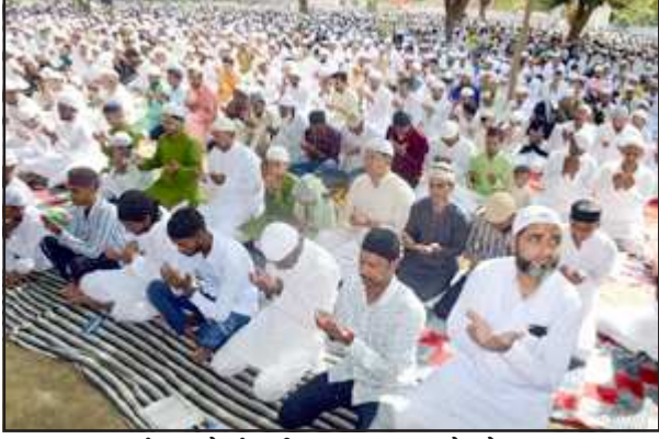
ईदगाह में ईद की नमाज अदा करते लोग।

ईदगाह में डीएम, एसपी, एडीएम, एसडीएम सहित भारी पुलिस रही तैनात, दिन भर चलता रहा एक-दूसरे से गले मिलकर मुबारकबाद देने का सिलसिला