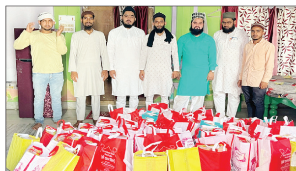
ईद किट वितरित करते टीम के लोग