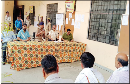
बैठक करते उपजिलाधिकारी एवं सीओ

कौशाम्बी। नगर निकाय के चुनाव को सकुशल शांतिपूर्ण तरीके से संपन्न कराने के लिए एसडीएम और सीओ ने प्रत्यासियों से मुलाकात की और उन्हें निर्दिशित किया कि वह चुनाव आचार संहिता का सख्ती से पालन करें उपजिलाधिकारी चायल व क्षेत्राधिकारी चायल द्वारा नगर निकाय चुनाव के दृष्टिगत नगर पंचायत चायल, चरवा और सराय अकील क्षेत्र में वार्ड सदस्य के प्रत्यासियों के साथ मीटिंग कर, चुनाव आचार संहिता के नियमों शर्तों से अवगत कराया और चुनाव आचार संहिता का अनुपालन करने की नसीहत दी गई।