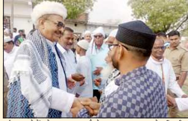
ईद पर लोगों को मुबारकबाद सौंपते राज्यसभा सदस्य प्रमोद तिवारी।

लालगंज के अझारा तथा खानापट्टी व खालसा सादात ईदगाहों पर जुटे भारी तादात में लोगों के बीच पहुंचे प्रमोद तिवारी ने बच्चों व बुजुर्गों तथा नौजवानों को गले लगाकर उनके जीवन में खुशहाली को लेकर परवर दिगार ए आत्म से दुआएं की। उन्होंने कहा कि ईद का त्योहार हमें