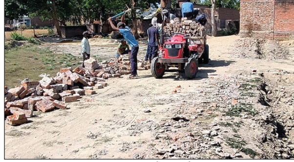
मंदिर की जमीन पर हो रहा अवैध कब्जा

चुका है। महिलाओं को टोली भी अब वार्डों में भ्रमण करने लगी है। अपने अपने दल के प्रत्यासियों के लिए महिलाएं प्रचार कर रही हैं। प्रत्यासी पूरी रणनीति के साथ राजनीतिक दल