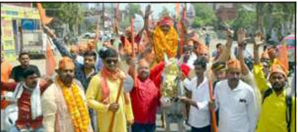
शोभायात्रा में शामिल परशुराम सेना के पदाधिकारी।