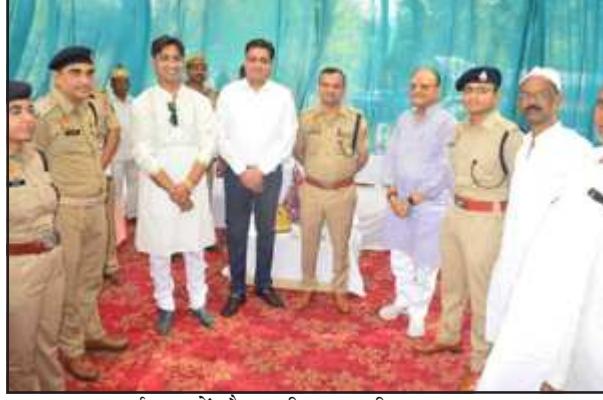
ईदगाह में मौजूद डीएम, एसपी व अन्य।