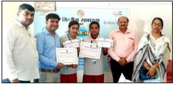
परीक्षा में प्रथम व द्वितीय स्थान पाने वाले विद्यार्थियों।

बता दें कि ब्लाक स्तर पर चयनित प्रथम स्थान पर चयनित ग्रुप के विद्यार्थियों की जिला स्तरीय प्रतियोगिता में प्रतापगढ़ के तीन विद्यालयों के विद्यार्थी एवं प्रयागराज के तीन चयनित विद्यालयों के विद्यार्थियों की सामूहिक जनपद स्तरीय परीक्षा