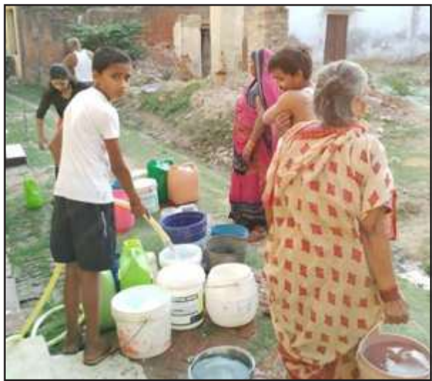
पानी लेने के लिये लगी लोगों की भीड़।

किसी तरह ग्रामवासी लोग एक दूसरे के घर से पानी मांग कर घर का खाना व प्यास बुझा रहे हैं। पाइप लाइन भस्त हुए लगभग 15 दिन बीत गये लेकिन अभी जलनिगम जेई कालाकांकर अभी तक पानी की भस्त पाइप लाइन को ठीक नहीं कर सके जिससे पानी की सप्लाई वाले गांवों में पानी को लेकर हाहाकार मचा हुआ है। आक्रोशित ग्रामीणों ने बताया कि जल निगम विभाग इस ओर से