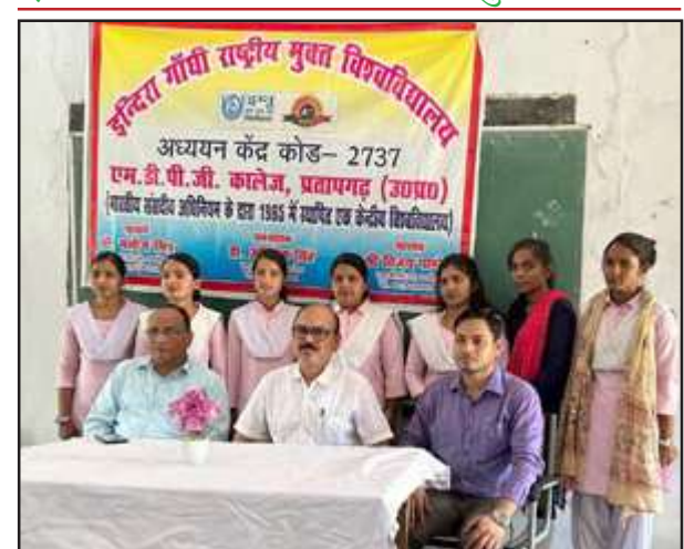
एमडीपीजी कालेज में आयोजित शिविर में मौजूद प्राचार्य व अन्य।

जैविक, भौतिक और रासायनिक तत्वों की पूरी समझ हासिल करेंगे। कार्यक्रम की अध्यक्षता कर रहे एमडीपीजी कालेज के