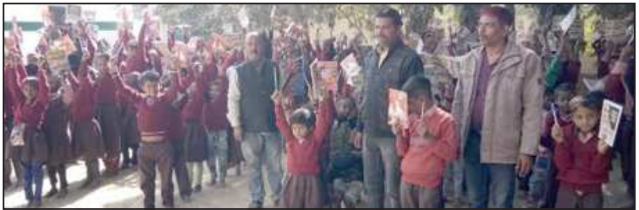
पठन सामग्री के साथ प्राथमिक विद्यालय के बच्चे।