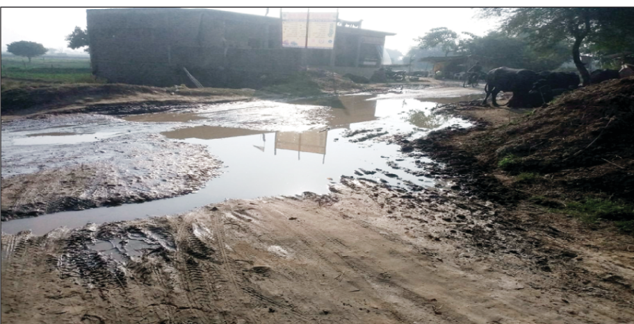
सड़क में जलभराव का दृश्य

योगी सरकार को गड्डा मुक्त अभियान की झूठी सूचना देकर करोड़ों डकार गए विभागीय अधिकारी