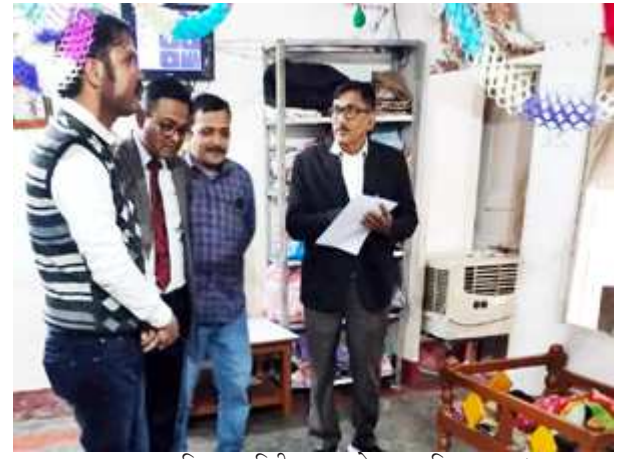
बाल गृह पिपू का निरीक्षण करते अपर जिला जज।