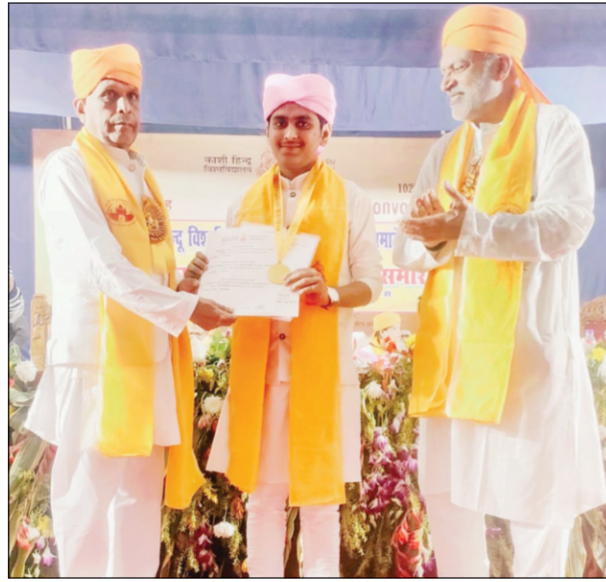
छात्र को सम्मानित करते गुरुजन