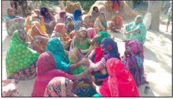
पिता-पुत्र की मौत पर रोते-बिलखते परिजन।