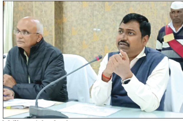
आरसी वसूली के लिए एक नायब तहसीलदार को नामित करने के भी निर्देश दिये। उन्होंने सभी ईओ को अपने-अपने नगर पालिका/नगर पंचायत में साफ-सफाई की बेहत

पत्र प्रेषित करने के निर्देश दिये जिलाधिकारी ने सभी उप जिलाधिकारियों एवं तहसीलदारों को आरसी की वसूली में प्रगति लाने के निर्देश दिये। इसके साथ ही उन्होंने