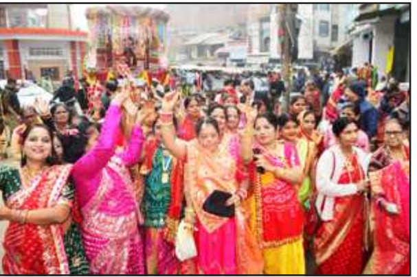
भगवान कृष्ण की बारात में नाचती-गाती महिलाएं।