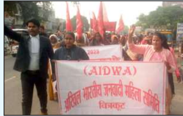
प्रदर्शन करती जनवादी महिला समिति।