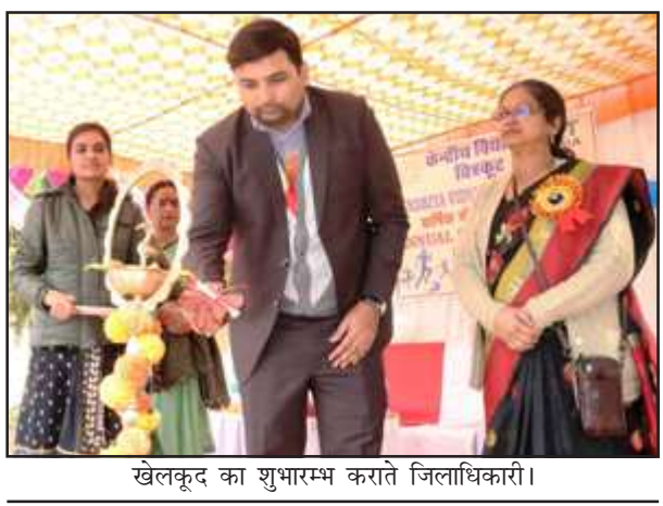
खेलकूद का शुभारंभ करते जिलाधिकारी।