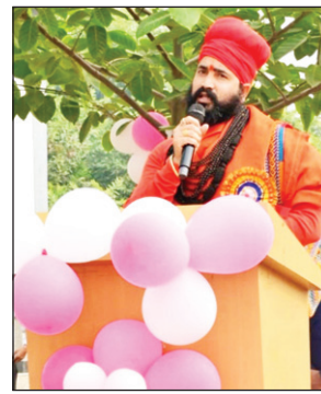
आरके ग्रुप ऑफ इंस्टीट्यूट्स नैनी परिसर में नवागन्तुक छात्र-छात्राओं के लिए दो दिवसीय स्वागत समारोह