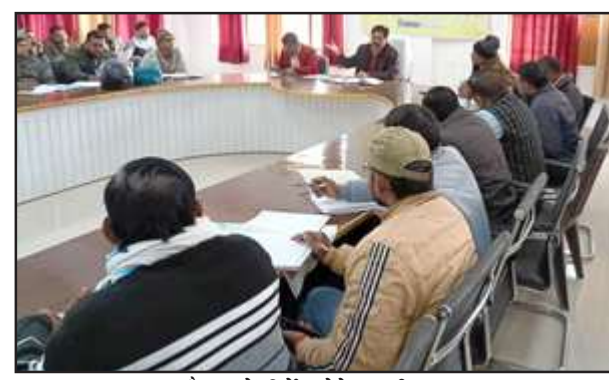
बैठक में निर्देश देते एसडीएम।

शुक्रवार को तहसील सभागार में बैठक की अध्यक्षता करते हुए एसडीएम ने नगर व तहसील क्षेत्र के बीएलओ से कहा कि कोई भी मतदाता का नाम न छूटे। जो गलत नाम सूची में दर्ज हैं, अच्छे से परीक्षण कर लें। कंट्रोल टेबल को