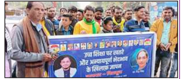
प्रदर्शन करते सरदार सेना के लोग।

देशभर के विश्वविद्यालयों पर एक विचारधारा थोपी जा रही है। प्रोफेसर नियुक्ति में भेदभाव किया जा रहा है। प्रतिभा का हनन हो रहा है। केंद्रीय विश्वविद्यालयों में जातिगत लैंगिक व अन्य शोषण-