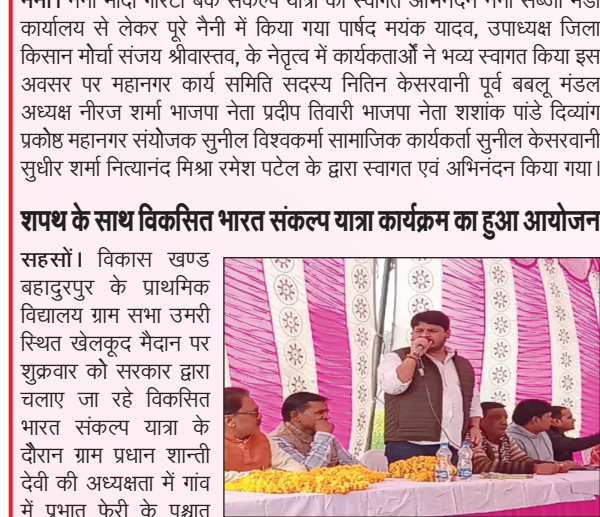
मोदी गार्ड्री बैंक संकल्प यात्रा का स्वागत किया गया