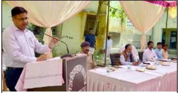
बोर्ड परीक्षा सम्बन्धी बैठक में बोलते जिलाधिकारी डा0 नितिन बंसल

की मंशा के अनुरूप जनपद में बोर्ड परीक्षा को नकल विहीन पारदर्शिता पूर्ण एवं सकुशल संपन्न कराना है। किसी भी परीक्षा केंद्र पर गड़बड़ी पाए जाने पर या नकल