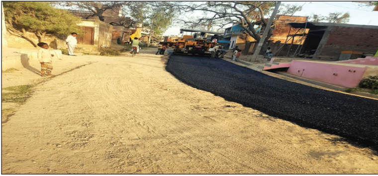
मिट्टी की सड़क में किए जा रहे डामरीकरण का दृश्य

जिले से लेकर शासन तक के अधिकारियों ने भ्रष्टाचार में लिप्त नगर पालिका के अधिशासी अधिकारी के कारनामों पर साधी चुप्पी, एक माननीय पर नगर पालिका परिषद मंडनपुर के भ्रष्टाचार में कमीशन खोरी कर बचाने का 2 वर्षों से लगातार लग रहा आरोप