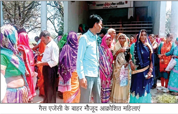
गैस एजेंसी के बाहर मौजूद आरक्षित महिलाएं

संस्था की इस लापरवाही पर अभी तक टक्करा गू है जिससे दोनों वाहन चालकों को चोट लगी है ग्रामीणों ने डीएम सीडीओ का ध्यान आकृष्ट कराते हुए समतलीकरण किए जाने का प्रयास क्यों नहीं किया है यह विभाग की व्यवस्था पर बड़ा सवाल है। सोमवार की देर शाम फिर दो वाहन चालक पुलिया के ऊबड़