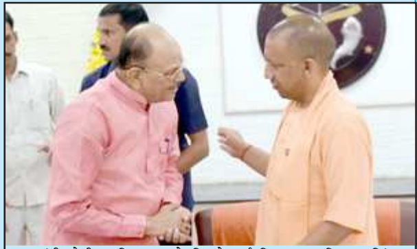
मुख्यमंत्री योगी आदित्यनाथ से मिलते पूर्व विधायक हरिप्रताप सिंह।

नये कार्यकाल में नगर के विकास में योगदान की अपेक्षा की। मुख्यमंत्री ने हरिप्रताप से जिले के राजनैतिक गतिविधियों को भी जानकारी ली। बता दें कि मुख्यमंत्री नगर पालिका बेल्हा के कार्यों के बारे में बराबर जानकारी लेते रहे हैं। कुछ माह पहले नगर