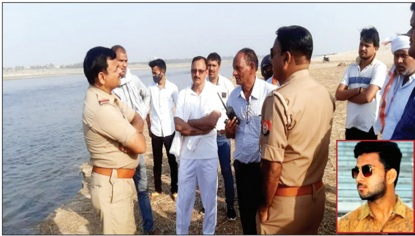
यमुना में डूबे युवक की तलाश में प्रयासरत पुलिस अधिकारी व इन्स्टे में डूबे हुए युवक की फाइल फोटो