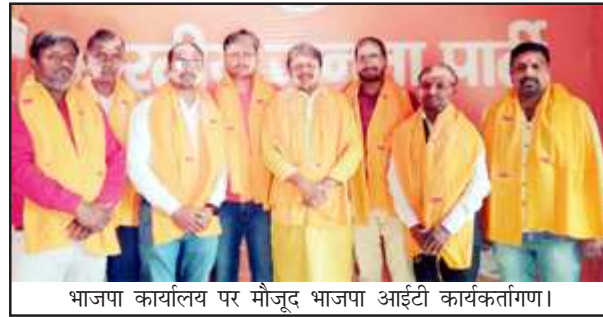
भाजपा कार्यालय पर मौजूद भाजपा आईटी कार्यकर्तागण।

उत्तर प्रदेश विधानसभा चुनाव 2022 में आईटी के कार्यकर्ताओं ने बृथ स्तर तक पार्टी के विस्तार के लिए चुनाव के पूर्व अनथक प्रयास किए, जिसका परिणाम यह रहा कि भारतीय जनता पार्टी प्रदेश में 35 वर्षों के इतिहास में उलटफेर करते हुए पुनः भाजपा सरकार प्रदेश में बनने जा रही है। संगठन के रैली