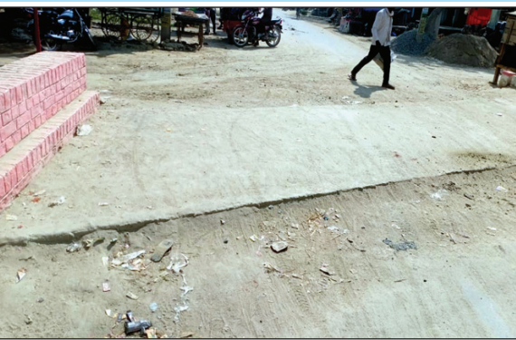
सड़क नीचे पुलिया ऊपर का दृश्य

पुलिया और सड़क के समतलीकरण का भुगतान कार्यदाई संस्था द्वारा निकाल लिया गया