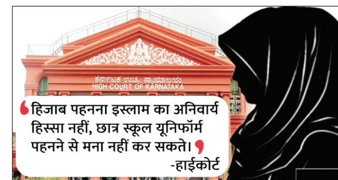
हिजाब पहनना इस्लाम का अनिवार्य हिस्सा नहीं, छात्र स्कूल यूनिफॉर्म पहनने से मना नहीं कर सकते। -हाईकोर्ट