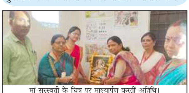
मां सरस्वती के चित्र पर माल्यार्पण करती अतिथि।

सुखपाल नगर बीआरसी पर नारी चौपाल व संगोष्ठी सम्पन्न