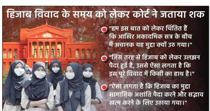
हिजाब विवाद के समय को लेकर कोर्ट ने जताया शक

हिजाब पर पाबंदी की खिलाफत: हाई कोर्ट के फैसले के खिलाफ शीर्ष अदालत जाने की तैयारी, कर्नाटक हाईकोर्ट के फैसले के बाद छात्राओं ने परीक्षा का बायकॉट किया