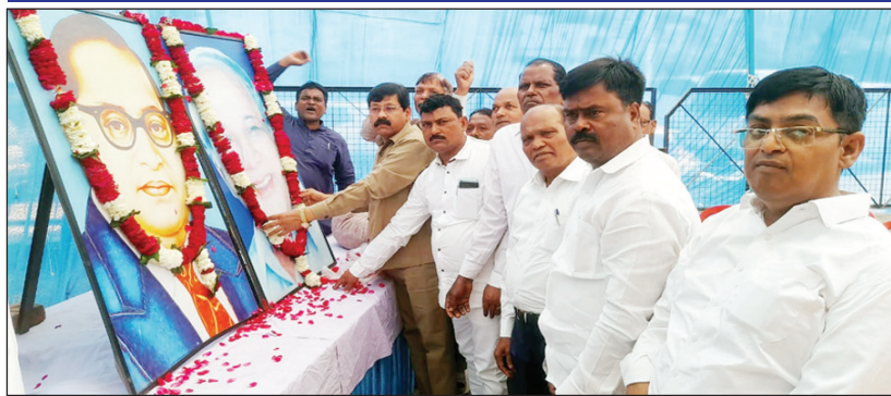
बसपा संस्थापक का 88 वां जन्मदिवस मनाते बसपा नेता व कार्यकर्ता।