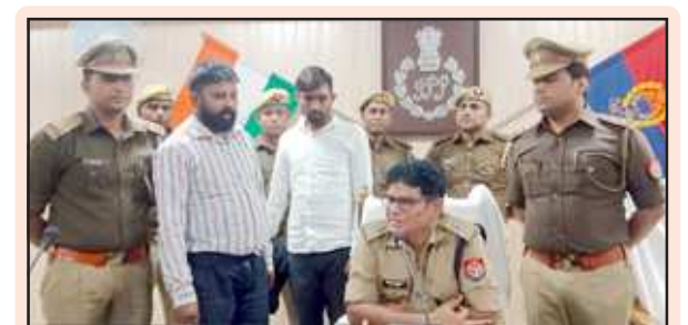
इनामिया की गिरफ्तारी की जानकारी देते एसपी।