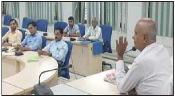
मतदाता बैठक में उपस्थित अधिकारियों को निर्देशित करते अपर जिला अधिकारी

कौशाम्बी। अपर जिलाधिकारी जयचन्द्र पाण्डेय ने उदयन सभागार में नगरीय निकाय सामान्य निर्वाचन-2022 के लिए नगरीय निकायों में मतदान केन्द्रों मतदान स्थलों के निर्धारण के सम्बन्ध में मान्यता प्राप्त राजनैतिक दलों के अध्यक्ष सचिव के साथ बैठक की बैठक में अपर जिलाधिकारी ने राजनैतिक दलों के पदाधिकारियों को दिनांक 12.11.2022 तक मतदान केन्द्र मतदान स्थल परिचालित करने का प्रस्ताव जिला निर्वाचन कार्यालय पंचायत एवं नगरीय निकाय) में प्रस्तुत करने के निर्देश दिये। इस