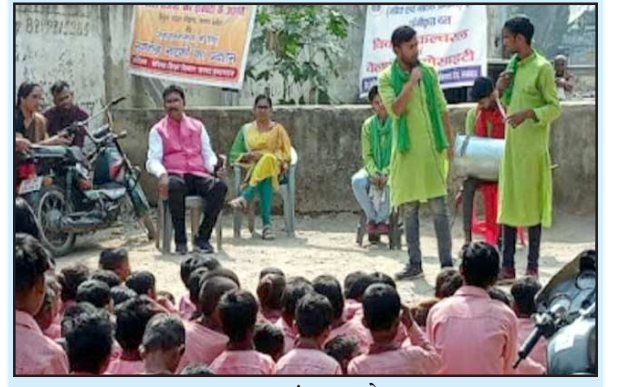
नुकड़ नाटक का मंचन करते कलाकार।