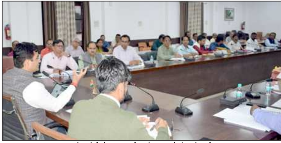
अधिकारियों के साथ समीक्षा बैठक करते जिलाधिकारी।

निर्माण कार्यों को समयबद्धता एवं गुणवत्ता के साथ पूर्ण किया जाये