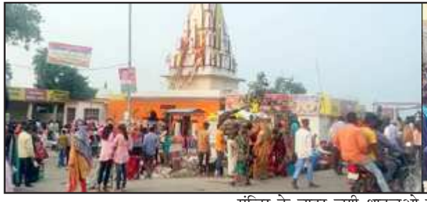
मंदिर के बाहर लगी श्राद्धलुओं की भीड़ तथा मेले में उमड़ी लोग।

अखंड भारत संदेश प्रतापपुर। संगमनगरी प्रयागराज से लगभग 35 किमी उत्तर दिशा में वरुणा नदी के तट पर स्थित प्राचीन वरुणेश्वर महादेव का धाम हिन्दू धर्म में आस्था रखने वाले लोगों के लिए आस्था का केंद्र है। पौराणिक मान्यताओं के अनुसार भगवान वरुण द्वारा हवन के लिए बनाए गए हवन कुंड से हवन के पशुयत जल की धारा निकल पड़ी जिसे वरुणा नदी के नाम से जाना जाता है। इसी समय