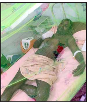
बाँयलर फटने से झुलसा व्यक्ति।

कौशाम्बी। सामुदायिक स्वास्थ्य केंद्र सराय अकिल में चिकित्सक की व्यवस्था को संचालित करने के लिए बाँयलर लगाया गया था लेकिन देखरेख के लिए लगाया गया स्वास्थ्य कर्मचारी मौज मस्ती कर बाँयलर संचालन की जिम्मेदारी स्वीपर को छोड़ दिया था विभागीय लापरवाही के चलते बाँयलर अधिक हिट हो गया और बुधवार की दोपहर बाद लगभग 3:00 बजे बाँयलर तेज आवाज के साथ फट गया बाँयलर फट जाने से मौके पर मौजूद पांच लोग गंभीर रूप से झुलस गए हैं जिन्हें सामुदायिक स्वास्थ्य केंद्र सराय अकिल में इलाज नहीं