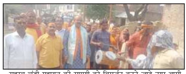
सहस्त्र चंडी महायज्ञ की सामग्री को विसर्जन करते जाते नगर वासी

कौशाम्बी। जनपद मुख्यालय मंझनपुर के प्राचीन दुर्गा मंदिर प्रांगण में सहस्त्र चंडी महायज्ञ का आयोजन भक्तों द्वारा किया गया था सहस्त्र चंडी महायज्ञ के आयोजन के संपूर्ण हो जाने के बाद बुधवार को यज्ञ सामग्री का विसर्जन बड़ी ही धूमधाम से नगर वासियों ने किया है विसर्जन के दौरान डीजे की धुन पर नाचते गाते मां का जयकारा लगाते हुए महिला पुरुष भक्तों ने नगर भ्रमण कराकर पूजन सामग्री का विसर्जन निर्धारित स्थल पर किया है