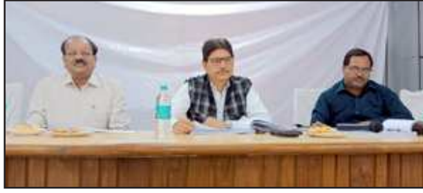
बैठक में अधीनस्थों को निर्देशित करते सीडीओ, व उपस्थित विभिन्न विभाग के अधिकारी।

निराश्रित गोवर्षों को गौशालाओं में संरक्षित करने के निर्देश मुख्य चिकित्साधिकारी को दिये इसके साथ ही उन्होंने पशुओं