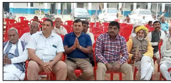
कार्यक्रम में भाग लेते लोग।