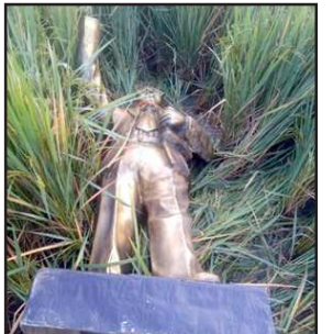
अराजक तत्वों द्वारा तोड़ी गयी मूर्ति।