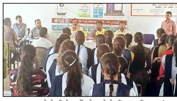
मतदाता बनने के लिये फर्मों को भरने के लिए एकत्रि छात्राएं।

शंकरगढ़। बुधवार से लोकसभा और विधानसभा निर्वाचक नामावलियों के संक्षिप्त पुनरीक्षण कार्य का शुभारंभ हो गया है। राजा कमलाकर डिग्री कालेज, शंकरगढ़ में एसडीएम बारा सुदन अब्दुल्ला ने पंजीकरण कैंप का शुभारंभ किया। प्रथम दिन कालेज की 19 छात्राओं ने फार्म 6 भरकर पहली बार मतदाता बनने के लिए आवेदन किया। एसडीएम ने कहा कि लोकतंत्र में मतदान का बड़ा महत्व है। इसलिए सभी को मतदाता सूची में अपना नाम जोड़वाना चाहिए और मतदान करना चाहिए। एसडीएम ने फार्म 6, फार्म 6ए,