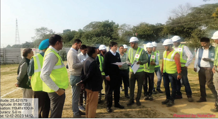
Image: 25.421579 Latitude: 81.867353 Longitude: 119.41+100 m Accuracy: 5.0 m Created: 12-12-2023 14:12 Powered by Mapbox