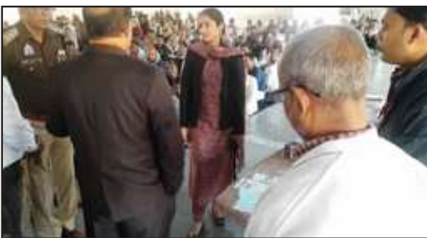
जिला जेल में बन्दियों को सम्बोधित करती सीडीओ।