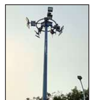
चौहरो पर जलती हाई मास्क लाइट। के हाईमास्ट जलने के क्या कारण हैं, इनका जिम्मेदार कौन है।

चित्रकूट। विद्युत विभाग यूं तो किसी गरीब का कोई बिल पडा हो तो तत्काल कनेक्शन काट देता है। यहां तक कि बिना विद्युत जलाये ही बिल भी भेज देता है, लेकिन शहर व नगर पंचायत तथा ग्रामीण क्षेत्रों में बड़े-बड़े हाईमास्ट जलते हैं तो इनका बिल कौन भरता है। ये सब सीधे कटिया फांसकर जलाये जाते हैं। आखिर हाईमास्ट आदि के बिजली उपभोग का जिम्मेदार कौन है? मंगलवार को बिना कनेक्शन