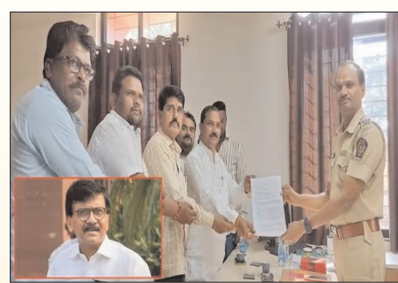
करने संबंधी लेख लिखा है। इस लेख से समाज की भावनाएं अहत हो रही हैं। संजय राऊत के लेख से समाज के बीच दरार