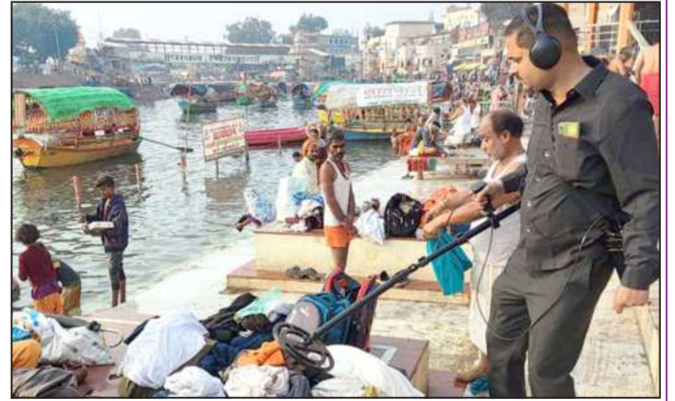
जांच करते बम स्कड की टीम।

बालिकाओं को महिला सुरक्षा बाबत हेल्पलाइन नम्बरों के पंपलेट बांटे। सभी महिलाओं/बालिकाओं से हेल्पलाइन नम्बर का निर्भीक होकर उपयोग करने व आत्मनिर्भर बनने तथा निर्भीक होकर अपने क्षेत्र में कार्य करने/शिक्षा ग्रहण करने को प्रेरित किया। सोशल मीडिया पर प्राइवसी रखते हुये प्रयोग करने की सलाह दी। महिलाओं/ बालिकाओं को जिले में गठित एंटी रोमियो टीम के बारे में बताया। सादे वस्त्रों में प्राइवेट वाहन से सार्वजनिक स्थलों स्कूल, कालेज व कोचिंग संस्थान के आसपास जहां महिलाओं-बालिकाओं का आवागमन होता है, उन स्थानों को चिन्हित कर शोहदा/मनचलो की हरकतों को रोकने को सादे वस्त्रों में पुलिस तैनात रहती है।