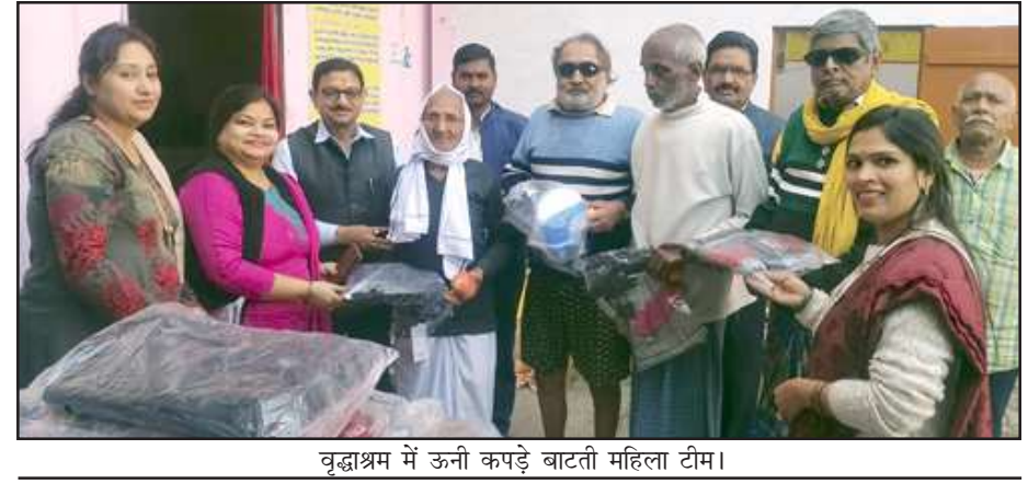
वृद्धाश्रम में ऊनी कपड़े बाटती महिला टीम।