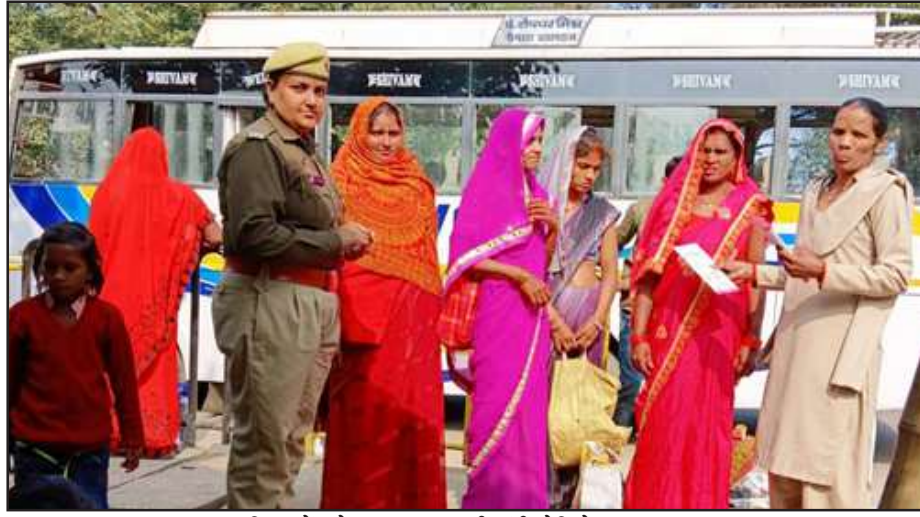
महिलाओं को जागरूक करती एंटी रोमियो।