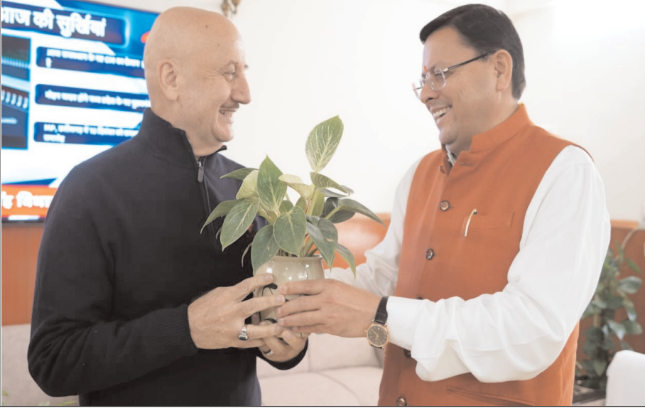
प्रसिद्ध बॉलीवुड अभिनेता अनुपम खेर ने मुख्यमंत्री पुष्कर सिंह धामी से मंगलवार को सचिवालय में भेंट की। इस दौरान उन्होंने उत्तराखंड में फिल्मकान व फिल्म निर्माण से संबंधित विभिन्न विषयों पर मुख्यमंत्री से चर्चा की।

श्रीनगर। नेशनल कॉंग्रेस के नेता फारुक अब्दुल्ला ने अनुच्छेद 370 को निरस्त करने के सुप्रीम कोर्ट के फैसले पर निराशा व्यक्त की। उन्होंने कहा कि भारत के पहले प्रधानमंत्री जवाहरलाल नेहरू अनुच्छेद 370 के लिए जिम्मेदार नहीं थे।