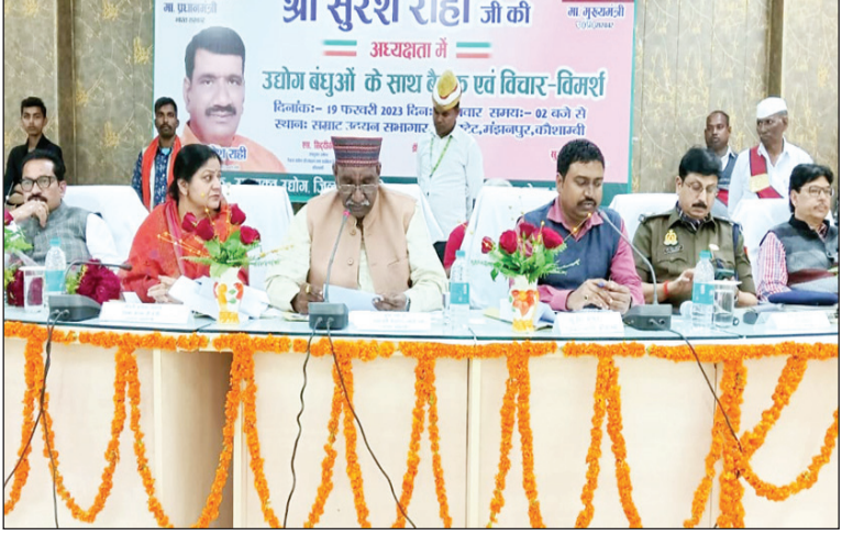
बैठक में उपस्थित प्रभारी मंत्री डीएम एसपी व अन्य

प्रभारी मंत्री ने कहा कि निवेशक अपने निवेश धरातल पर उतारें, प्रदेश सरकार हर सम्भव मदद उपलब्ध करायेंगी, जनपद कौशाम्बी में उद्योगों की स्थापना से रोजगार के अनेक अवसर सृजित होंगे