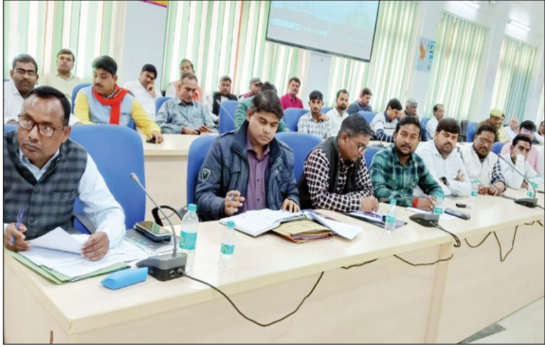
बैठक में उपस्थित विभिन्न विभाग के अधिकारी