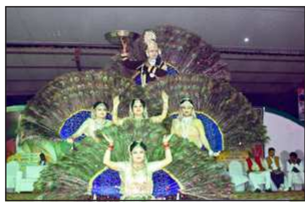
बाबा घुइसरनाथ धाम में प्रस्तुतियां देते कलाकार।