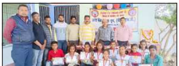
बच्चा बैंक द्वारा सम्मानित खिलाड़ीगण।