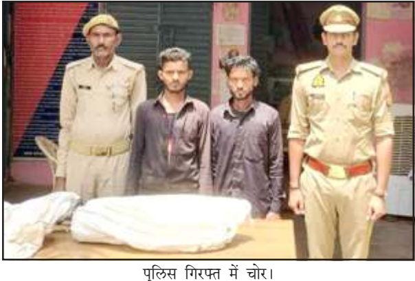
पुलिस गिरफ्त में चोर।