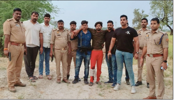
अखंड भारत संदेश

मान्यता प्राप्त पत्रकार का पुत्र लूट की घटना में आरोपी, पुलिस मुठभेड़ में हुआ घायल