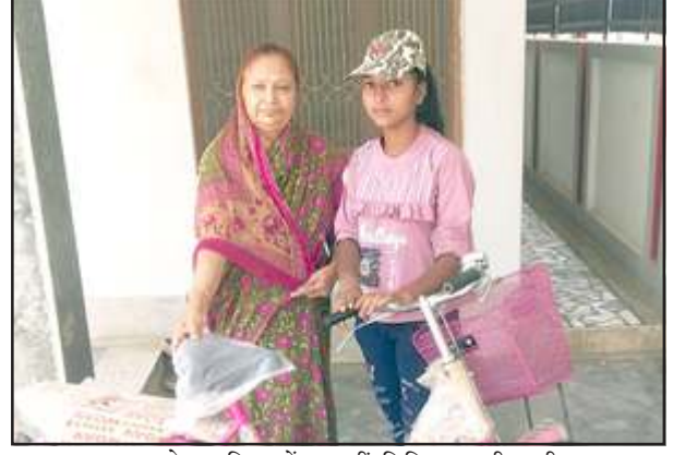
छात्रा को साइकिल भेंट करती चिकित्सक की पत्नी।