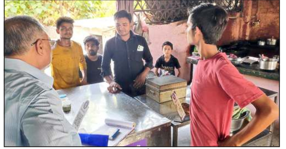
बाल श्रम दिवस पर छापेमारी करती टीम।