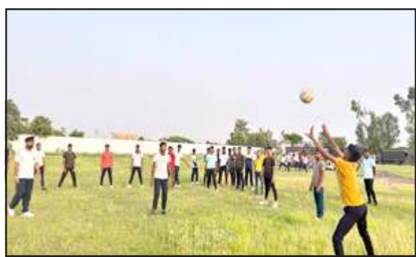
एनसीसी के वार्षिक प्रशिक्षण शिविर में मौजूद एनसीसी कैडेट।

प्रतापगढ़। 18वृषी बटालियन एनसीसी के तत्वावधान में कुण्डा क्षेत्र के बीबीएस इंटर कालेज बरना परिसर में एनसीसी कैडेटों के एक वार्षिक प्रशिक्षण शिविर का आयोजन 10 जून से 19 तक किया गया है। इस शिविर में 390 बालक व 204 बालिकाएं तथा छह एनसीसी अधिकारी भाग ले रहे हैं। शिविर के दौरान सभी कैडेटों के प्रभावी प्रशिक्षण हेतु कर्नल एके सिंह कमान अधिकारी व ले0 कर्नल एलबी सिंह के नेतृत्व में 25 सैन्य कर्मचारी तत्परा के साथ लगे हुए हैं। शिविर के दौरान सभी कैडेट शिविर स्थल पर ही निवास करते