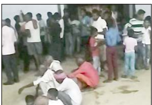
भण्डारे में प्रसाद ग्रहण करते श्रद्धालु।