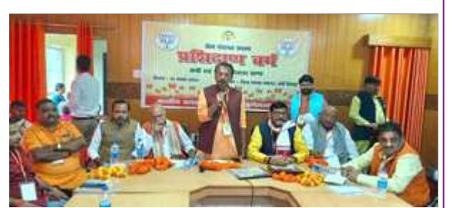
कार्यक्रम को सम्बोधित करते सांसद।