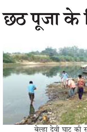
बेल्हा देवी घाट की सफाई करते सफाई कर्मी।

अखंड भारत संदेश प्रतापगढ़। शुक्रवार से शुरू होने वाले छठ पूजा के लिये आज दिन भर नगर पालिका द्वारा सई नदी के घाटों की सफाई व्यापक रूप से की