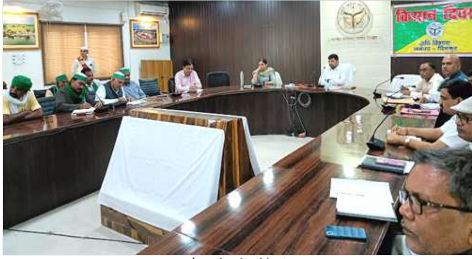
बैठक में निर्देश देते डीएम।