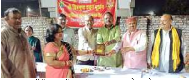
मुख्य अतिथि सदर विधायक का स्वागत करते आयोजकगण।