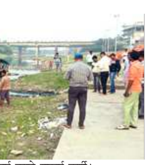
बेल्हा देवी घाट की सफाई करते सफाई कर्मी।