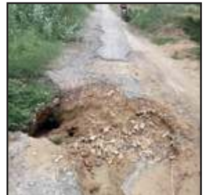
जानलेवा बनी मण्डी समिति को जाने वाली सड़क।

परियावां, प्रतापगढ़। विकास क्षेत्र कालाकांकर के अरखा रजबहा नहर की पट्टी के किनारे बनी पक्की सड़क जो मंगली का पुरवा चक पुरवा होते हुए कालाकांकर पावर हाउस होते हुए कालाकांकर लालगंज मार्ग से जुड़ती है जिसका डामरीकरण नवाबगंज कालाकांकर मंडी समिति के नाम से हुआ है जिसकी सड़क पूरी तरह क्षतिग्रस्त हो गई है जिसका नामो निशान खंडहर के रूप में देखने को मिल रहा है सड़क के बीच में जानलेवा गड्ढा मौत को दावत दे रहा है जिसकी तनिक भी प्रवाह लोक निर्माण विभाग को नहीं है यदि कोई अनजान बाइक सवार रात विरात इस सड़क से गुजर जाय