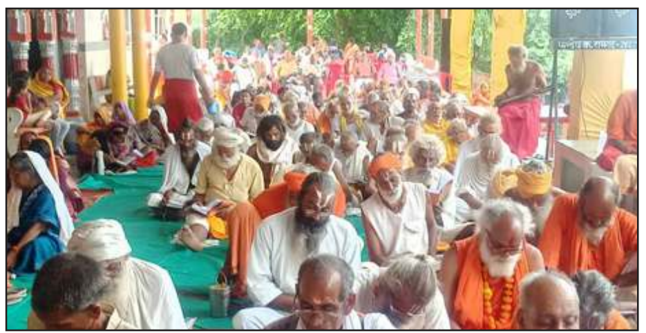
तुलसी जन्मोत्सव पर रामायण का पाठ पढ़ते श्रद्धालु।