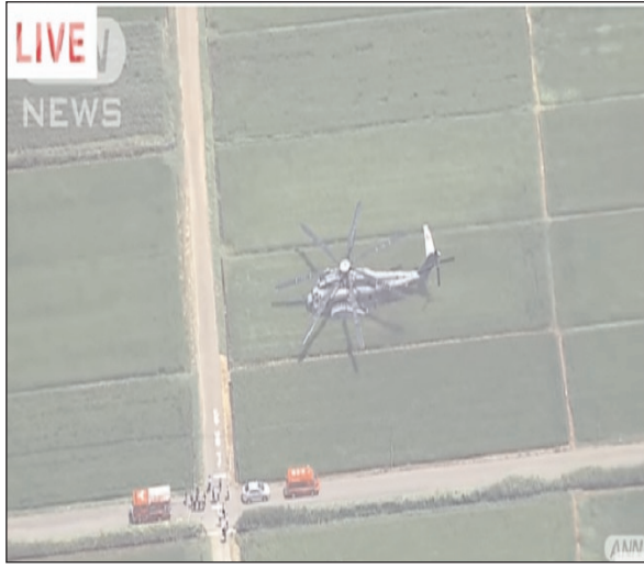
हवाला देते हुए कहा गया कि हेलिकॉप्टर ने दोपहर करीब 12:40 बजे अमेरिकी सेना के

द जापान टाइम्स का कहना है कि इस वीडियो फुटेज के अनुसार एक अमेरिकी सैन्य हेलीकॉप्टर ने शनिवार सुबह कानागावा प्रान्त के एबिना में चावल के खेत में आपातकालीन लैंडिंग की। स्थानीय अग्निशमन विभाग का