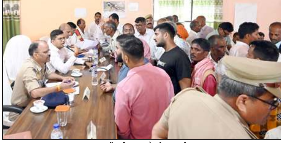
मऊ में फरियाद सुनते डीएम-एसपी।

ग्रस्त व्यक्ति को भी बतायें, ताकि निस्तारण से वह संतुष्ट हो सके। डीएम ने समाधान दिवस में आये मामलों पर कहा कि शासन से निर्धारित समय सीमा में जल्द निस्तारित कर शासन की मंशानुसार लोगों को राहत दें। संपूर्ण समाधान दिवस में 245 मामले आये। 22 का मौके पर निस्तारण हुआ। डीएम-एसपी ने चक रोड अतिक्रमण व भूमि संबंधी मामलों पर एसडीएम से कहा कि राजस्व, चकबंदी व पुलिस की संयुक्त टीम भेजकर चक्रोड की भूमि, अतिक्रमण व भूमि संबंधी मामलों को प्राथमिकता से कब्जा मुक्त कराये। डीएम ने अधिकारियों को निर्देश दिये कि अपने विभाग बाबत शिकायतों को समय से निस्तारित