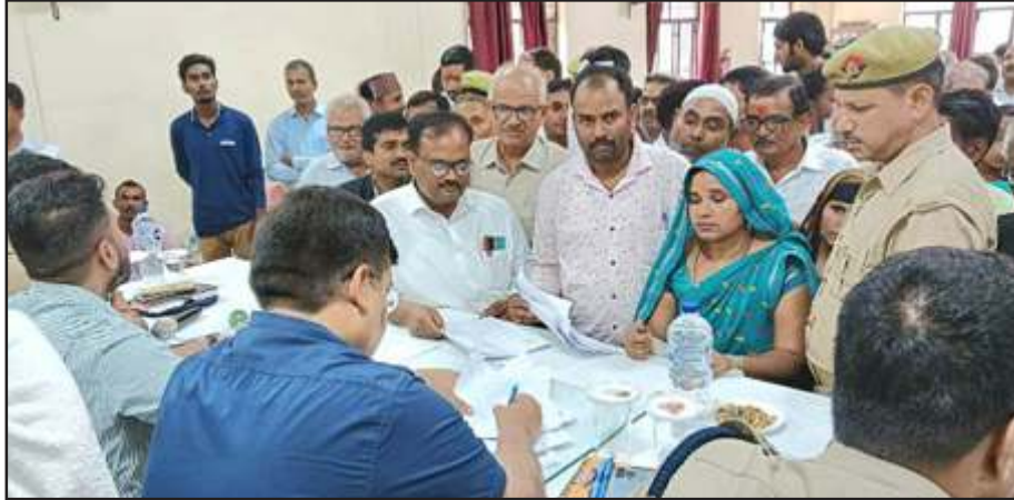
समाधान दिवस पर शिकायतें सुनते डीएम व एसपी।