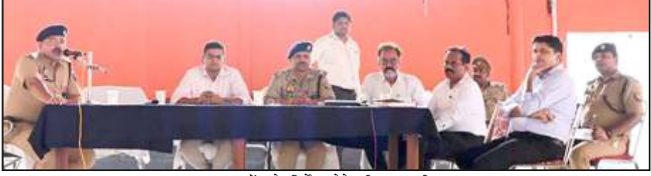
मातहतों को निर्देश देते डीएम-एसपी।