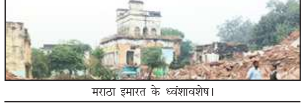
मराठा इमारत के ध्वंशावशेष।

चित्रकूट। हादसे अब तो बहुत तेज कदम आते हैं, कौन जलते हुए माहौल की तस्वीरें लिखते हैं, यहां तो सिर्फ बिकने वालों के हाथों में कलम आते हैं- ऐसा ही कुछ माहौल वीते दिनों मराठा कालीन इमारत को ढहाने के मामले में देखा गया। जिनका जन्म ही दलाली-जालसाजी-मुंह में राम, बगल में झूठी रीं हो, उनसे पत्रकारिता की परिभाषा पूछना ही बेकार है। पत्रकारिता तो आम जनता के लिए कुर्बान हो जाने को कहते हैं- यहां तो पांच सौ- हजार रुपये में कुछ लोग