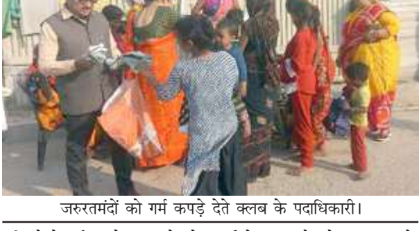
जरूरतमंदों को गर्म कपड़े देते क्लब के पदाधिकारी।