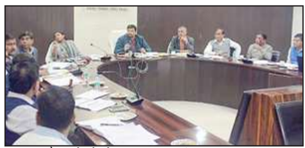
बैठक में बोलते अपर मुख्य कार्यपालक अधिकारी।

के चार गांव आ रहे हैं, कुछ गांव की चकबंदी की समस्या है। बंदोबस्त अधिकारी चकबंदी को निर्देश दिये हैं कि गाटा बनाकर, सर्वे कर तीन दिन में दें। अपर मुख्य कार्यपालक अधिकारी ने अधिशासी अभियंता जल निगम से यमुना नदी से पानी लाने बाबत जानकारी ली। अधिशासी अभियंता जल निगम ने बताया कि रोड किनारे से पाइपलाइन शिफ्ट की जायेगी। राजापुर-पहाड़ी हाईवे जो वनाच्छादित हैं, एनओसी बाबत जानकारी ली। सिंचाई विभाग व लघु डाल से भी एनओसी देने के निर्देश दिये। अपर मुख्य कार्यपालक