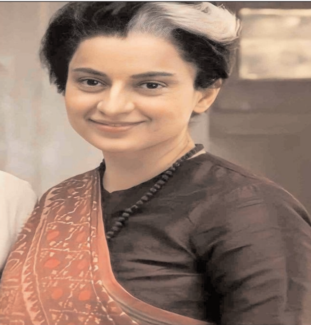
कंगना ने कहा कि तत्कालीन प्रधानमंत्री को राष्ट्रपति रिचर्ड निक्सन ने धमकाया था। हूमेने खुद इमर्जेंसी में श्रीमती गांधी की बायोपिक पर काम किया है। निक्सन ने उन्हें बहुत बुरी तरह से ट्रिट किया था। मीडिया में बोला था। बुली किया था। (जब मैंने इंदिरा गांधी पर शोध किया,

तो मुझे पता चला कि रिचर्ड निक्सन ने उन्हें कैसे धमकाया था)। लेकिन अब, हिंसा से और केवल प्रेम से, पीएम मोदी सचमुच मानवता की मशाल थामे हुए हैं। हम, भारतीय बहुत गर्व महसूस करते हैं हूँ।