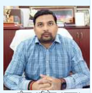
डीएम अभिषेक आनन्द।

चित्रकूट। जिला मजिस्ट्रेट अभिषेक आनन्द ने बताया कि प्रदेश शासन के निर्देश पर टंडी में सड़क हादसों से होने वाली मौतों की तादाद में कमी लाने की गरज से एजुकेशन, एनफोर्समेंट, इंजीनियरिंग, इमरजेंसी केयर व इनवायरमेंट पर जोर देते हुए एकजुट होकर सड़क सुरक्षा से जुड़े सभी विभागों की कार्य योजना बनाई जायेगी। गुरुवार को जिला मजिस्ट्रेट अभिषेक आनन्द ने बताया कि परिवहन, गृह, लोक निर्माण, चिकित्सा, शिक्षा की कार्य योजना पर 2023-24 में द्वितीय सड़क सुरक्षा पखवाड़ा 15 से 31 दिसंबर तक मनाया जाएगा। संबंधित अधिकारियों से कहा कि द्वितीय सड़क सुरक्षा पखवाड़े को सफल बनाने को संबंधित विभागों से तालमेल करते हुए आवश्यक कार्यवाही कराई जाये, ताकि अधिक से अधिक प्रचार प्रसार हो सके।