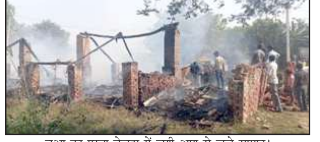
बुआ का पुरवा बेलहा में लगी आग से जले सामान।

घर पर कोई नहीं था। इसी बीच उनके छप्परनुमा घर में शार्ट सर्किट से आग लग गयी। जानकारी होते