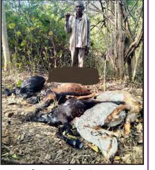
जहरीले पानी से मरी बकरियां।

मानिकपुर/चित्रकूट। रानीपुर टाइगर रिजर्व के जंगल के तालाब का जहरीला पानी पीने से दस बकरियों की मौत हो गई। आशंका जताई कि किसी ने वन्य प्राणियों के शिकार करने को पानी में जहर मिलाया था।