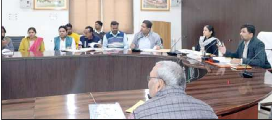
बैठक में निर्देश देते डीएम।

चित्रकूट। जिलाधिकारी अभिषेक आनन्द ने पीएमएफएमई, मुख्यमंत्री युवा स्वरोजगार योजना, एक जनपद एक उत्पाद, प्रधानमंत्री रोजगार सृजन की समीक्षा में सभी शाखा प्रबंधकों से कहा कि भारत सरकार व प्रदेश सरकार की विभिन्न जनकल्याणकारी योजनाओं का लाभ देने को बैंकों के कोऑर्डिनेटर सही ढंग से आवेदनों की समीक्षा नहीं हो पा रही थी, शाखा प्रबंधकों की इसीलिए बैठक बुलाई है। गुरुवार को कलेक्ट्रेट सभागार में बैठक की अध्यक्षता करते हुए जिलाधिकारी ने कहा कि सभी लोग बैठकों में हिस्सा लेकर विभिन्न योजनाओं के आवेदनों का सही ढंग से निस्तारित करेंगे। लोग उद्यम लगाकर रोजगार से जुड़ सकेंगे।