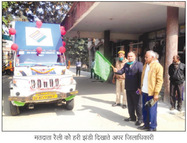
मतदाता रैली को हरी झंडी दिखाते अपर जिलाधिकारी

वैन को हरी झण्डी दिखाकर रवाना किया। इस वैन का मुख्य उद्देश्य गांव-गांव में जाकर लोगों को ईवीएम और वीवीपैट मशीन से मतदान करने के लिए जागरूक करना है। इस अवसर पर अन्य अधिकारी एवं कर्मचारी गण उपस्थित रहे।