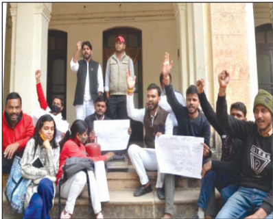
नारेबाजी करते छात्र