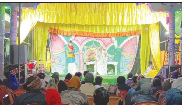
रामलीला मंचन में उपस्थित भक्तगण

कौशांबी। चायल तहसील के ग्राम पंचायत बलीपुर टाटा में चल रही पांच दिवसीय रामलीला के पहले दिन भगवान राम, लक्ष्मण, भरत एवं शत्रुघ्न के जन्मोत्सव की लीला दिखाई गई। भगवान राम के प्रकट होते ही भक्तों ने जयकारे लगाए और उनकी आरती की रावण कुंभकर्ण के अत्याचारों से पृथ्वी कांप उठी। इधर मेघनाद ने तैतिस कोटि देवी देवताओं को जीतकर इन्द्र लोक में कब्जा कर लिया। इससे देवताओं में हाहाकार मच गया। आखिर में तैतिस कोटि देवी देवता और पृथ्वी भगवान विष्णु के शरण में पहुंचे। भगवान विष्णु से उन्होंने रावण, कुंभकर्ण, मेघनाद आदि राक्षसों के अत्याचारों से मुक्ति दिलाने की गुहार लगाई। इस पर भगवान विष्णु ने कहा कि जन्म देव ही मैं रामावतार लूंगा और राक्षसों का बध करके उनके अत्याचारों से आप सबको मुक्ति दिलाऊंगा। इस घटना के बाद राजा दशरथ के पुत्र न होने पर राजा दशरथ मुनि वशिष्ठ के पास गए और अपने दुख का कारण बताया। राजा दशरथ