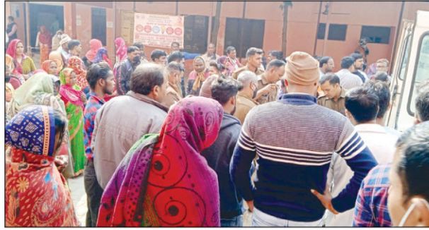
सीएसपी फूलपुर में घायलों के साथ पुलिस