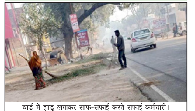
वार्ड में झाड़ू लगाकर साफ-सफाई करते सफाई कर्मचारी।