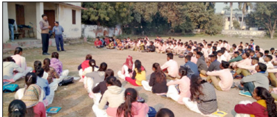
छात्र-छात्राओं को जानकारी देते स्काउट मास्टर