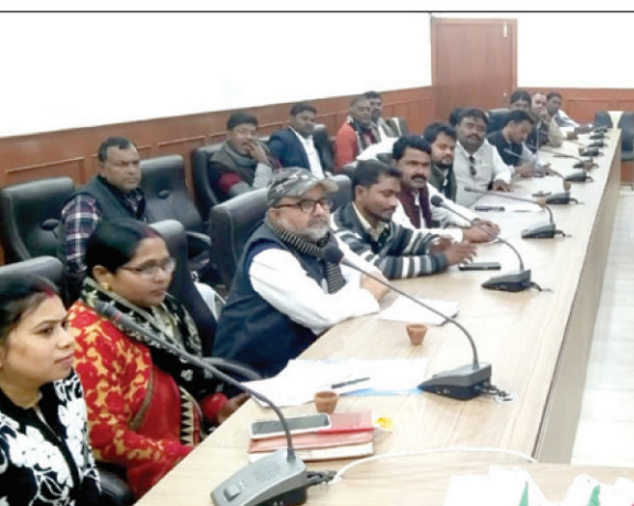
विकास भवन सभागार में ग्राम प्रधान संगठन की बैठक को सम्बोधित करते मुख्य विकास अधिकारी व अन्य।