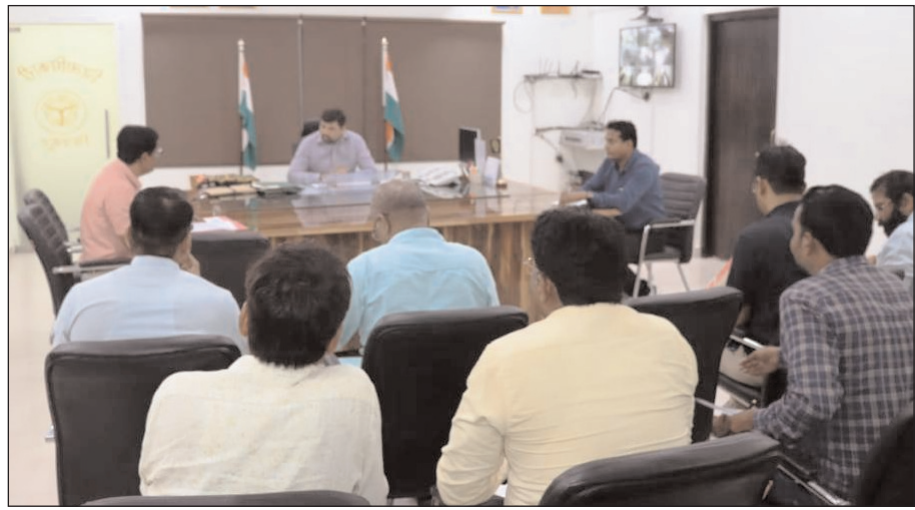
खाद्य निगम से प्राप्त रिलीज ऑर्डर को पोर्टल पर प्राप्त करेंगे। पीएम पोषण योजना को जिला बेसिक

मुख्यालय लॉगिन से अंतिम रूप से त्रैमासिक आवंटन लॉक करते ही उचित दर दुकानवार का ई-चालान खुद जनरेट हो जाएगा। खाद्य एवं रसद विभाग की वेबसाइट के पब्लिक डोमेन पर डाउनलोड को उपलब्ध रहेगा। चालान सृजित होने के बाद डीएसओ लॉगिन से सिंगल स्टेज परिवहन व्यवस्था के तहत योजनाओं के खाद्यान्न उठान को सिंगल स्टेज परिवहन ठेकेदारों को लॉगिन तथा पीएम पोषण के तहत योजनाओं के खाद्यान्न उठान को सिंगल स्टेज परिवहन ठेकेदारों की अध्यक्षता में कैम्प कार्यालय में हुई बैठक में कोटेदार के आवंटन की फीडिंग के बाद डीपीओ/बीएसए डिजिटल हस्ताक्षर से ब्लॉक गोदामवार लॉक करेंगे। भारतीय