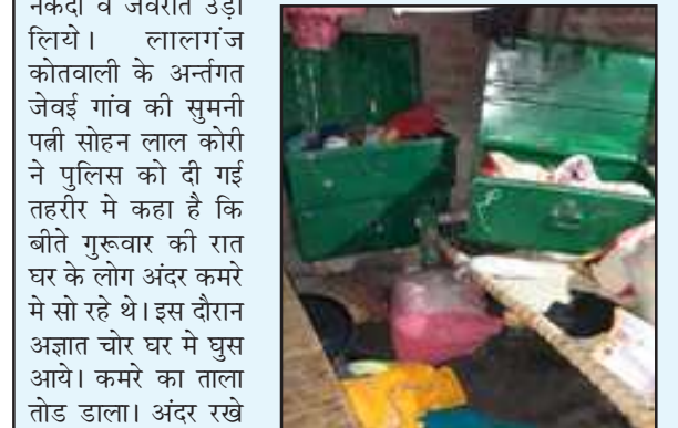
जेवई गांव के एक घर में हुई चोरी के बाद बिखरा सामान।