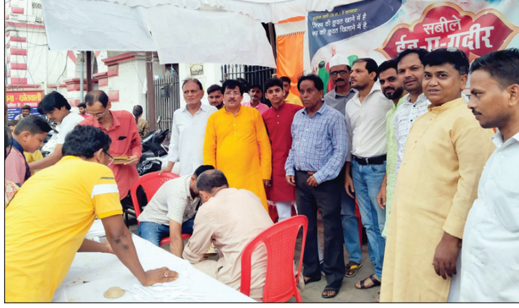
माह ज़िलहज्जा की अद्वारह को गदीर ए खुम के मैदान में पैगम्बर इस्लाम हजरत मोहम्मद ए मुस्तफा (स०अ०व०) ने अल्लाह के हुक्म से मजमे में एक ऊंट पर खड़े हो कर यह ऐलान किया कि मन कुतो मौला फा हाजा अल्युनु मौला यानि जिसका मैं मौला उसके अली हजरत अली इब्ने अबितालिब को हजारों के

कहीं सजी महफिल तो जगहा जगहा लगे शर्बत मिठाई छोला चावल व कोल्डड्रिंक आईस्क्रीम के स्टाल