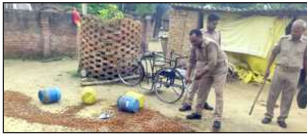
हण्डौर में छापेमारी के दौरान शराब व लहन को नष्ट करती आबकारी टीम।