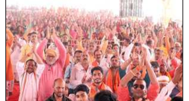
पण्डल में उमड़ा कर्कातों जनसैलव।