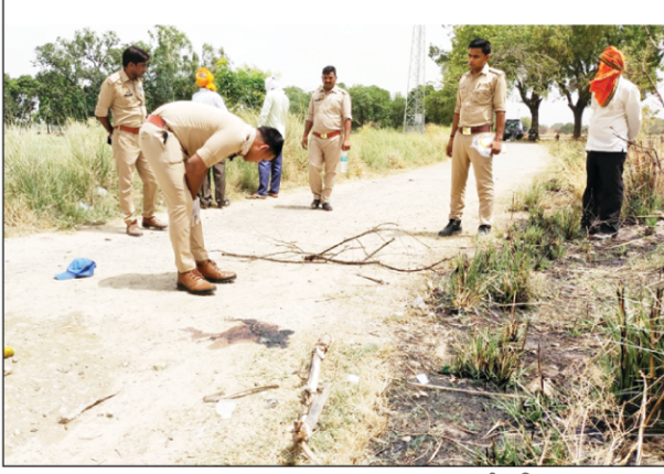
घटनास्थल पर पड़ा खून व जांच पड़ताल करती पुलिस