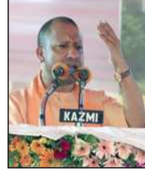
जनसभा को सम्बोधित करते मुख्यमंत्री योगी आदित्यनाथ सिंह।