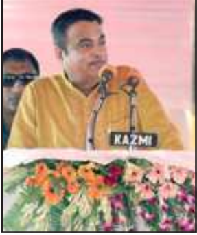
जनसभा को सम्बोधित करते केन्द्रीय मंत्री नितिन गडकरी।

फोर लेन सड़क का निर्माण, कुल 43 किमी 1290 करोड़ से बनेगा। इसी प्रकार प्रतापगढ़ शहर में भुपियामऊ से गोडे, तक 11 किमी तक फोरलेन सीसी सड़क बनेगी। गडकरी ने कहा कि सांसद संगम लाल गुप्ता की मांगों को स्वीकार कर लिया गया है। प्रतापगढ़ के बाईपास का छह किमी एक्सटेंशन के लिये 225 करोड़ रुपये की स्वीकृति दी है। इसके अलावा चिलखिला से मुसाफिरखाना के लिये फोरलेन सड़क के लिये 333 करोड़ रुपये की स्वीकृति दी है। केन्द्रीय मंत्री के साथ प्रदेश के मुख्यमंत्री योगी आदित्यनाथ ने कहा कि गडकरी जी से चाहे जितनी बड़ी योजना मांग लीजिये, वह कभी न नहीं करते। मुख्यमंत्री ने कहा कि कल मैं बनारस में जी-20 की बैठक में था जहां 28 देशों से आए प्रतिनिधि काफी की सड़कों व विकास कार्यों के अलावा गंगा आरती देख अविभूत हुए हैं। इस अवसर पर राष्ट्रीय प्रवक्ता शाहनवाज हुसैन ने कहा कि पूरी दुनिया में मां दी ने देश का नाम रोषन किया है और हमें गर्व है कि हम आज उनके विकास कार्यक्रमों के सहभागी बन रहे हैं।