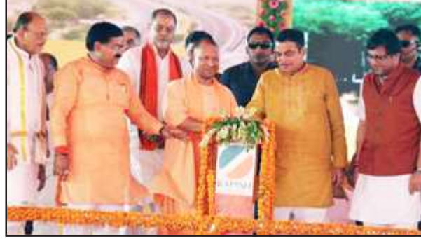
परियोजनाओं का बटन दबाकर शिलान्यास करते केन्द्रीय मंत्री नितिन गडकरी, मुख्यमंत्री योगी आदित्यनाथ सिंह व अन्य।