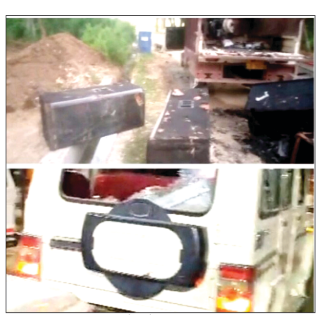
तोड़ फोड़ का दृश्य

कौशाम्बी। जिले के करारी थाना क्षेत्र में शादी में द्वारचार के दौरान किसी बात को लेकर कन्या पक्ष के दर्जनों लोगो ने वर पक्ष के लोगो को जमकर लाठी डंडों से पीट दिया,लोगो ने डीजे में आग लगा दी और बारात में शामिल दूल्हे की गाड़ी सहित कई चार पहिया गाड़ियां भी तोड़ दी,जिसमें बारात पक्ष के दूल्हे के बड़े भाई,भतीजे सहित कई लोग घायल हो गए,सभी घायलों का इलाज चल रहा है वहीं एक व्यक्ति की हालत ज्यादा नाजुक होने के चलते उसे जिला अस्पताल में भर्ती कराया गया है। घटना करारी थाना क्षेत्र की है। जानकारी के मुताबिक मोहब्बत पुर पईसा थाना क्षेत्र के कैमा से