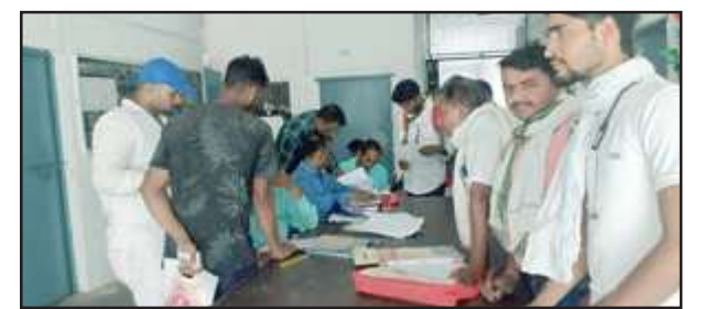
अंक पत्र में सुधार के लिये लगी भीड़।