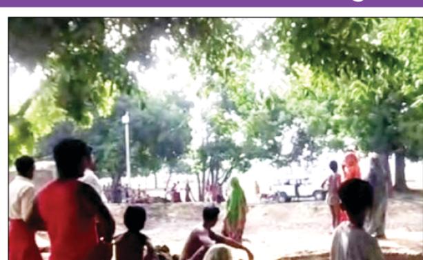
घटना के बाद जुटी लोगों की भीड़