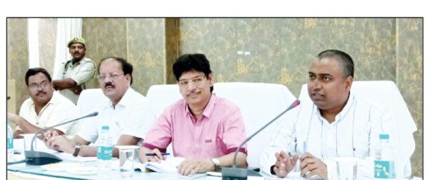
समीक्षा करते जिलाधिकारी

सभी अधिकारियों को प्रतिदिन 10 बजे से 11 बजे तक जनता दर्शन कर आमजन की समस्याओं को निस्तारित करने के निर्देश