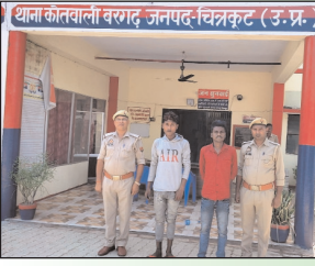
थाना कोतवाली बरगढ़, जमपद-चित्रकूट (उ.प्र.)