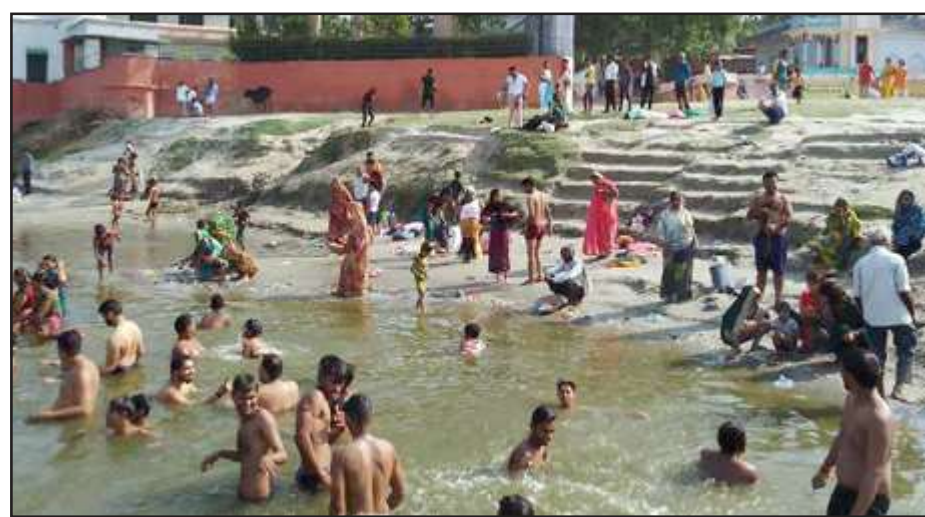
गंगा घाट पर स्नान करत श्रद्धालुगण।