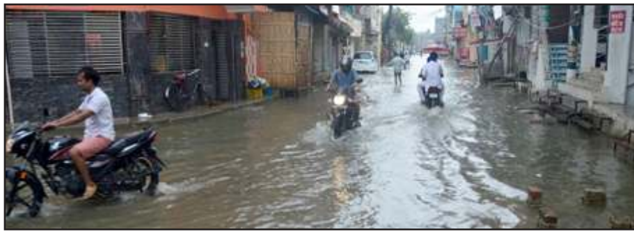
मार्ग पर हुए जलभराव के बीच जाते लोग।

स्नातकोत्तर महाविद्यालय के सामने राजमार्ग पूरा ढूबा दिखाई दिया। इस राजमार्ग पर बड़े-बड़े गड़बो हो गये हैं जो जलभराव में दिखाई नहीं देते। ऐसे में नेताओं व अधिकारियों की चार पहिया गाड़ियां तो आसानी से निकल जा रही थी लेकिन दो पहिया वाहन इन गड़बो में लुढ़कते दिखाई दिये। इसके अलावा रेलवे स्टेशन रोड पर भयंकर जलभराव हो गया था। इससे रेल यात्रियों के आवागमन में दिक्कत हुई। इसी प्रकार पुलिस अधीक्षक कार्यालय, साकेत गर्ल्स कालेज, लोक निर्माण विभाग का