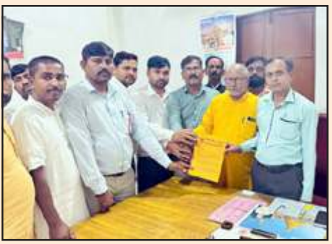
फोटो 2-अधिकारी को ज्ञापन देने विहिप के पदाधिकारी