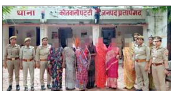
पुलिस की गिरफ्त में पुलिस टीम पर हमला करने वाली महिलाएं।

पट्टी, प्रतापगढ़। पट्टी पुलिस कुन्दनपुर में नोटिस तामिला कराने हेतु पहुंची तो आरोपी के घर की महिलाओं द्वारा पुलिस टीम के साथ अभद्रता, गाली गलौज, ईट-पत्थर, लाठी डंडा व हंसिया लेकर हमला किया गया। इस हमले में चार पुलिस कर्मी घायल हो गये। इस घटना को लेकर पुलिस ने सात महिला को गिरफ्तार किया है।