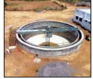
बन रहा एसटीपी सीवर ट्रीटमेंट।

चल रहा है। अक्टूबर माह में कार्य पूरा होना था। अब दिसंबर तक पूरा होने की उम्मीद है। नगर पंचायत क्षेत्र में पचास किमी पाइप लाइन बिछाने व पांच हजार कनेक्शन जोड़ने का लक्ष्य था। 40 किमी से ज्यादा लाइन बिछ गई है। सौ कनेक्शन जोड़े गये हैं। दो-तीन माह में सीवर ट्रीटमेंट का कार्य पूरा हो जाएगा। मंदाकिनी नदी को प्रदूषण से राहत मिलेगी। स्फटिक शिला से भरतघाट तक नदी किनारे अलग से पाइप लाइन बिछाई गई