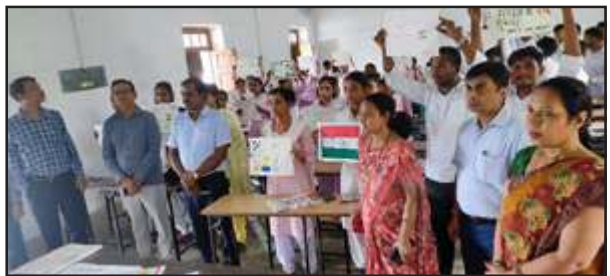
स्लोगन प्रतियोगिता में भाग लेते एनएसएस के स्वयंसेवक।