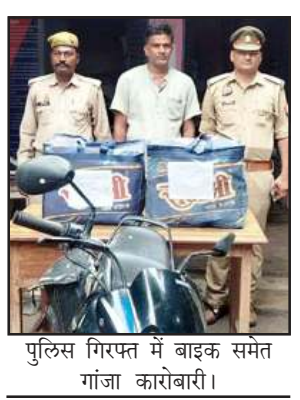
पुलिस गिरफ्त में बाइक समेत गांजा कारोबारी।