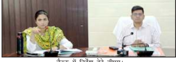
बैठक में निर्देश देते डीएम।

अखंड भारत संदेश चित्रकूट। जिलाधिकारी शिवशरणप्पा जीएन ने जिला शिक्षा व अनुश्रवण समिति की बैठक कहा कि स्कूलों के निरीक्षण बाबत कमियों पर क्या कार्य हुए हैं, बतायें। 19 पैरामीटर के तहत कार्यों का डीएम ने टॉयलेट बाबत जानकारी ली। खंड शिक्षाधिकारी को निर्देश दिये कि जिन संबंधित स्कूलों में टॉयलेट नहीं हैं, उसे समन्वय बनाकर बनवायें। शुक्रवार को डीएम शिवशरणप्पा जीएन ने कलेक्ट्रेट स्थित सभागार