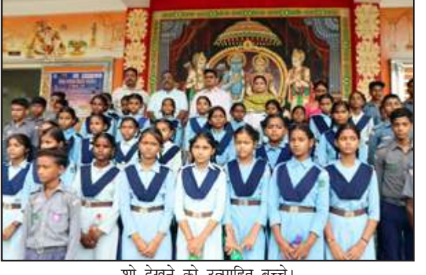
शो देखने को उत्साहित बच्चे।