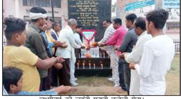
लक्ष्मीबाई की जयंती मनाती बुंदेली सेना।