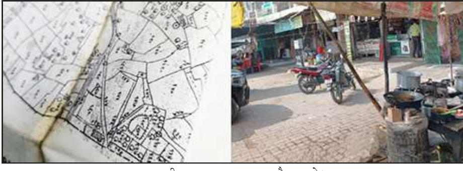
सरकारी सड़क का नक्शा व अवैध कब्जे।

चित्रकूट। लोग टूट जाते हैं एक घर बनाने में, तुम तरस नहीं खाते बस्तियां उजाड़ने में- बशीर बद्र का ये शेर इन दिनों जिला प्रशासन पर माकूल बैठता है। जिला प्रशासन ने शहर में 50-60 साल से बस स्टैण्ड व पुरानी कोतवाली तथा जिला पंचायत के सामने रहने वाले लोगों को तो उजाड़ दिया है, लेकिन शहर के हृदय स्थल बस स्टैण्ड पर सड़क व कुआ नम्बर 144 को नहीं खुलावा रहा, क्योंकि सड़क व कुआ पर दौलतमन्द लोग अवैध ढंग से कब्जा किये हैं।