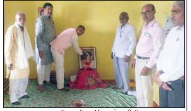
इन्दिरा की जयंती मनाते कांग्रेसी।

रविवार को देश की पूर्व प्रधानमंत्री श्रीमती इंदिरा गांधी की जयंती पर जिलाध्यक्ष ने कहा कि आज जिस ढंग से देश में संविधान लोकतंत्र खतरे में है। सभी कांग्रेसी संकल्प लें इंदिरा