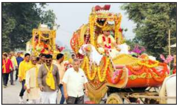
विश्वनाथगंज बाजार में निकली कलश यात्रा में शामिल श्रद्धालुगण।

महिलाओं ने सिर पर मंगल कलश रखकर श्रीमद् भागवत