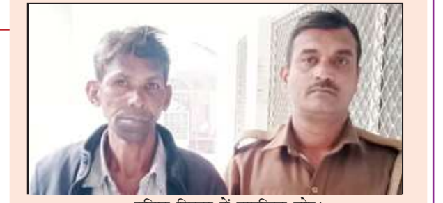
पुलिस गिरफ्त में साइकिल चोर।