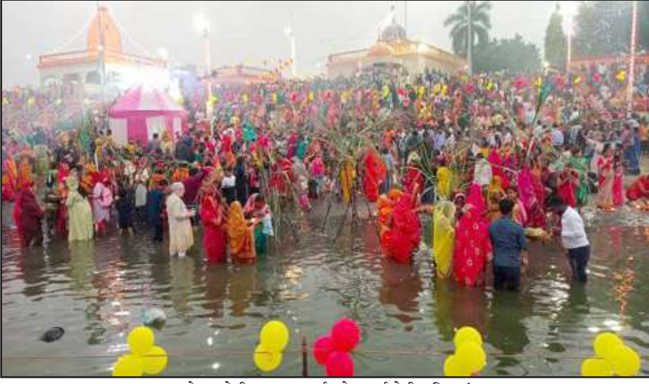
बेल्हा देवी घाट पर सूर्य को अर्घ्य देती महिलाएं

बता दें कि सोमवार की प्रातः उगते सूर्य को यही महिलाएं अर्घ्य देकर 36 घंटे का निराजली व्रत समाप्त करेंगी। सूप और डलिया में पूजा सामग्री के अलावा ढोकवा व अन्य खाने के प्रसाद सजाकर सूर्य की उपासना में गीत गाते हुए महिलाओं ने ढलते सूर्य को अर्घ्य दिया और ढोकवा व प्रसाद लोगों को वितरित किया। महिलाओं की