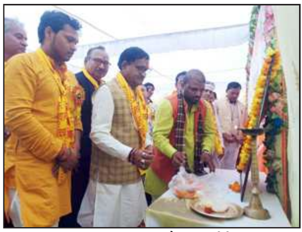
सहास्त्रबाहु पर फूल चढाते मुख्य अतिथि।