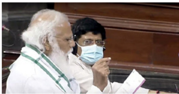
के बाद पूरे दिन के लिए स्थगित कर दी गयी। विभिन्न मुद्दों को लेकर

नई दिल्ली (एजेंसी)। संसद के मानसून सत्र की सोमवार को हंगामेदार शुरुआत हुई तथा विभिन्न मुद्दों को लेकर सरकार को घेरने के मकसद से विपक्ष के हंगामे के कारण दोनों सदनों की बैठक बार बार बाधित हुई।